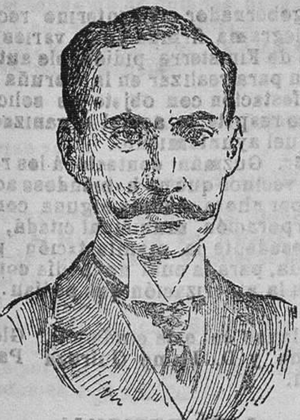
EL PRÍNCIPE CARLOS DE DINAMARCA

Y en cuanto al futuro soberano, diremos que continúa reinando el mayor número de probabilidades la candidatura del príncipe Carlos de Dinamarca. Sin embargo, no por eso puede decirse en su triunfo, porque el rey Oscar se ha hecho su saber su decisión definitiva á la Nación para que elija un príncipe de la casa Bernadotte para el trono de Noruega.