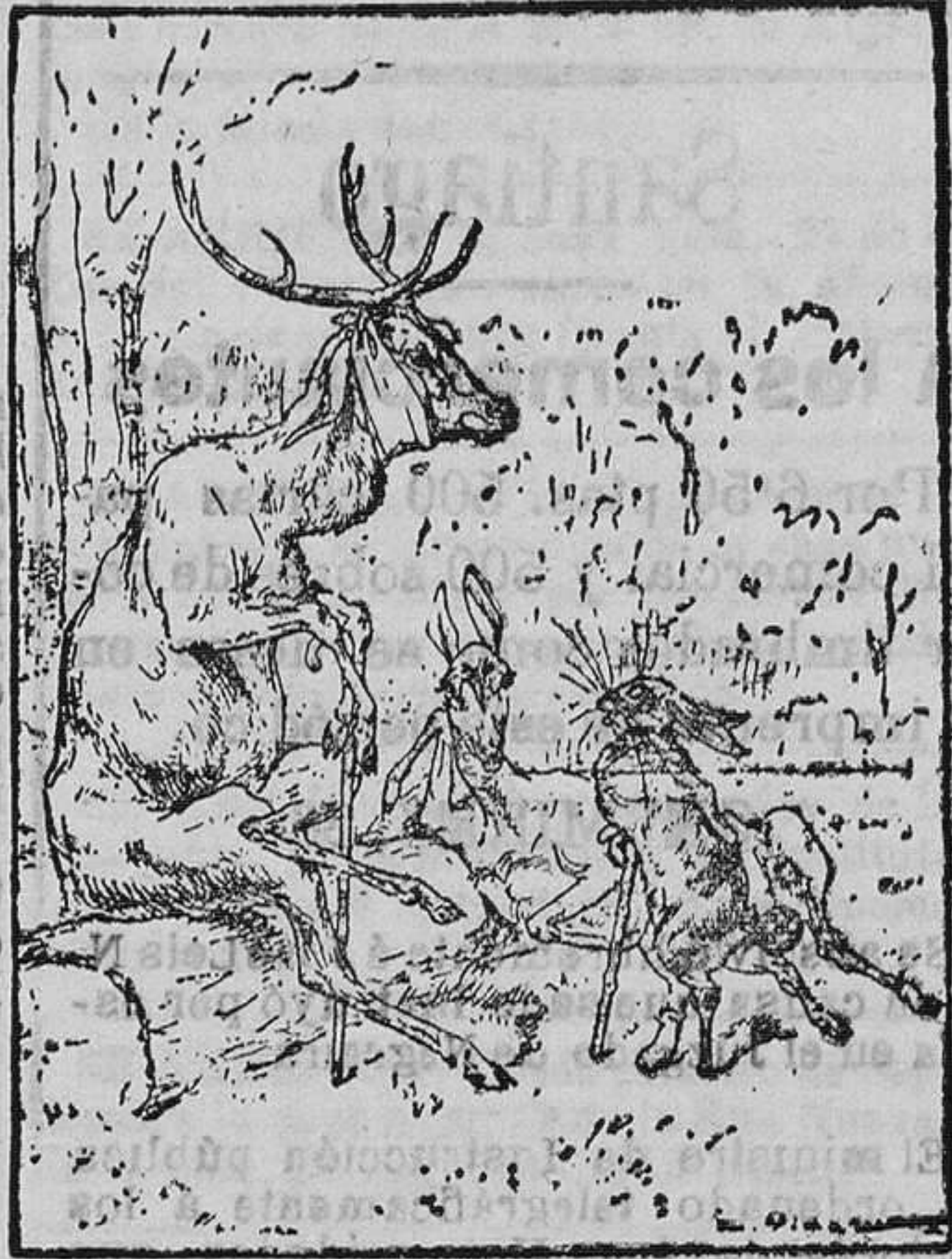
después de los primeros tiros