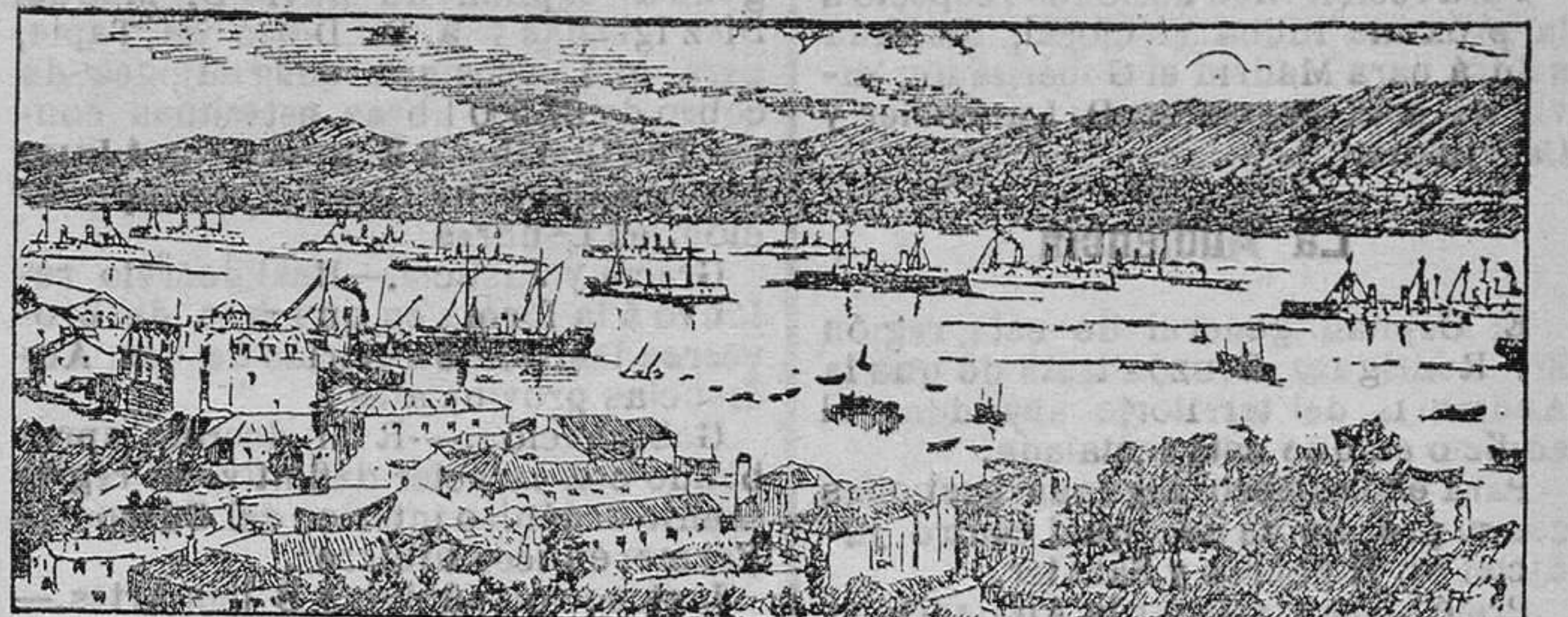
La escuadra inglesa en la ría de Vigo