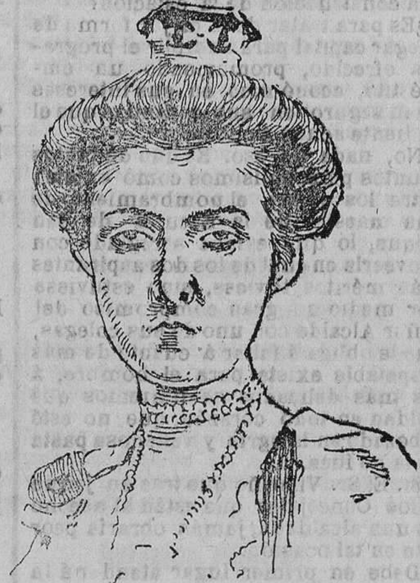
LA PRINCESA VICTORIA PATRICIA

Apesar de este inconveniente, el proyecto del real enlace gana terreno en la fantasía popular, y se recuerda con agrado el reciente viaje del duque Connaught a Roma, hecho con el exclusivo obj de saludar al Pontífice actual, quien le dispensó una cariñosa acogida. También se hace mérito de las relaciones amistosas del duque con el cardenal monseñor Merry del Val, que accidentalmente nació en Londres y goza gran influencia en el Vaticano.