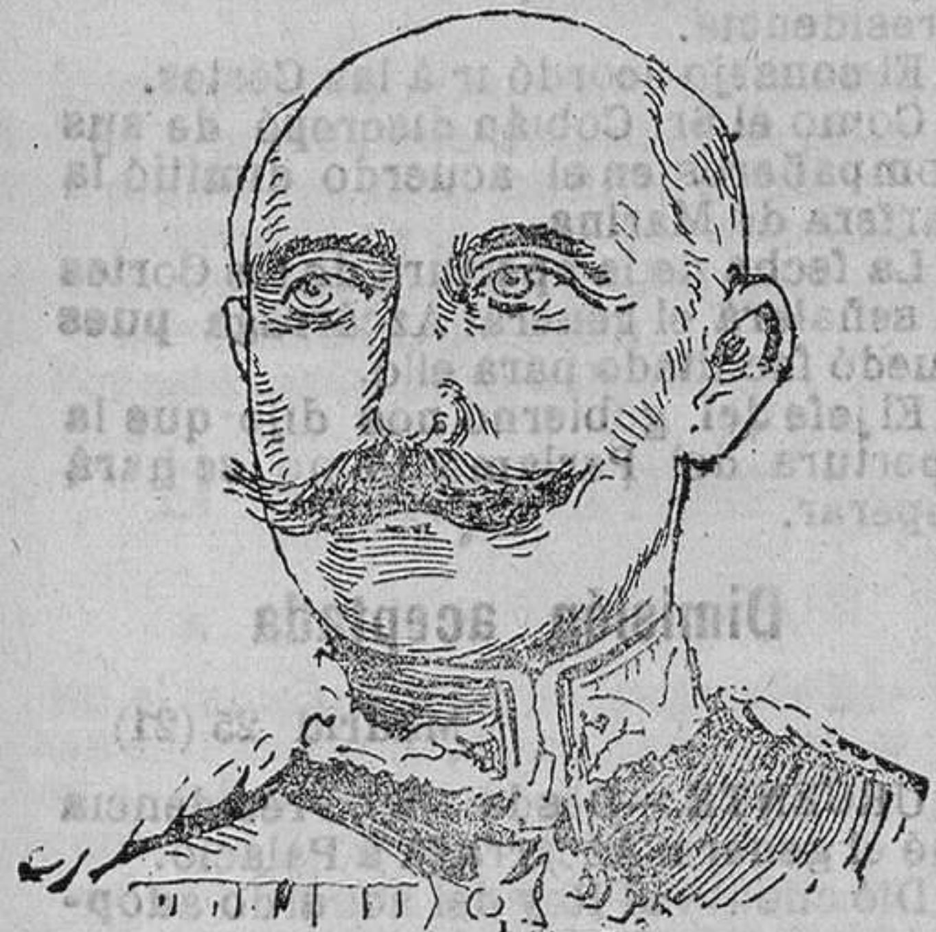
EL DUQUE DE CONNAUGHT

En nuestros tiempos, como los hechos lo han demostrado, los enlaces regio han perdido mucha de su antigua importancia e influencia en las relaciones internacionales; pero, apesar de esto, continúa preocupando a los cortesanos y a la gente política, según lo estamos viendo hoy, con motivo del futuro enlace de S. M. el Rey con una princesa extranjera.