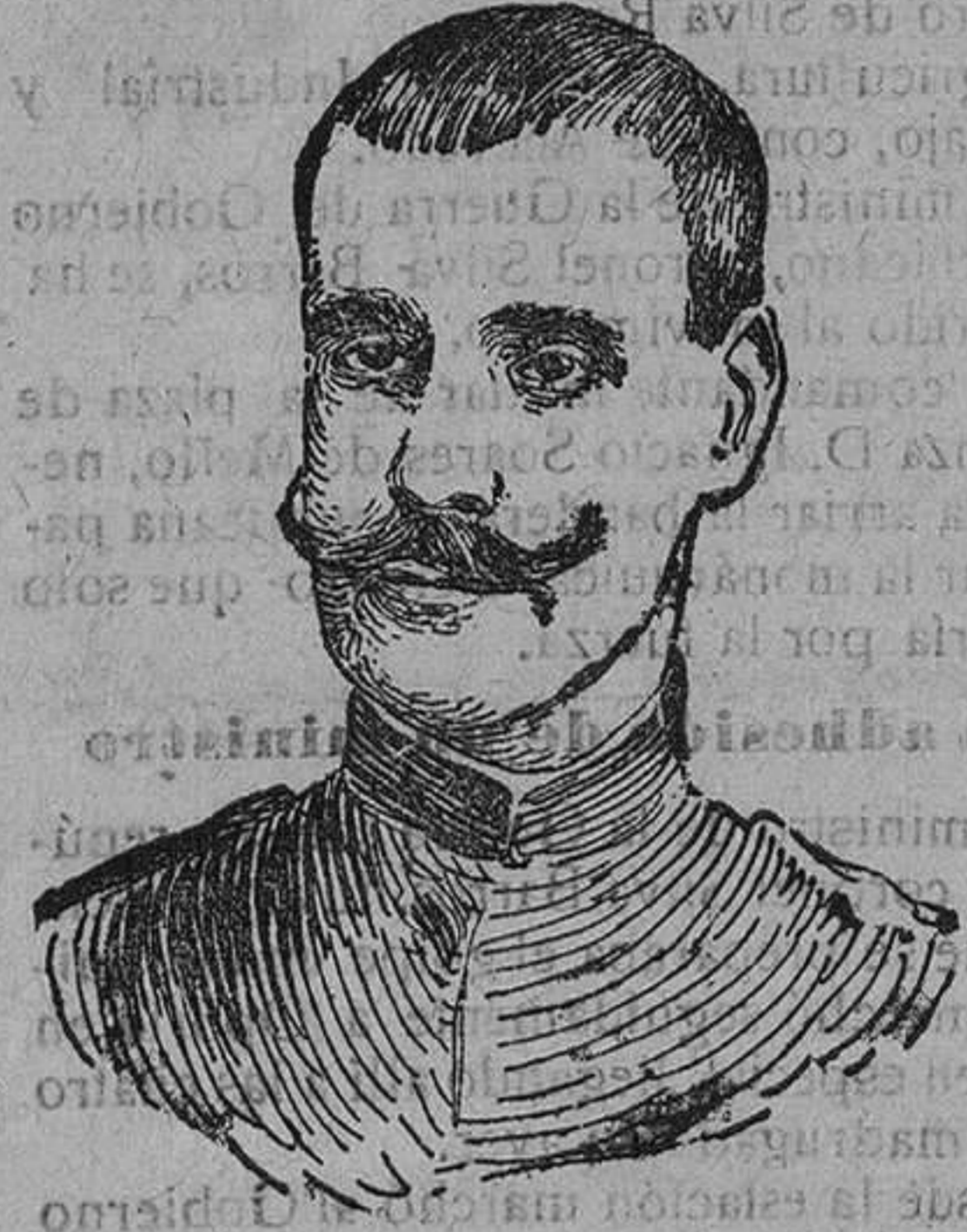
El capitán Paiva Couceiro que se puso al frente del movimiento monárquico en Portugal proclamando al ex Rey don Manuel en Oporto.