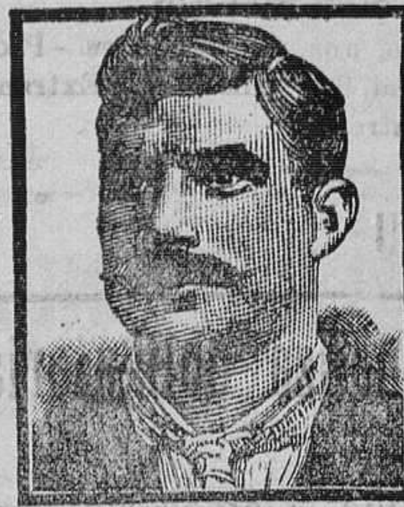
Tarrasa, Calle Media Pasco 46, 8 Marzo 1908.