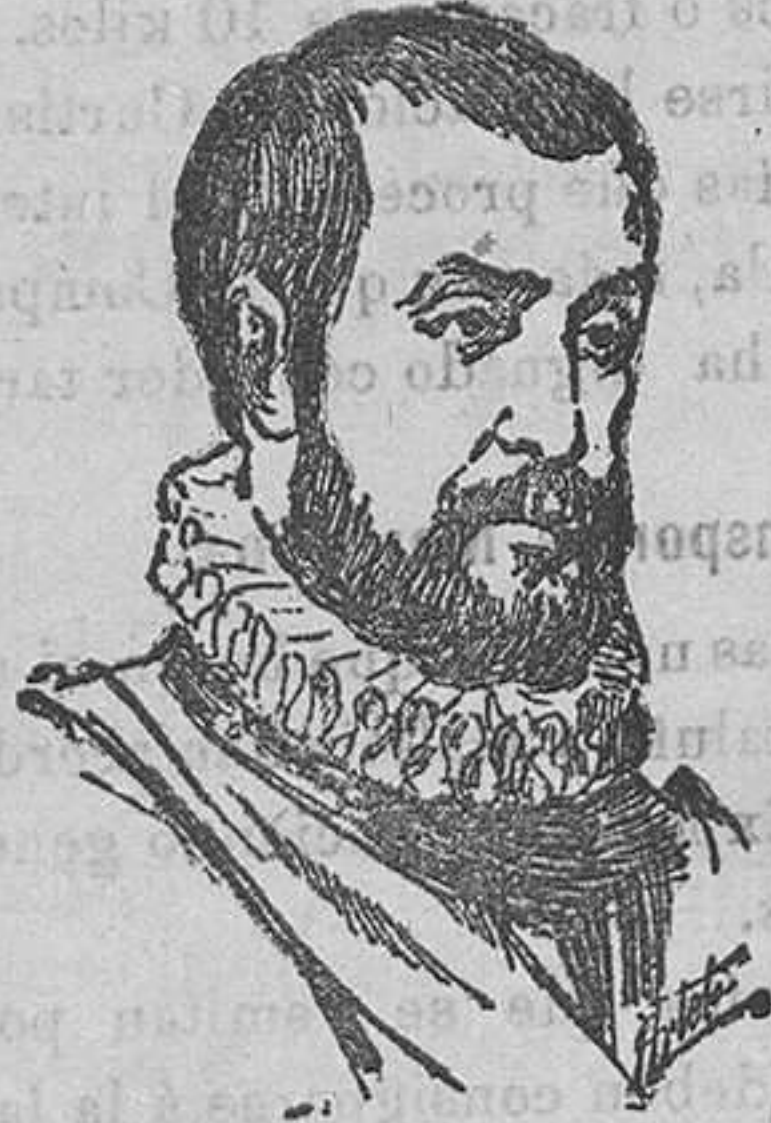
JUAN BAUTISTA DE TOLEDO

Este insigne arquitecto del Rey D. Felipe II, aunque no hubiera tomado parte principalísima en la construcción de la Basílica de San Pedro, de Roma, y no hubieran sido reedificados bajo su dirección el alcázar de Madrid y el palacio de Aranjuez y construidos diversos edificios de la capital del antiguo reino napolitano, mientras él fué «Director de las obras reales de Nápoles», una sola obra, que para desgracia suya no pudo ver terminada, le hubiera bastado para adquirir universal renombre y pasar a la posteridad con la aureola del genio: el Monasterio del Escorial, trazado y comenzado a construir.