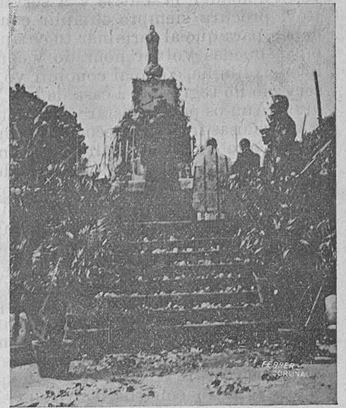
Altar levantado en la Alameda para la Misa de Campaña.

Y os hablo del patriotismo, en la forma en que debe sentirlo el Ejército, porque el sentimiento patrio que desde la cuna nos inculcan nuestros padres, el que en la escuela nos enseñan al darnos a conocer las principales epopeyas de la historia de España, el que se respira en el ambiente de este heroico pueblo; ese, ya sé que lo tenéis, ese, ya, sé que ha germinado en vuestro corazón y echado hondas raíces en vuestros fieles y leales pechos; porque ese es innato en todo buen español; pues, aún cuando por desgracia hay excepciones que parecen demostrar lo contrario, no vienen más que a confirmar la regla general, toda vez que con ellas se hace más pa-