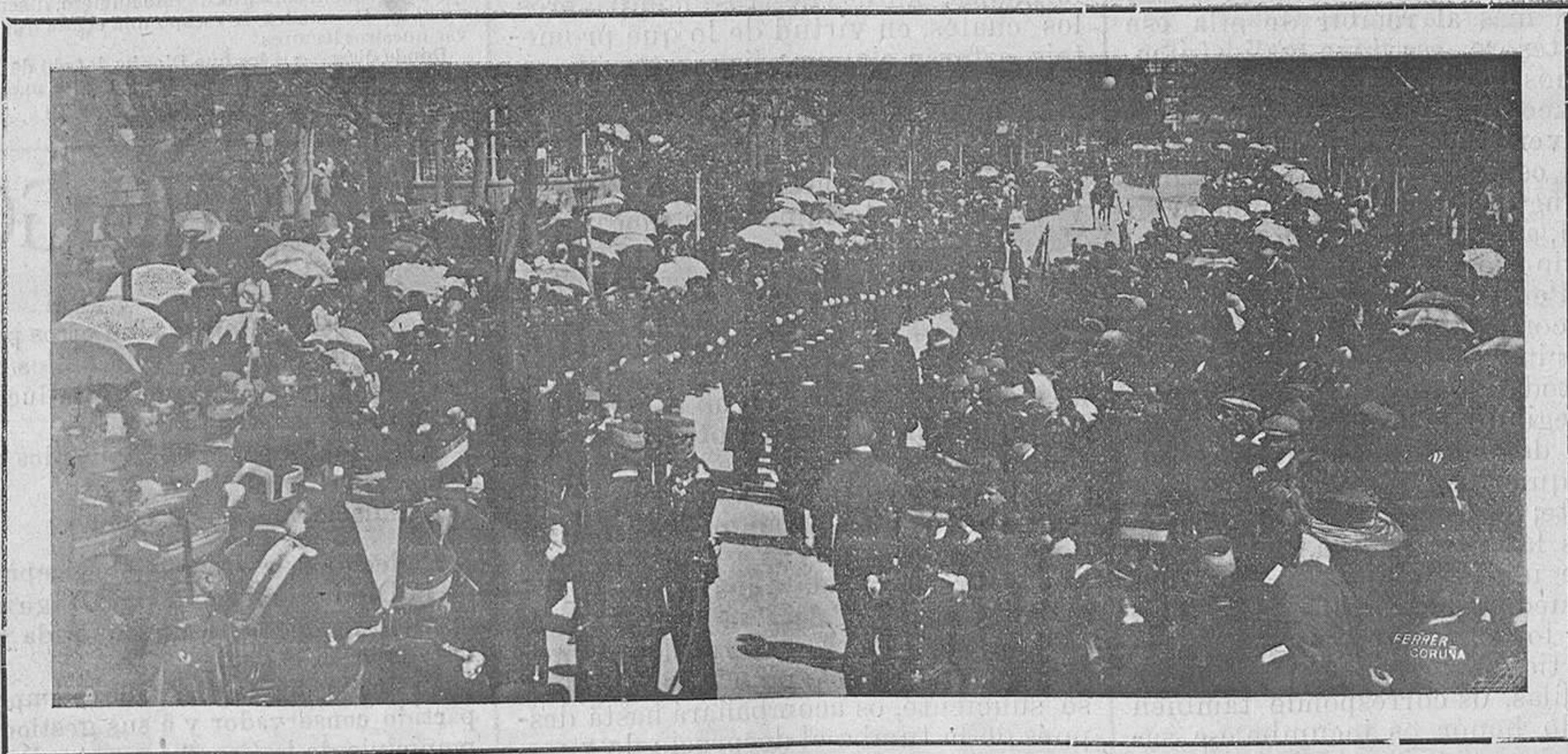
Aspecto de la Alameda en el momento de jurar la Bandera.

bios y virtuosos representantes de la Orden de Franciscanos; encantadoras y hermosas hijas de Eva; inteligentes y laboriosos representantes de la prensa periódica; selecta y distinguida concurrencia; mis queridos compañeros de armas y reclutas del Glorioso regimiento de Zaragoza.