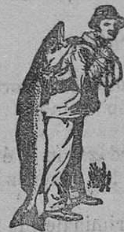
Obligábase siempre la Emulsión de Scott á la marca «El Pescador», marca del procedimiento Scott!

en la envoltura garantiza los mejores ingredientes, la elaboración mas hábil y por consiguiente los efectos mucho mas energicos, que en ninguna otra emulsión; ventajas que valen mucho más, que el pequeño aumento en el precio que exigen. En todas las farmacias. Empiece hoy! D. Carlos Marés, Calle de Valencia No. 333, Barcelona, envía muestra gratis al que remita 75 cts. en sellos para el franqueo.