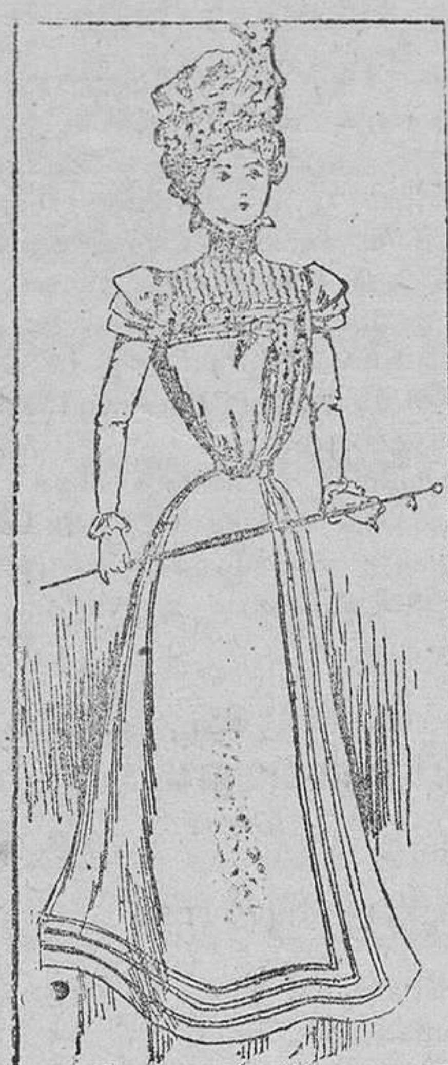
Traje para señorita

El traje que nuestro dibujo representa es de lana. Lleva el cuerpo flojo en el talle, con canesú de raso compuesto de pequeñas alforcitas y adornado el delantero por rulos de raso en forma de escuadra. Este cuerpo va abrochado al lado izquierdo. Las mangas son estrechas con encaje en el borde; el cuello alto y el cinturón de cinta. La falda va adornada con rulos de raso que parten de la cintura hasta el borde.