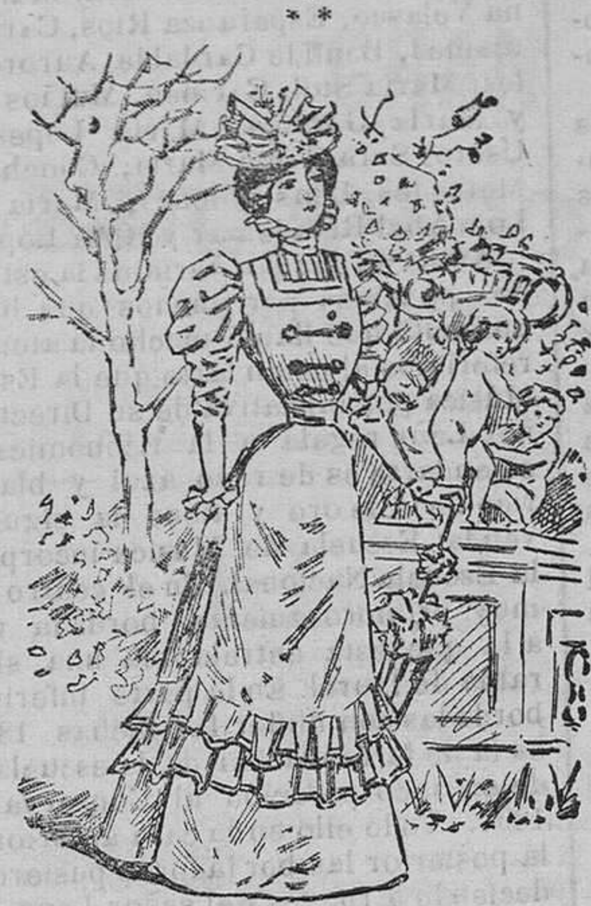
Traje para paseo.

dós y dos volantes de batista; cuello alto con volante de encaje, mangas al biés con volante en el borde y falda adornada con siete volante á la inglesa.