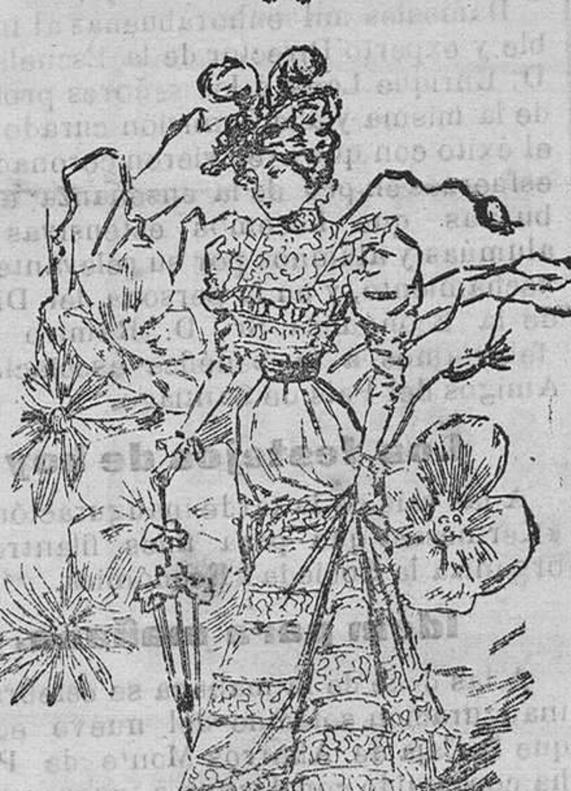
Traje para reuniones.

De velo-religiosa. Cuerpo escotado y abrochado al lado; con un volante de gasé; cintas de terciopelo estrecho adornan el escote, y tres cintas azules con chús can colocadas en el delantero del cuerpo. Camisolín y cuello de gasé; mangas al biés con volante y falda acampanada, adornada con dos volantes á la inglesa.