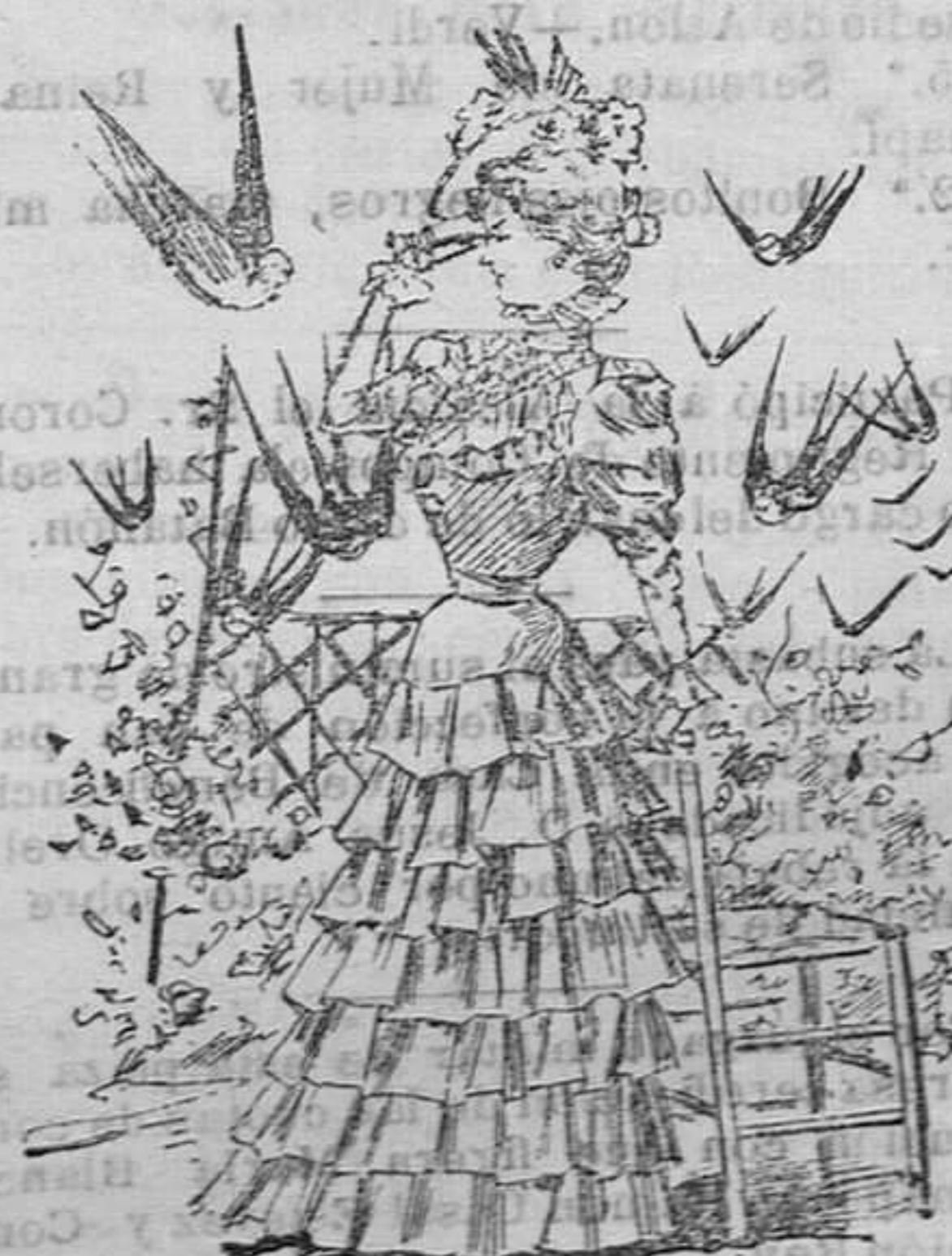
Traje para campo.

Modelos exclusivos, para nuestras lectoras, de los grandes Almacenes de EL SIGLO, BARCELONA.