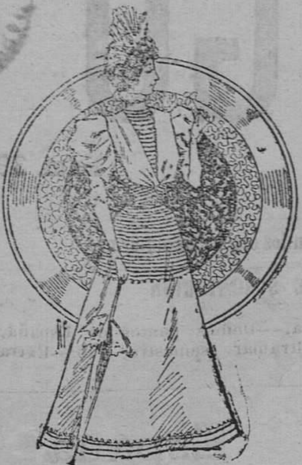
Traje para carreras

De granadina sobre un viso de seda tornasol. Cuerpo ajustado y cubierto de pequeños rulos de raso; lleva en el delantero unas tiras de seda recogidas en la cintura. Cuello de gasa acordonada; mangas de una pieza y falda en forma de campana con rulos de raso y en el borde de estos un pequeño agremán.