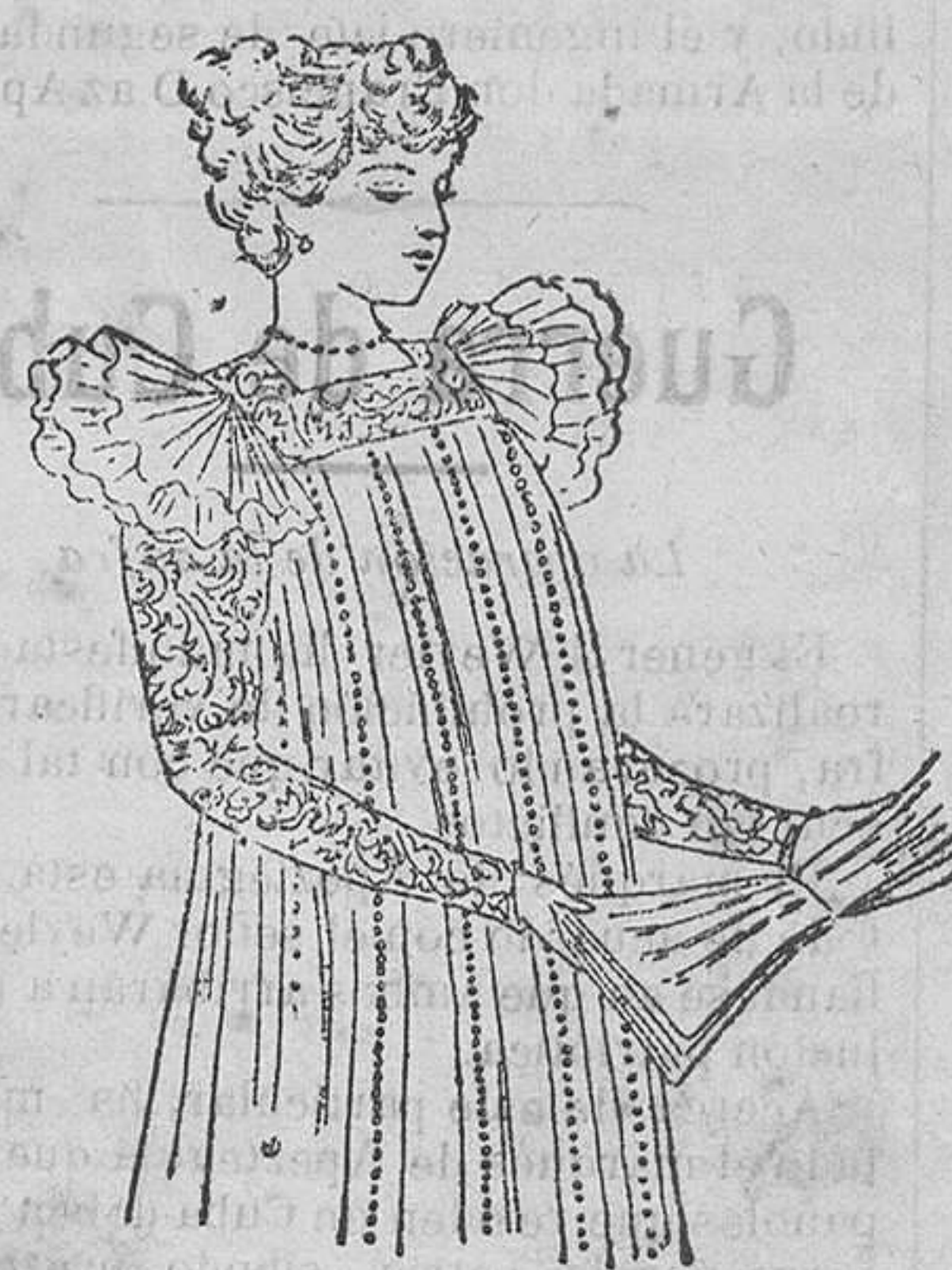
BATA PARA SEÑORITA

Es de gasé, cubierta de muselina de seda negra y plegada acordeón, con seis hilos de azabaches formando pico. El cuello es escotado, con un bonito entredós bordado sobre tul alrededor del escote, y la manga de gasé, cubierta de tul bordado con tres volantes de muselina plegada acordeón.