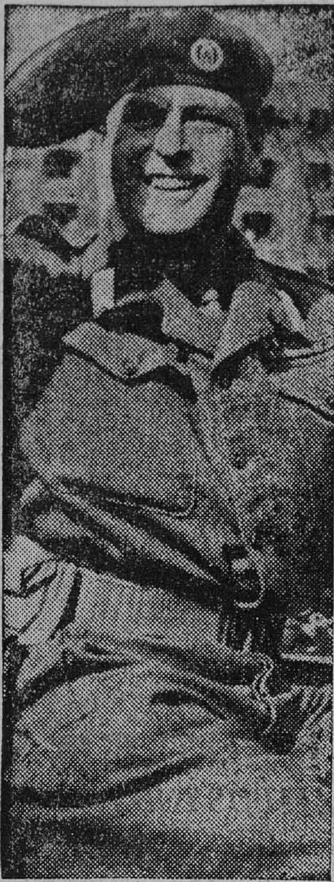
OLAF DE NORUEGA