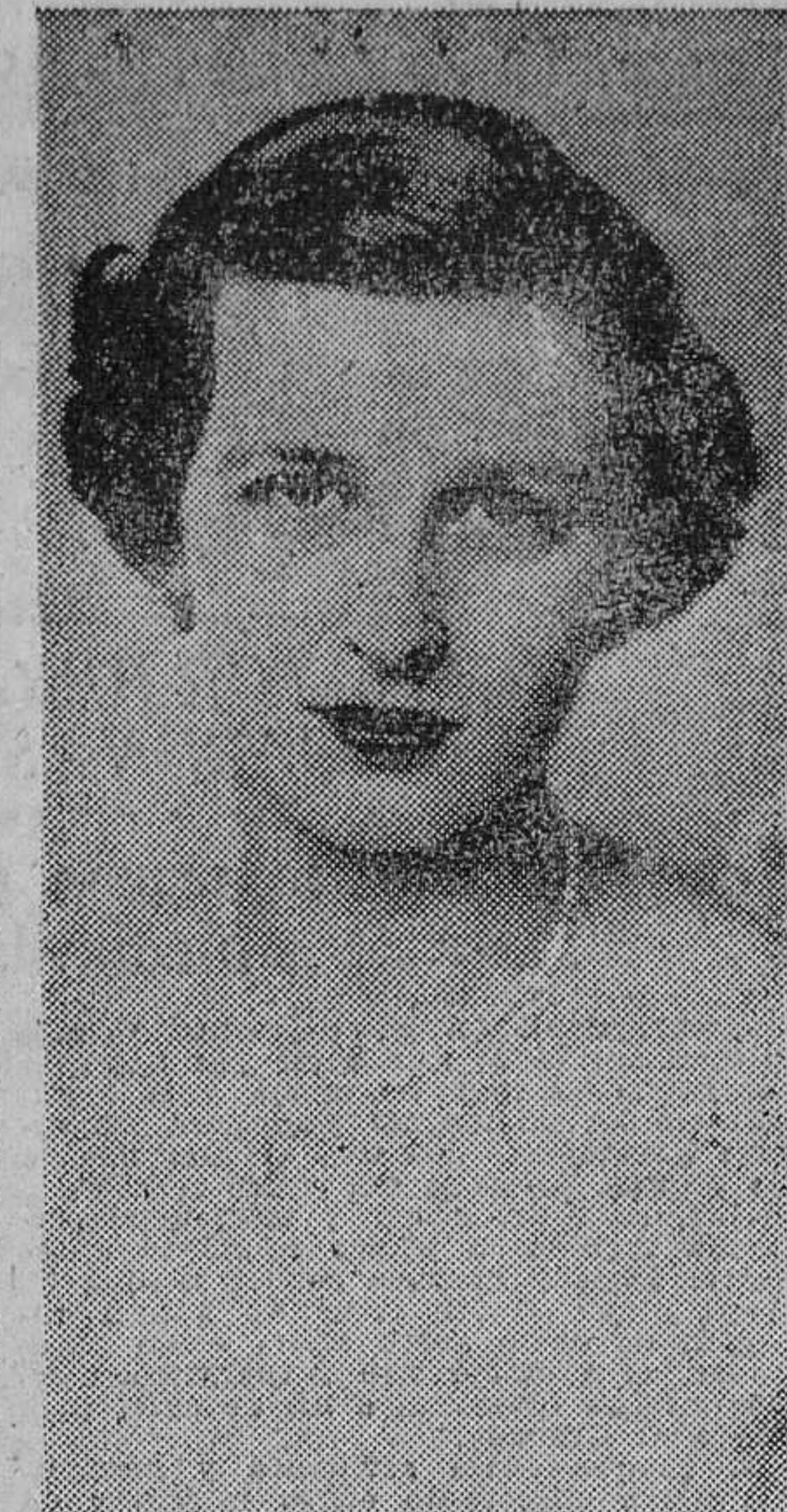
DUQUESA DE KENT

LONDRES, 12. — Veinte miembros de la Federación de Industrias Británicas han salido en avión con dirección a España, para «explorar las posibilidades de incremento del comercio anglo-español». Los hombres de negocios británicos van acompañados de sus esposas y se dirigen directamente a Madrid. (Efe.)