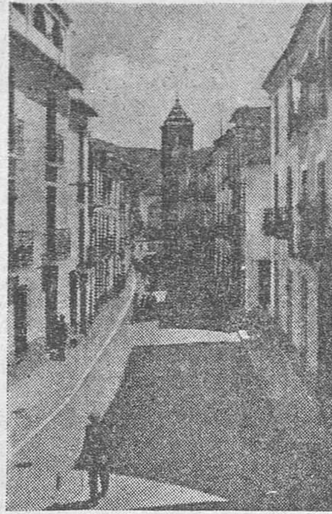
Calle Cabo Moreno. Lanjarón

nificativo de que Lanjarón estaba en marcha progresiva, refiriéndonos con esta indicación, al aspecto urbanístico de la ciudad, y señalando cómo en muchos lugares de la población se habían levantado edificios de excelente traza. Hoy podemos decir que aquella marcha progresiva continuó su ritmo sin detención alguna y que Lanjarón va cambiando de fisonomía urbana debido a las nuevas construcciones que se están llevando a cabo en distintos puntos de la localidad, especialmente en la zona donde se abrió la calle de Alejandro Damas, y en la que numerosos hotelitos y casas particulares construidos bajo un tipo de modernidad se elevan sobre uno de los lugares más pintorescos de la ciudad, y desde cuyo lugar dominante se contempla un amplio panorama de indescriptible belleza. De todos los encantos naturales que Lanjarón tiene y de las mejores urbanísticas que se han realizado, así como de los exuberantes jardines que pertenecieron a la casa señorial de distinguida familia granadina y que han pasado a otra propiedad, disfrutan ya agüistas y veraneantes que en número considerable afluyen a Lanjarón para gozar de su clima delicioso.