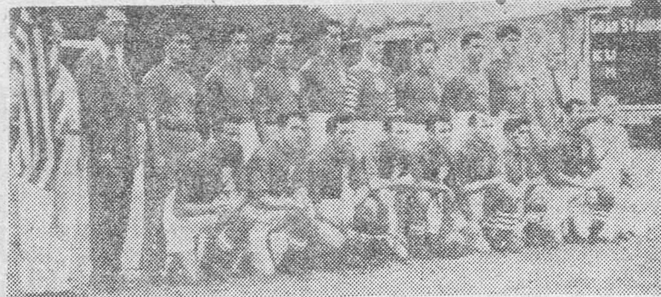
Seleccionados norteamericanos de los que ayer salió el equipo representativo de su país; en contra de todos los pronósticos fué un enemigo difícil frente a la selección española.

Es a los cuarenta minutos del segundo tiempo, faltando cinco para terminar, cuando el extremo Gaínza efectúa una de sus jugadas personalísimas y centra sobre Basora, quien, rápido, dispara por bajo y marca el segundo tanto para España, acogido con otra formidable ovación. Cuando falta un minuto para terminar, el interior Igoa, que ha recibido un pase adelantado de Puchades, cede a Zarra, quien, de manera imparable, dispara sobre puerta y consigue el tercer tanto para España. Cuando resuena la ovación al delantero centro español, el