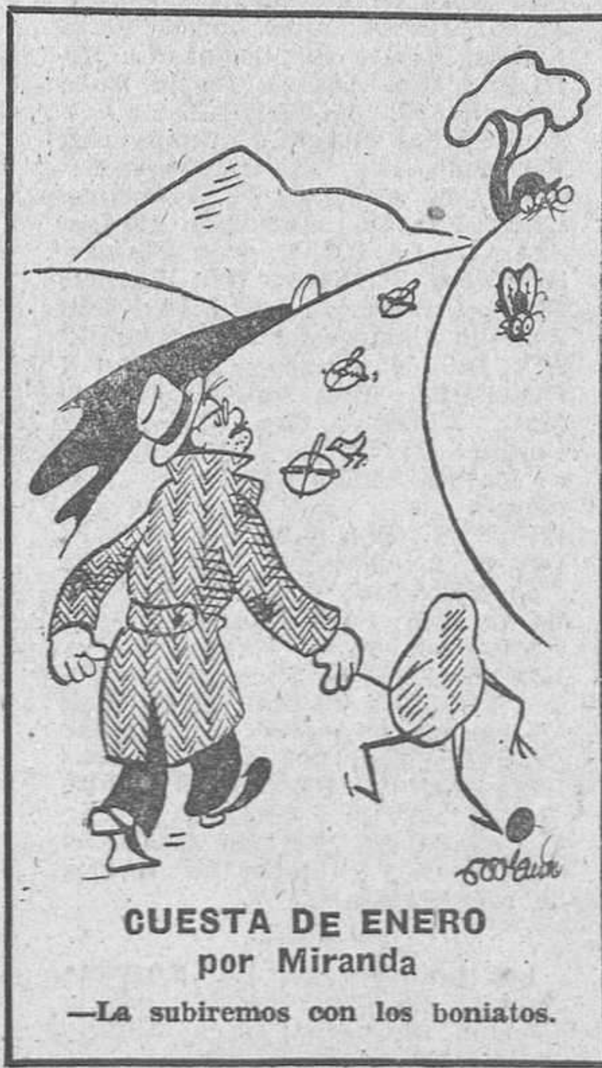
CUESTA DE ENERO por Miranda