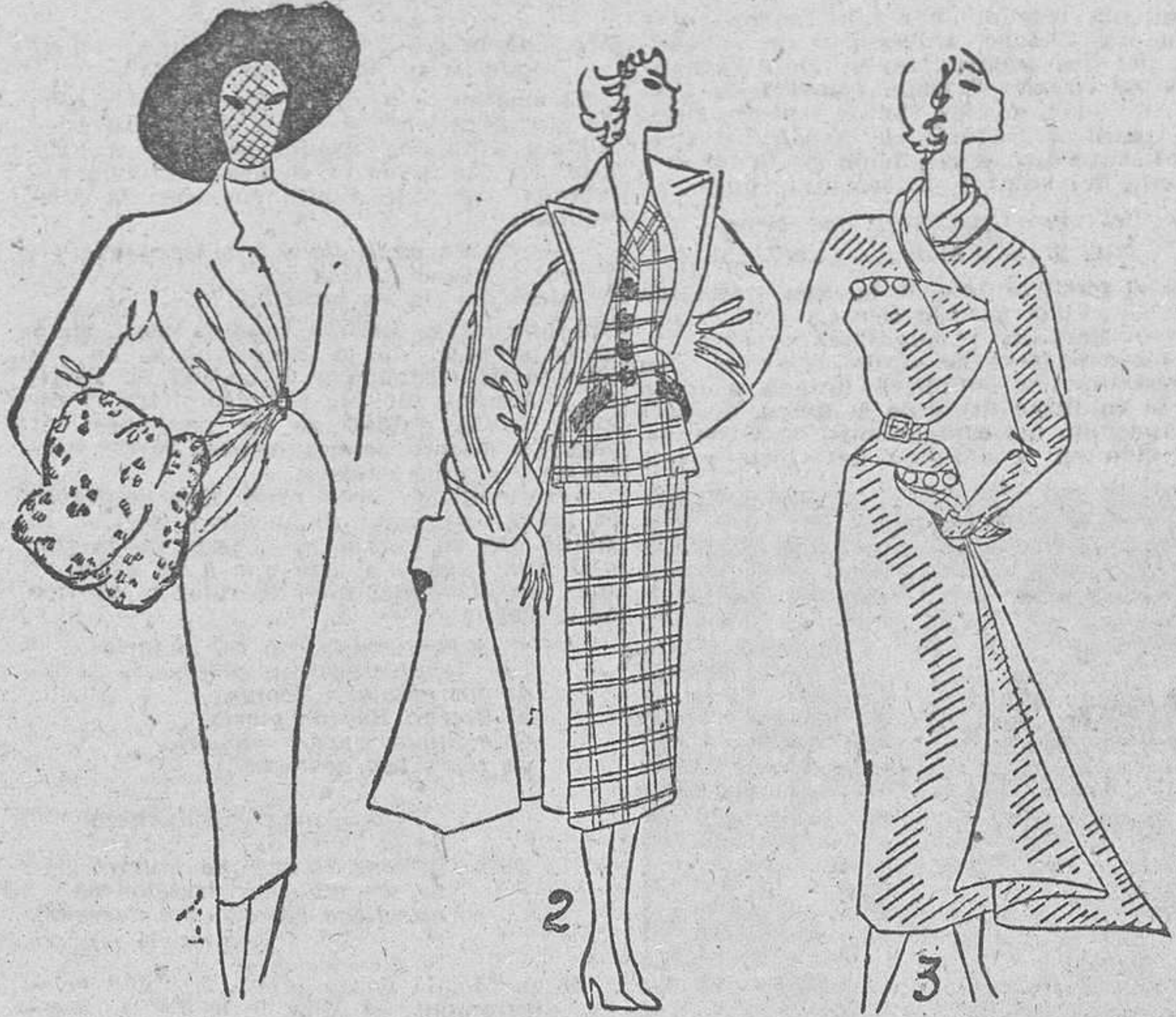
1.—Modelo llamado «torpedo», en lana «beige», con grandes manchas de leopardo como adorno. 2.—Un modelo sastre, con dibujo Príncipe de Gales en verde y «beige». 3.—Vestido de lana en verde y burdeos, con echarpe.

La moda se inclina por los vestidos prácticos