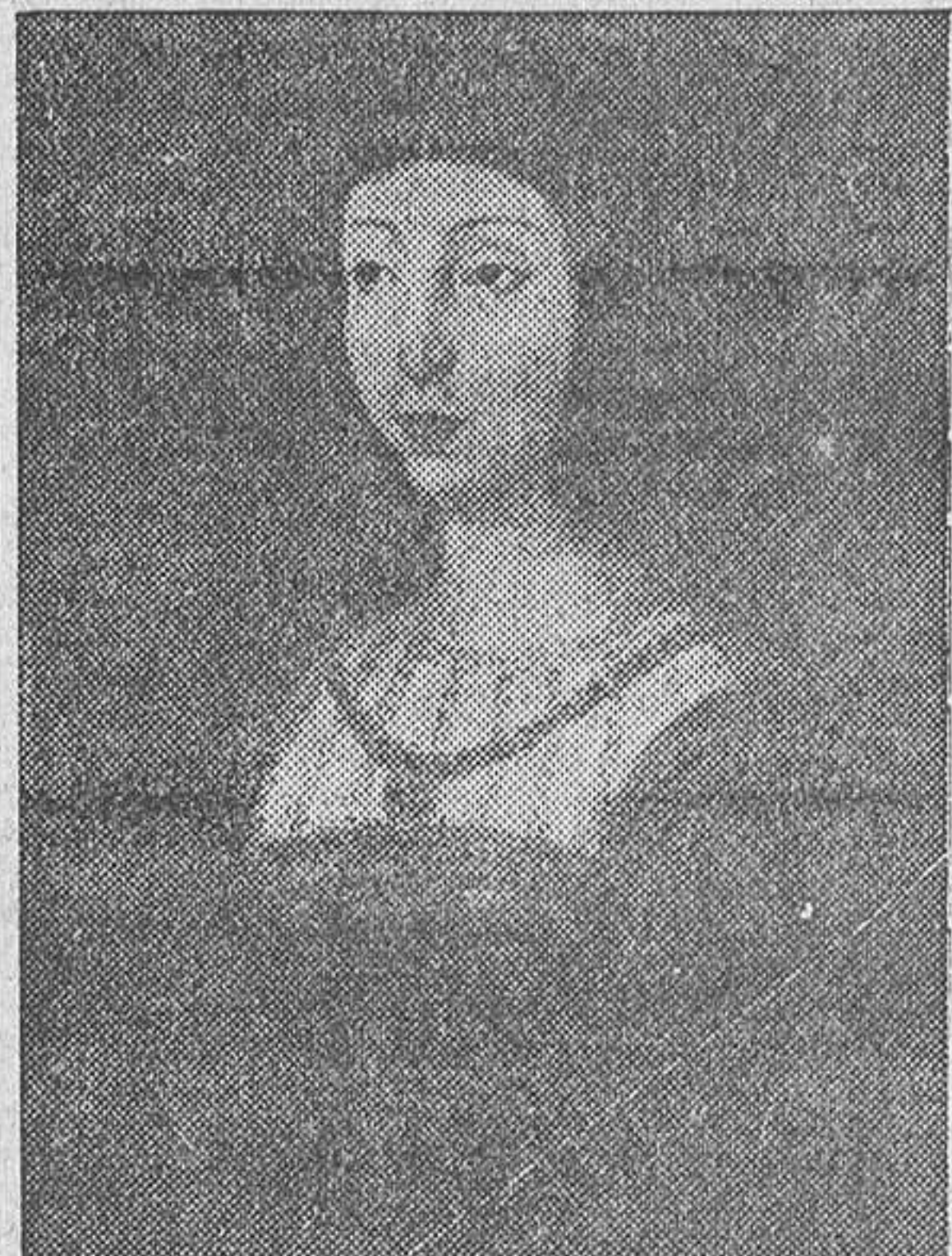
ISABEL LA CATOLICA

—“Campanero, campanero de la Torre de la Vela déjame tocar que miero de un malestar traicionero que hace un año me desvela”. RODOLFO GIL