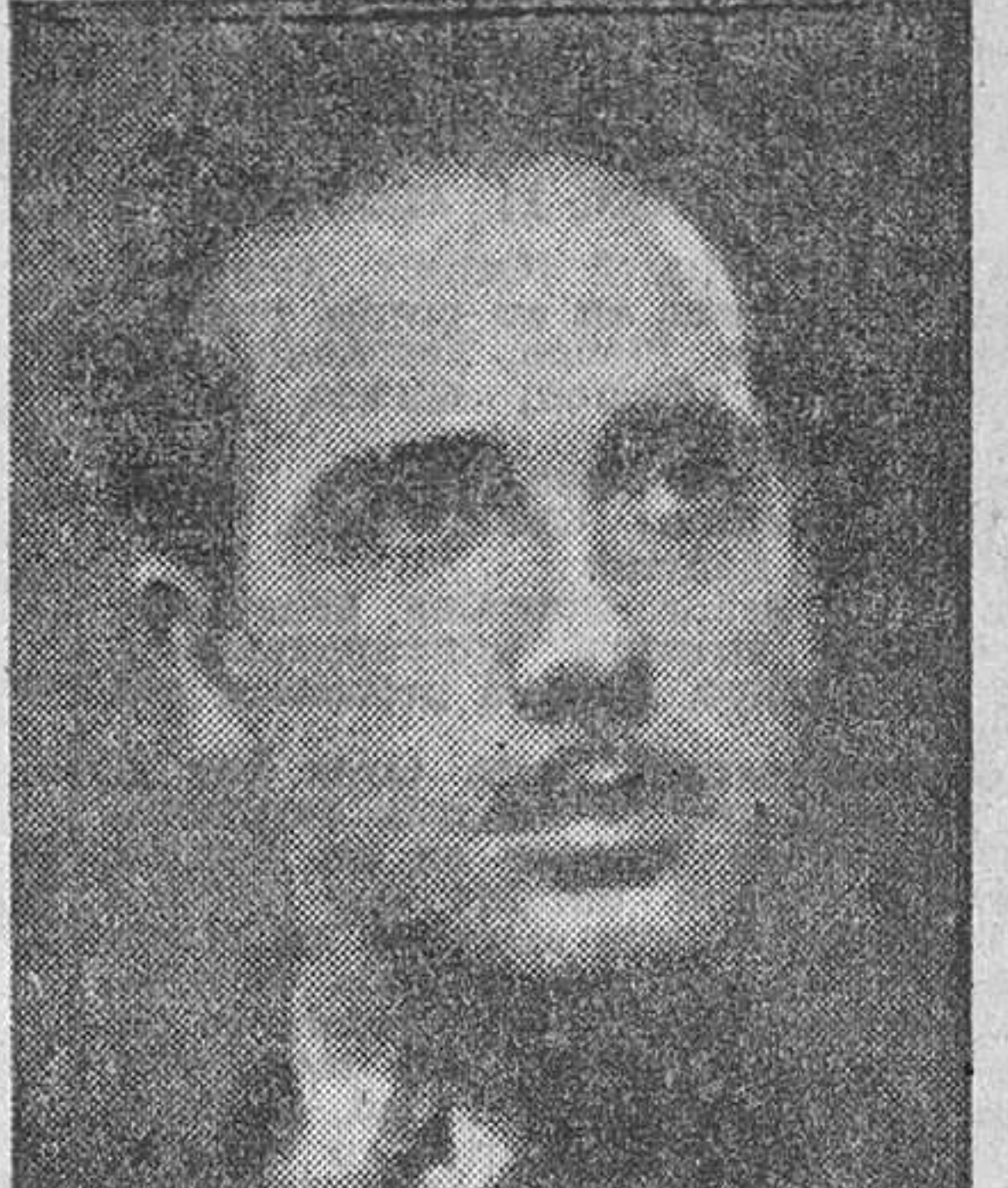
JOSE TAMAYO, que tantos triunfos y galardones lleva ya cosechados en España y América.

Al regresar a España, y después de su brillante actuación en Madrid, no podía Tamayo olvidar a Granada —como Granada no lo olvida a él—, y se ha apresurado a presentarse de nuevo ante nuestro público, en estas próximas fiestas del Corpus, continuando aquí la magnífica labor escénica, que comenzó en pasadas temporadas, con sus brillantes actuaciones.