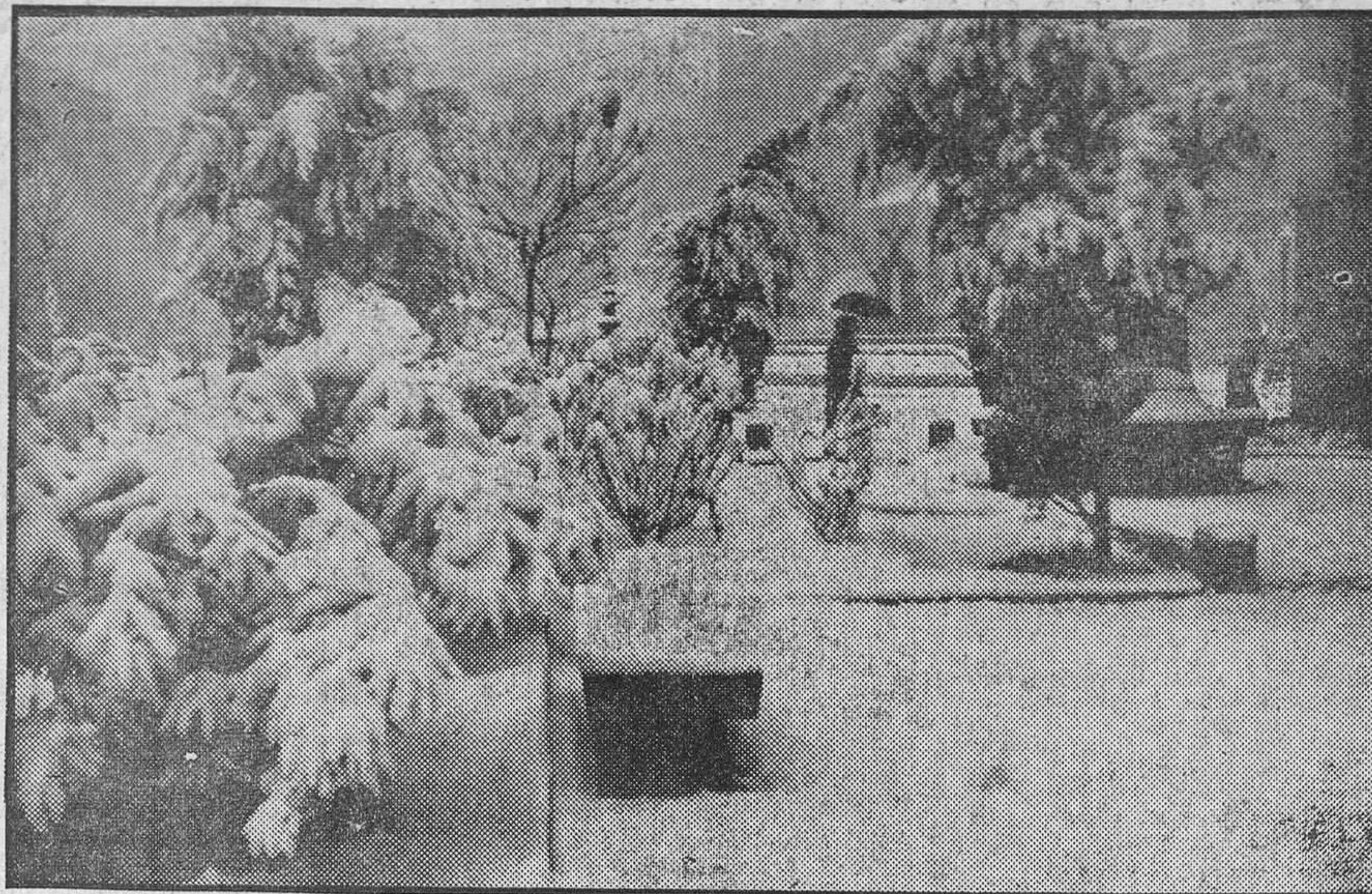
Granada ha quedado cubierta de una espesísima capa de nieve, como puede advertirse por esta perspectiva obtenida en la tarde del sábado por la cámara de Torres Molina, en los jardillos situados a la entrada de la Acera de Darro.

Las comunicaciones telegráficas son muy difíciles con Madrid —sólo a través de Valencia— y se van restableciendo con dificultad con nuestra provincia y otras capitales andaluzas.