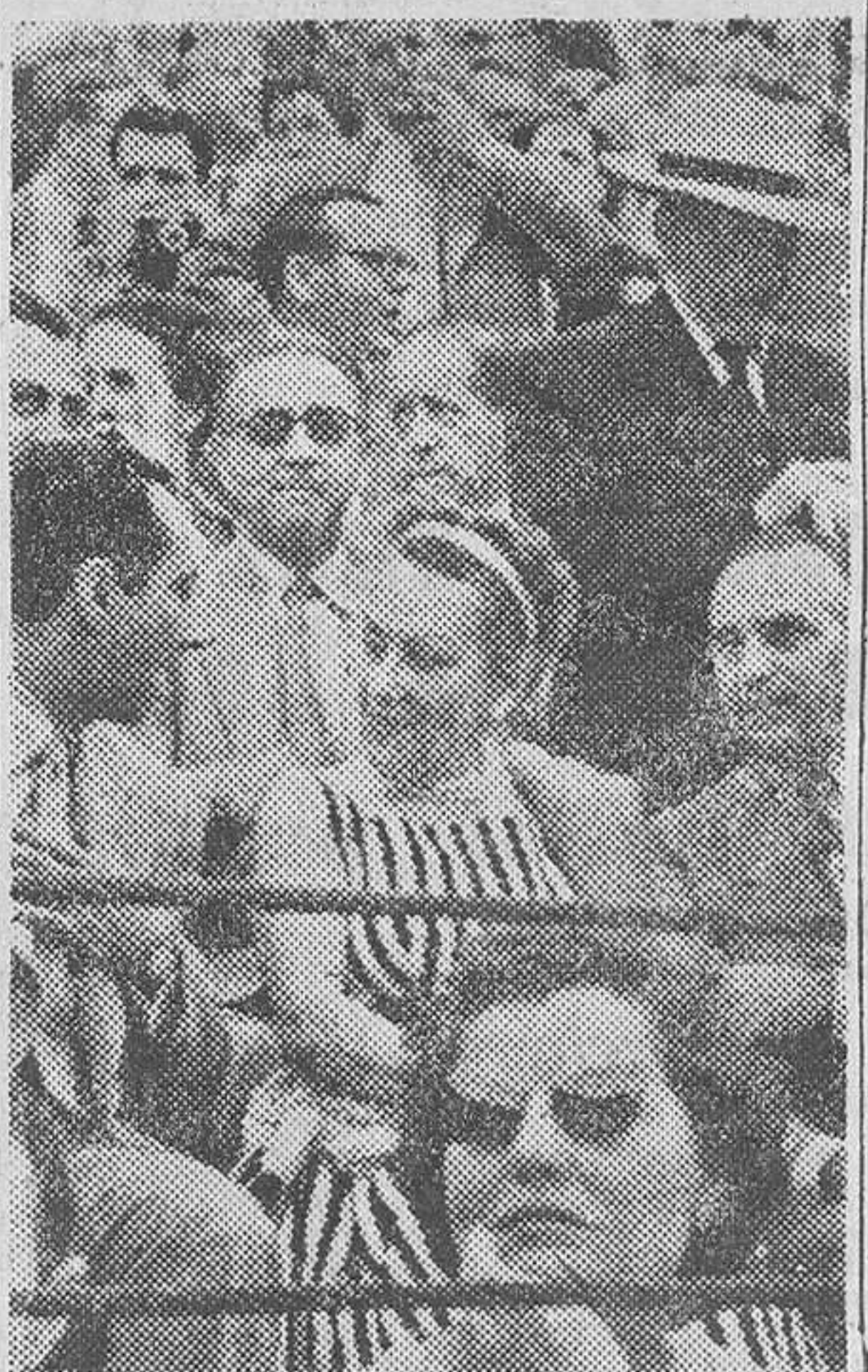
Gloria Swanson, la famosa estrella del cine, presenciando la corrida de novillos en la Plaza de Madrid.

Leemos en un periódico madrileño que durante la recepción que el Castellana Hilton ofreció a los periodistas para conmemorar el primer aniversario de su inauguración, Gloria Swanson tardó más de una hora en apurar su vaso de vodka, bebida que eligió para olvidarse de la «tragedia» del pasado domingo.