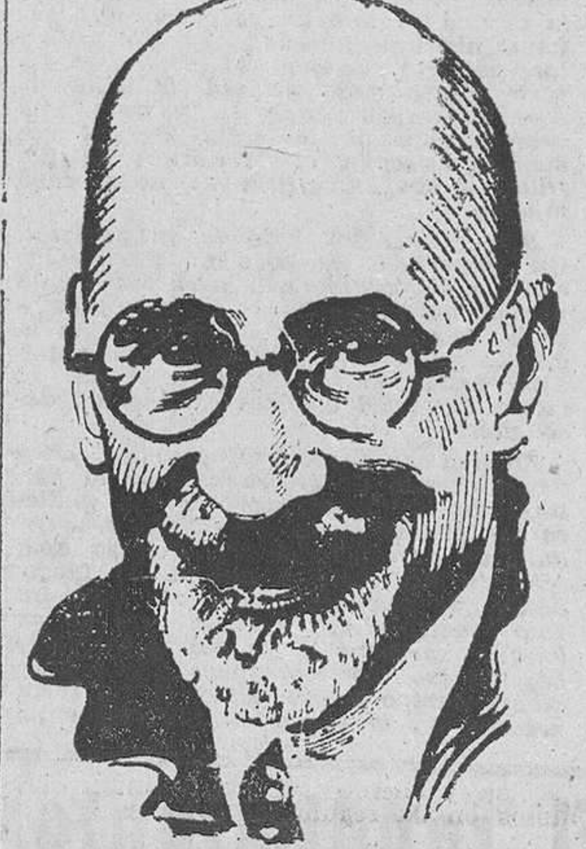
DON JACINTO BENAVENTE