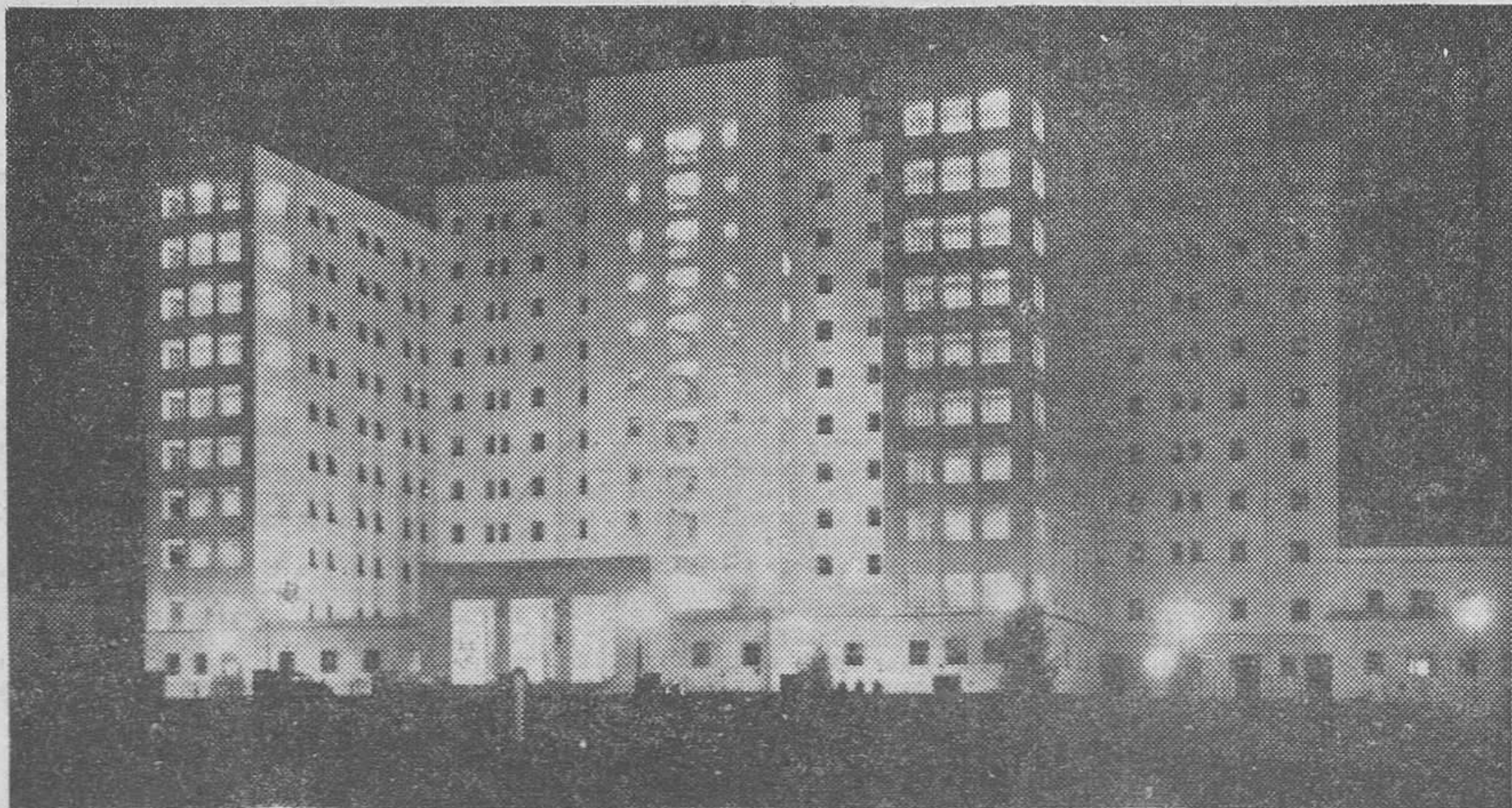
Maravillosa perspectiva de la Residencia del Seguro de Enfermedad, de Granada, que desde ahora se llamará de «Ruiz de Alda».