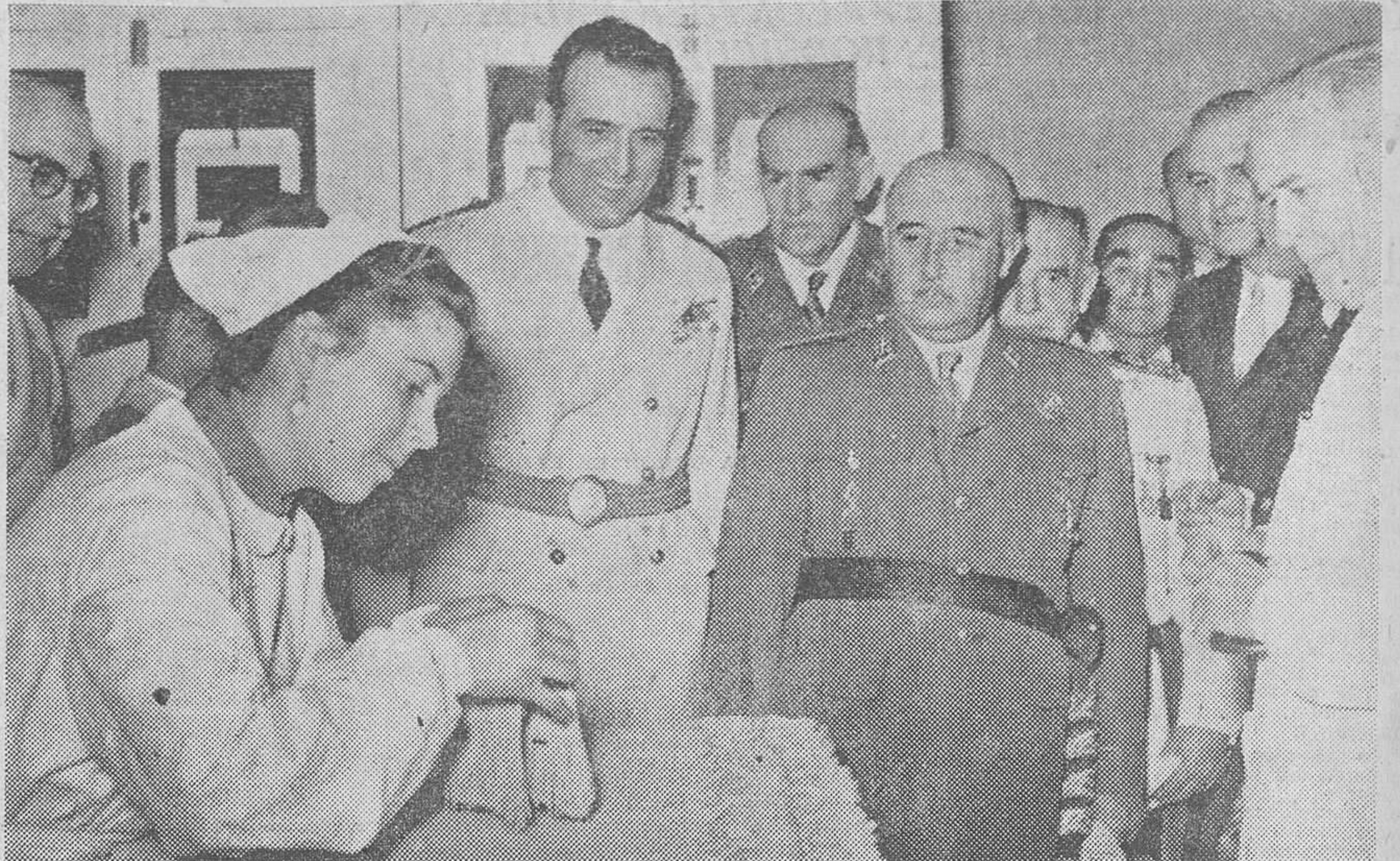
El Caudillo impulsa y visita personalmente cuantos organismos contribuyen al engrandecimiento técnico del país. La fotografía recoge un momento de su visita al Instituto Agronómico.

Cuarenta y tres millones de hectáreas se dedican al cultivo en España