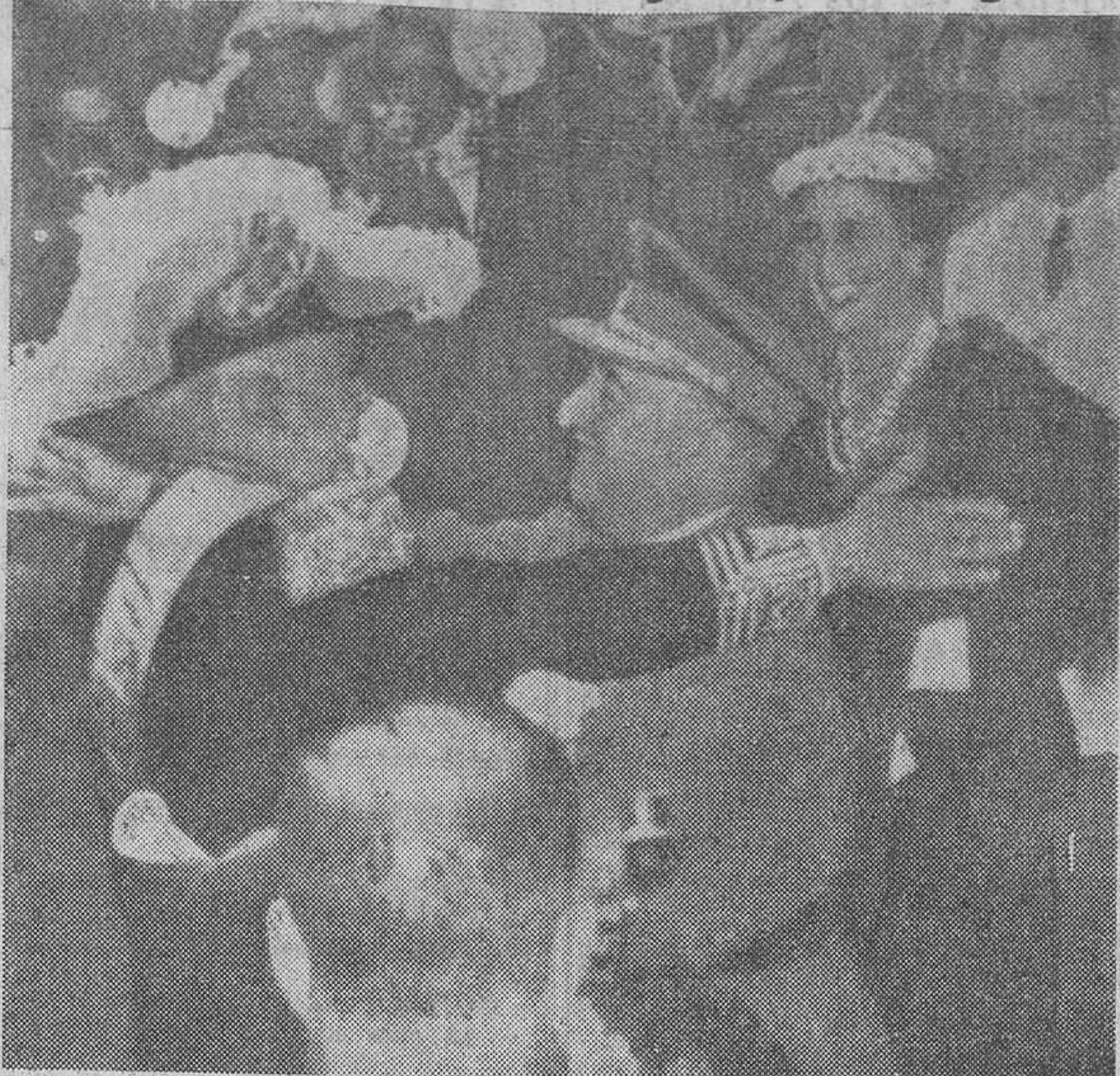
La visita a España del Generalísimo Trujillo, ha puesto de relieve los grandes lazos que nos unen a la República de Santo Domingo y el cariño sincero y la amistad existente entre ambos países. La «foto» recoge el momento en que Franco y Trujillo se abrazan en la estación madrileña, a la llegada del ilustre huésped.