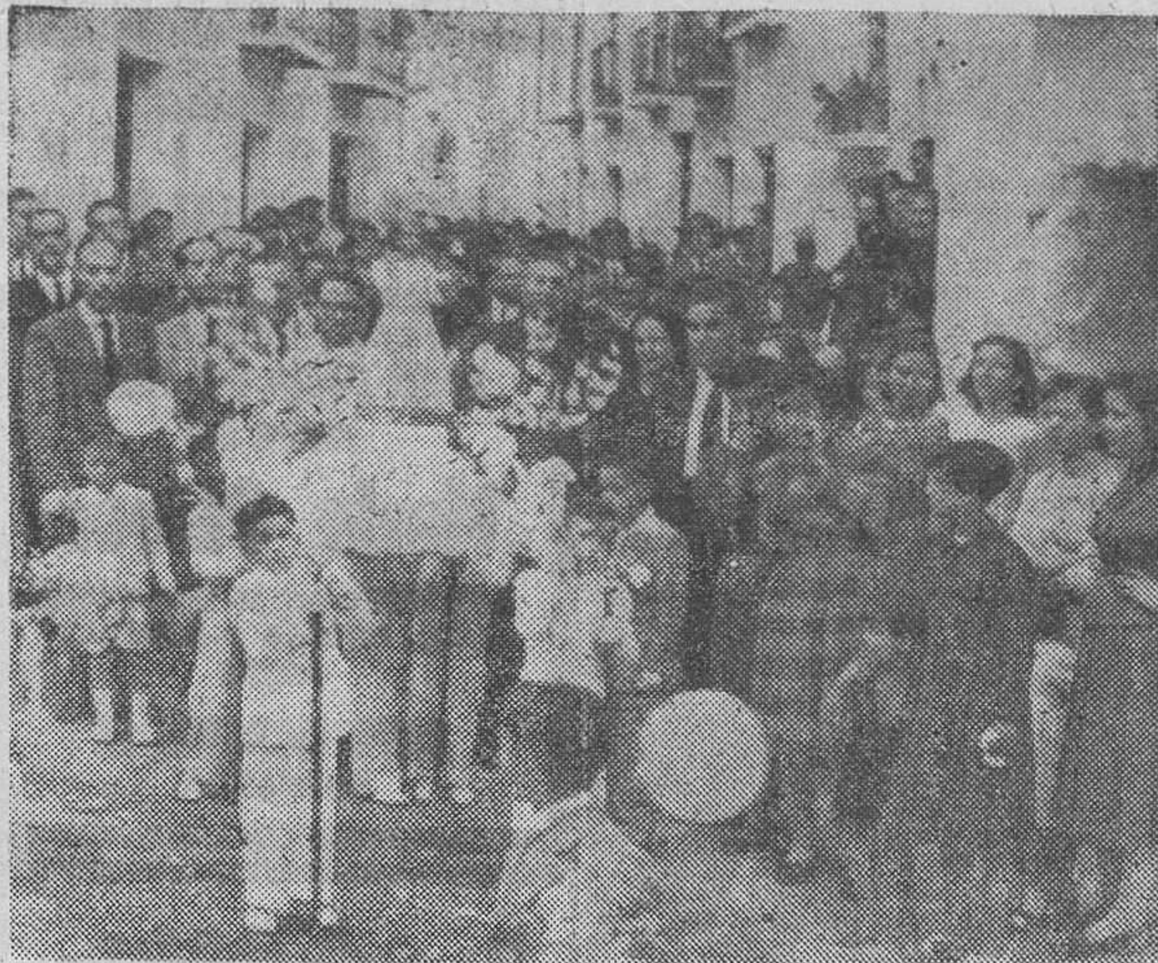
Un momento de la procesión infantil con el Niño Jesús de Añorbe.