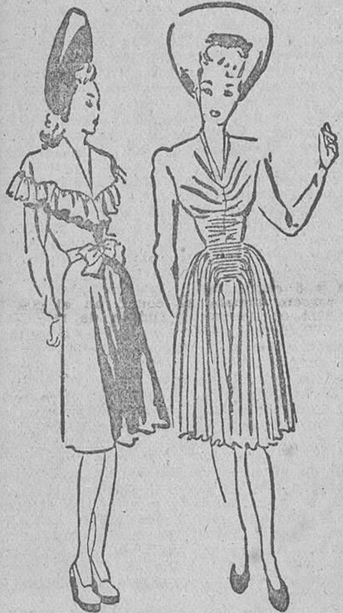
Vestido de crepón con un gran cuello en forma de chal, y otro de punto negro, drapado por el cuello y las caderas

Las durezas y rugosidades son también antiestéticas, y usted debe preocuparse por combatir las. El talón, las rodillas y los tobillos, son los sitios de preferencia. Hágase en dichos sitios una abundante espuma de jabón, y luego pásese suavemente la piedra pómez menos rugosa que encuentre. No espere lograr resultados en una sesión, sino que insista en las sucesivas. Luego, pásese una crema de belleza suave, o bien aceite de olivas, para impedir la irritación. Verá cómo al cabo de algún tiempo, su piel luce suave y lisa en esos sitios en lugar de las antiestéticas rugosidades que existían antes.—MARICHU.