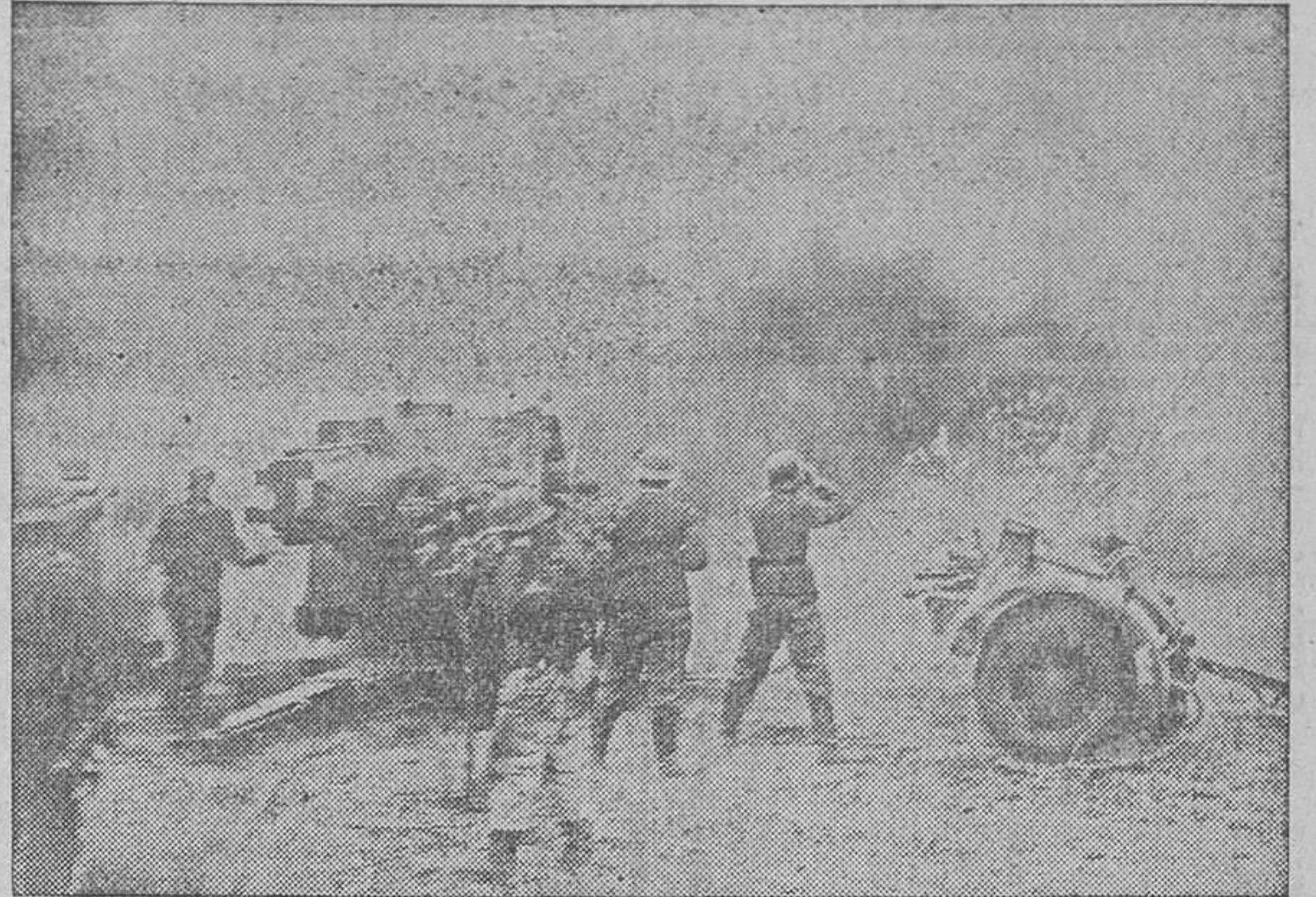
En el sistemático y ordenado repliegue que en el frente del Este realizan las tropas alemanas, desempeña un papel decisivo la artillería, que aquí vemos en plena acción contra el enemigo.