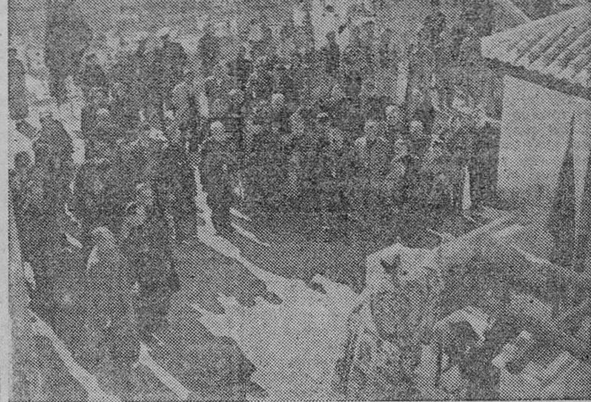
El Obispo Auxiliar de Granada y el Prelado de Guadix y Baza, consagrados en nuestro templo metropolitano.