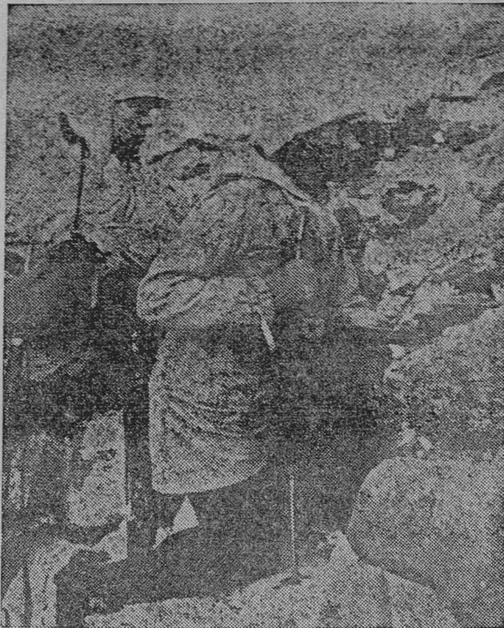
Pese a las fuertes nevadas en Rusia, los soldados alemanes se mantienen firmes frente al enemigo