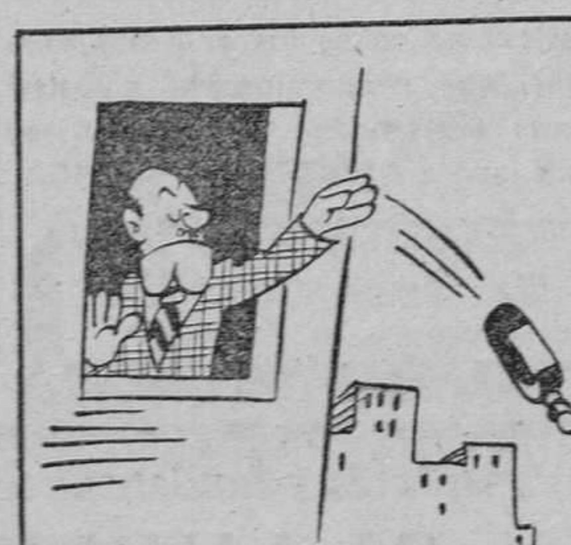
--¡No vuelvo a probar el vino!