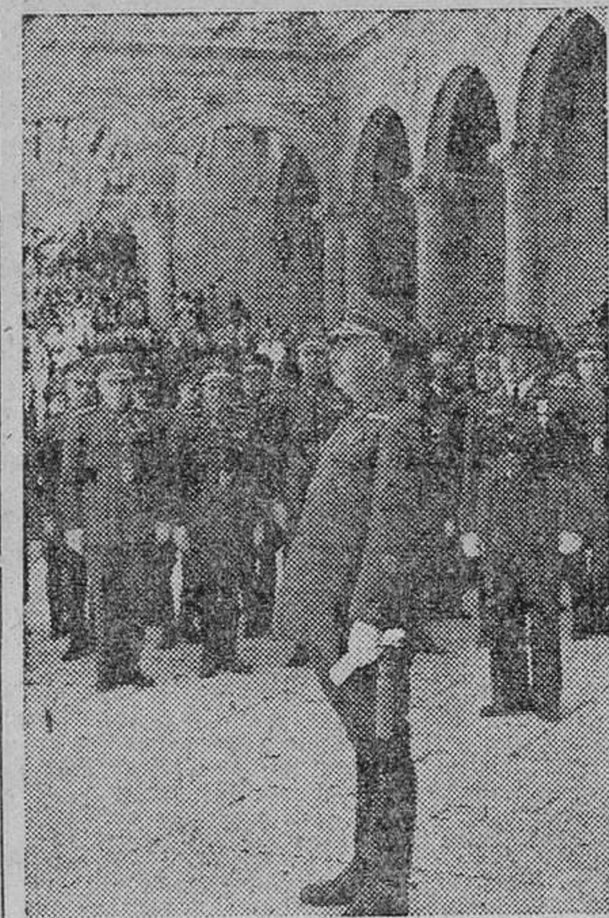
El Jefe del Estado, durante el discurso que pronunció ante la XIV promoción de Infantería, a la que pertenece, y que le rindió homenaje en las gloriosas ruinas del Alcázar.