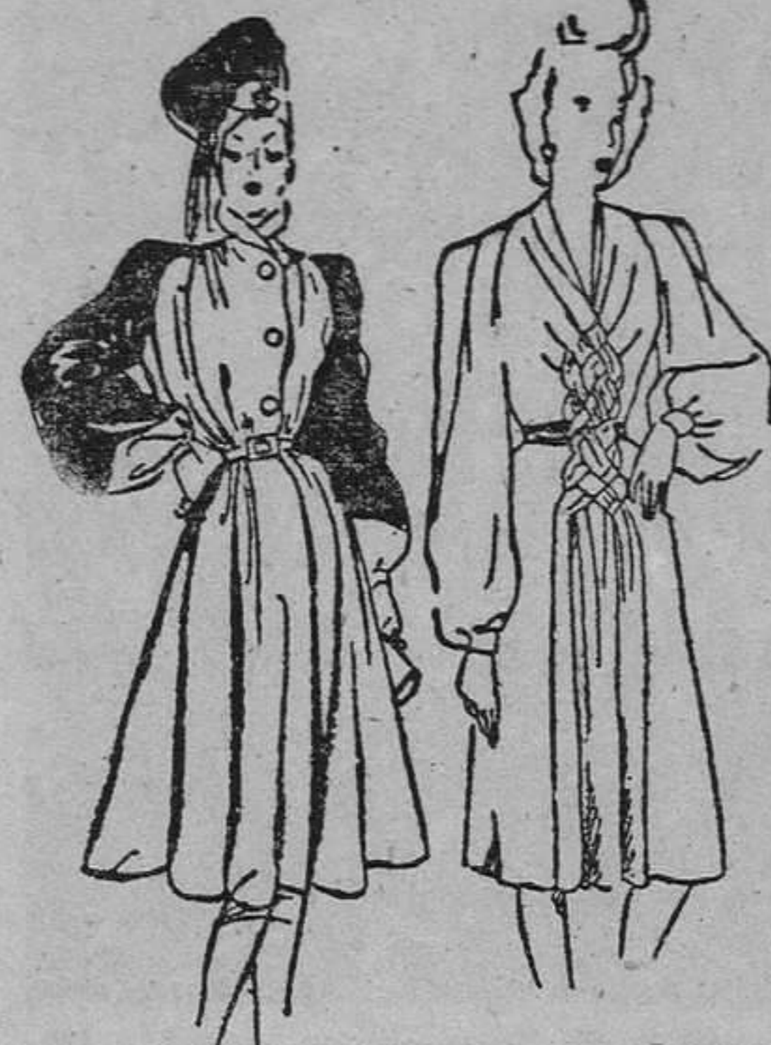
Abrigo de lana gris, con mangas y espalda de piel de nutria. El vuelo está mantenido por medio de un cinturón estrecho.