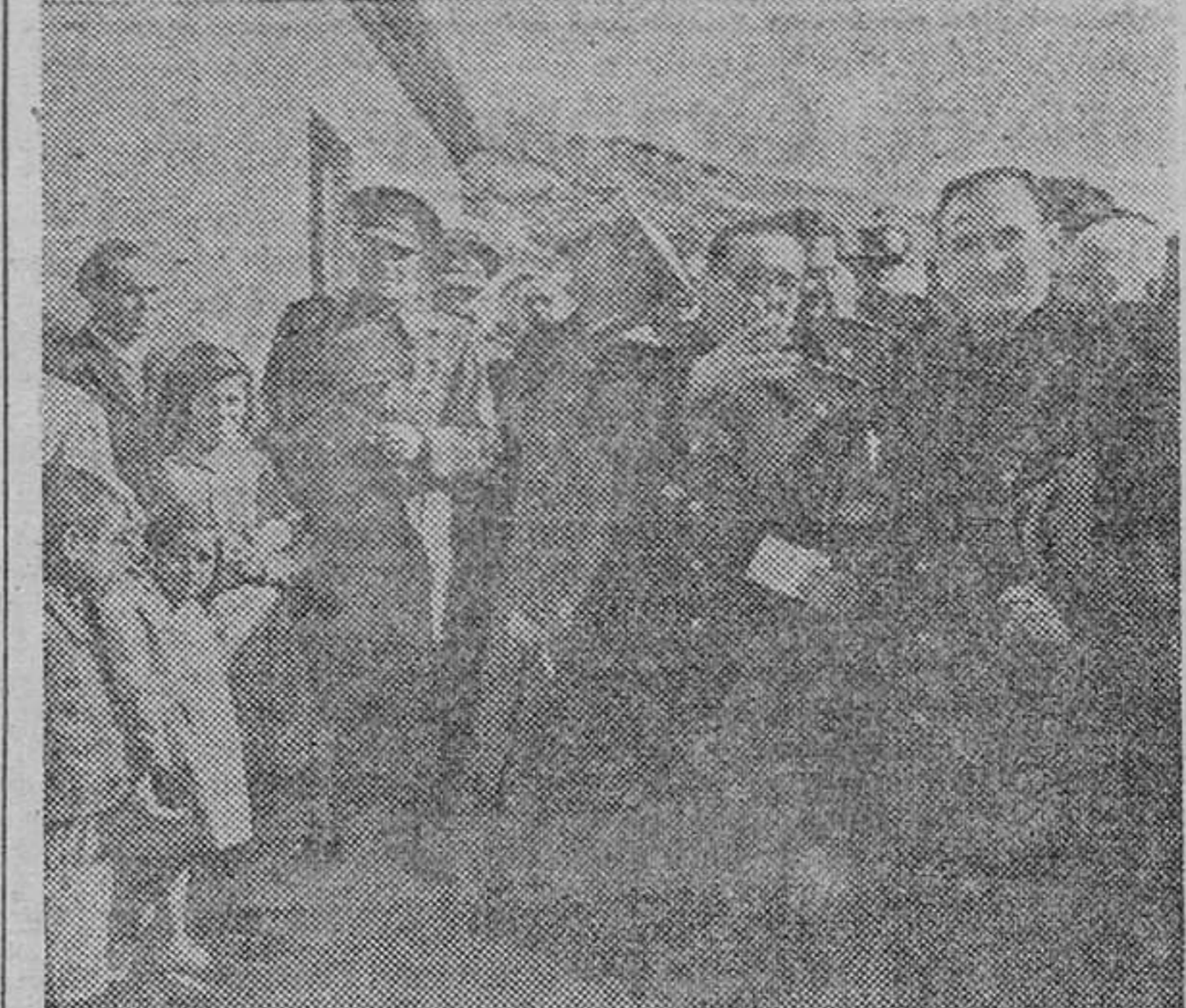
El Ministro Secretario hizo entrega de las primeras casas construidas por la Falange en el Barranco del Abogado. Nuestras «fotos» representan al camarada Arrese al llegar a aquellos lugares y la bendición de los nuevos inmuebles.