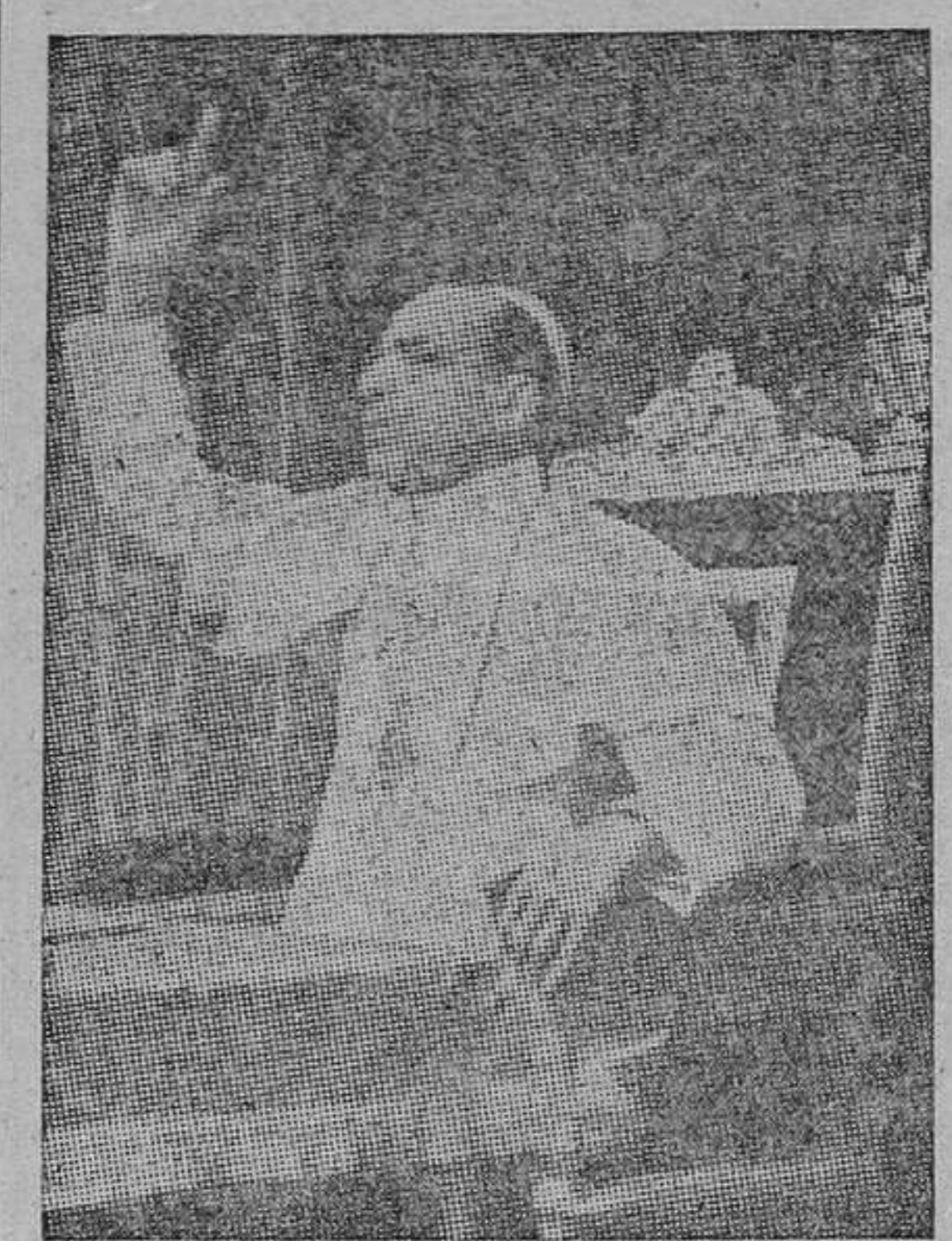
SU SANTIDAD PIO XII

número. De todo el mundo llegan miles de cartas a la Ciudad del Vaticano pidiendo información sobre los desaparecidos, con una sencillez y emocionante dirección: «a Su Santidad Pío XII, Vaticano». Casi un centenar de personas trabajan en esta san-