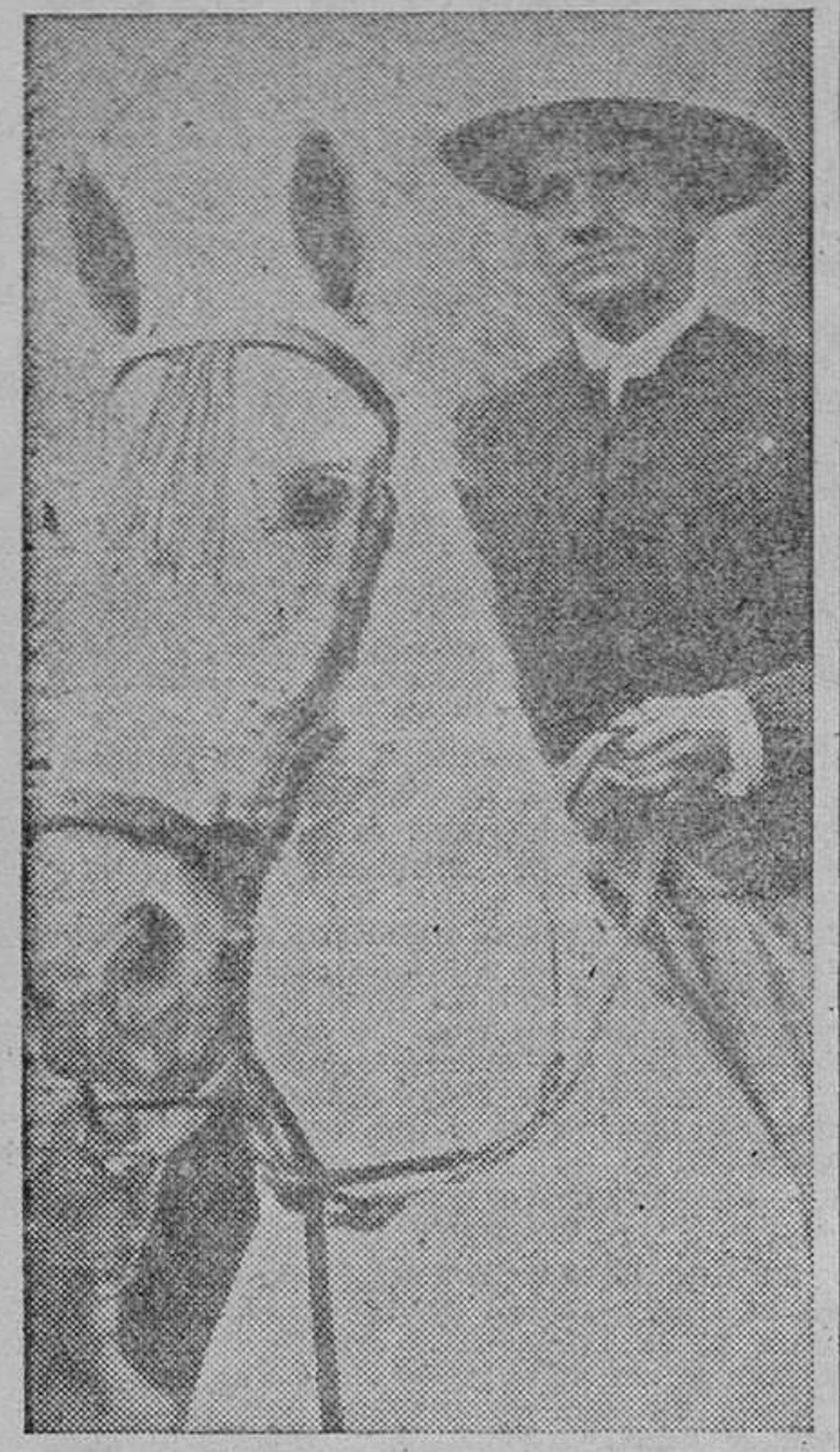
Juan Belmonte, el «as», indiscutible de la tauromaquia.

En verdad que llegamos al final de la temporada taurina de 1943, con la deseperanza que motiva el escaso número de festejos celebrados, dada la importancia que debe tener una plaza como la de Granada. Y una vez más, tenemos que lamentar que sean sólo dos el número de corridas en las tradicionales fiestas del Corpus, y que este número no se aumente por lo menos a cuatro, como hacen otras ciudades de menor importancia que la nuestra. Comenzó la temporada con el gran festival que dió la Asociación de la Prensa