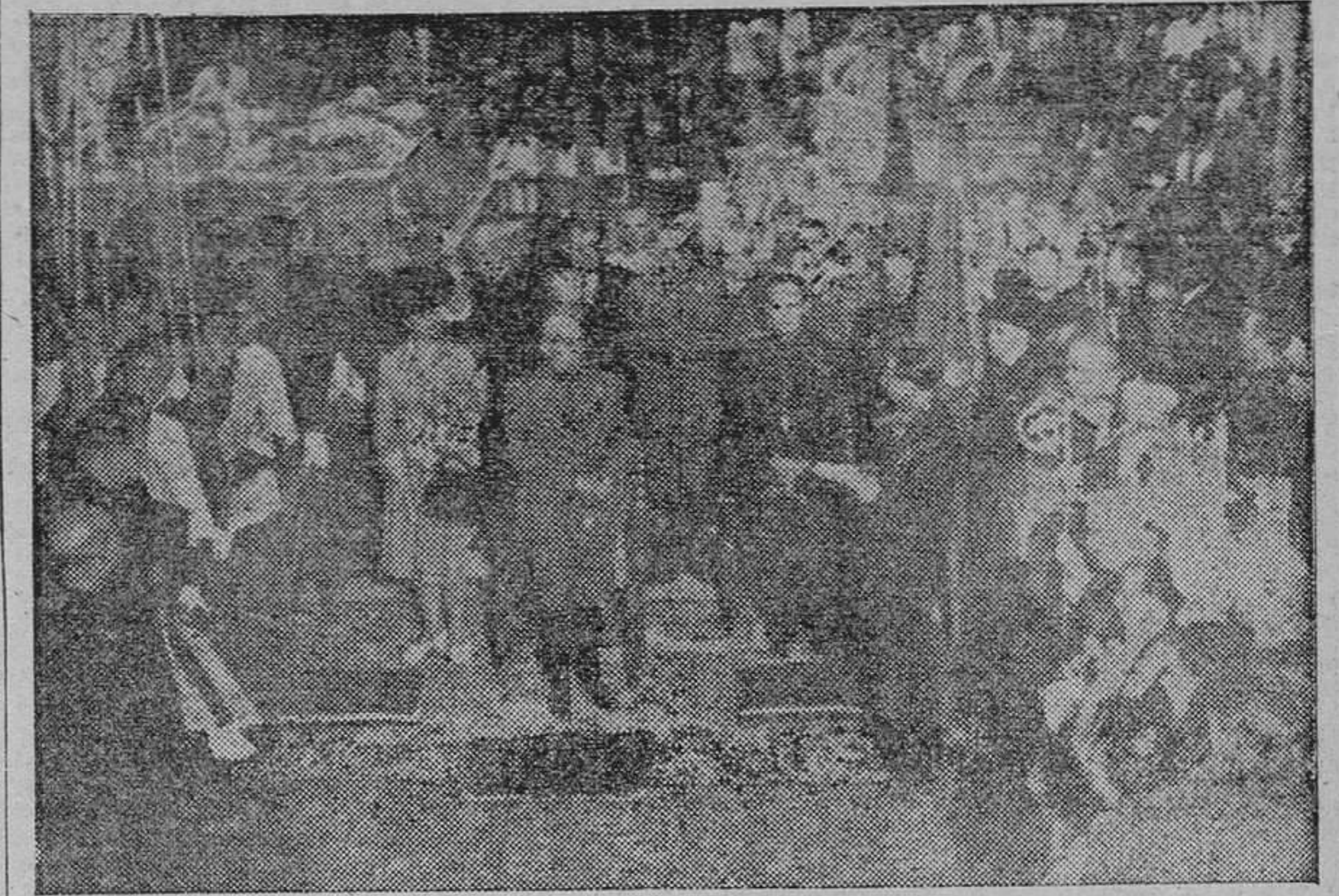
En el grandioso marco de la Capilla Real, frente a los sepulcros de los fundadores de la Unidad española, el Caudillo recibió de manos del alcalde, señor Gallego y Burin, la espada que Granada le ofreció y que es exacta reproducción de la de Fernando el Católico. (T. Molina)

Del 5 de abril es el decreto que implanta la cartilla individual de racionamiento, por medio de la cual se consigue una más