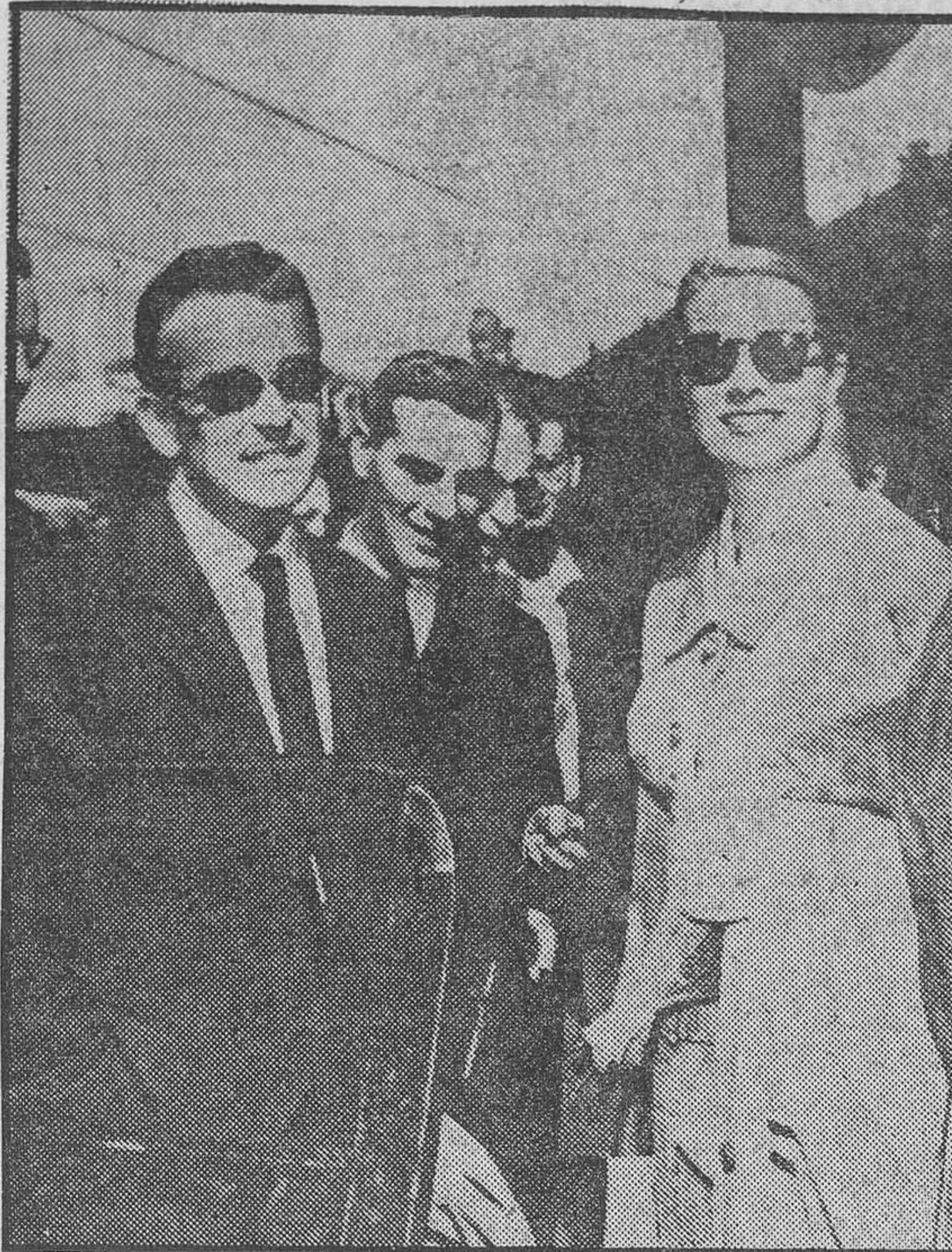
Los príncipes de Mónaco han llegado a París, a bordo del tren azul. Grace y Rainier, que se proponen pasar una corta temporada en la capital francesa, son recibidos en la estación por sus amistades.