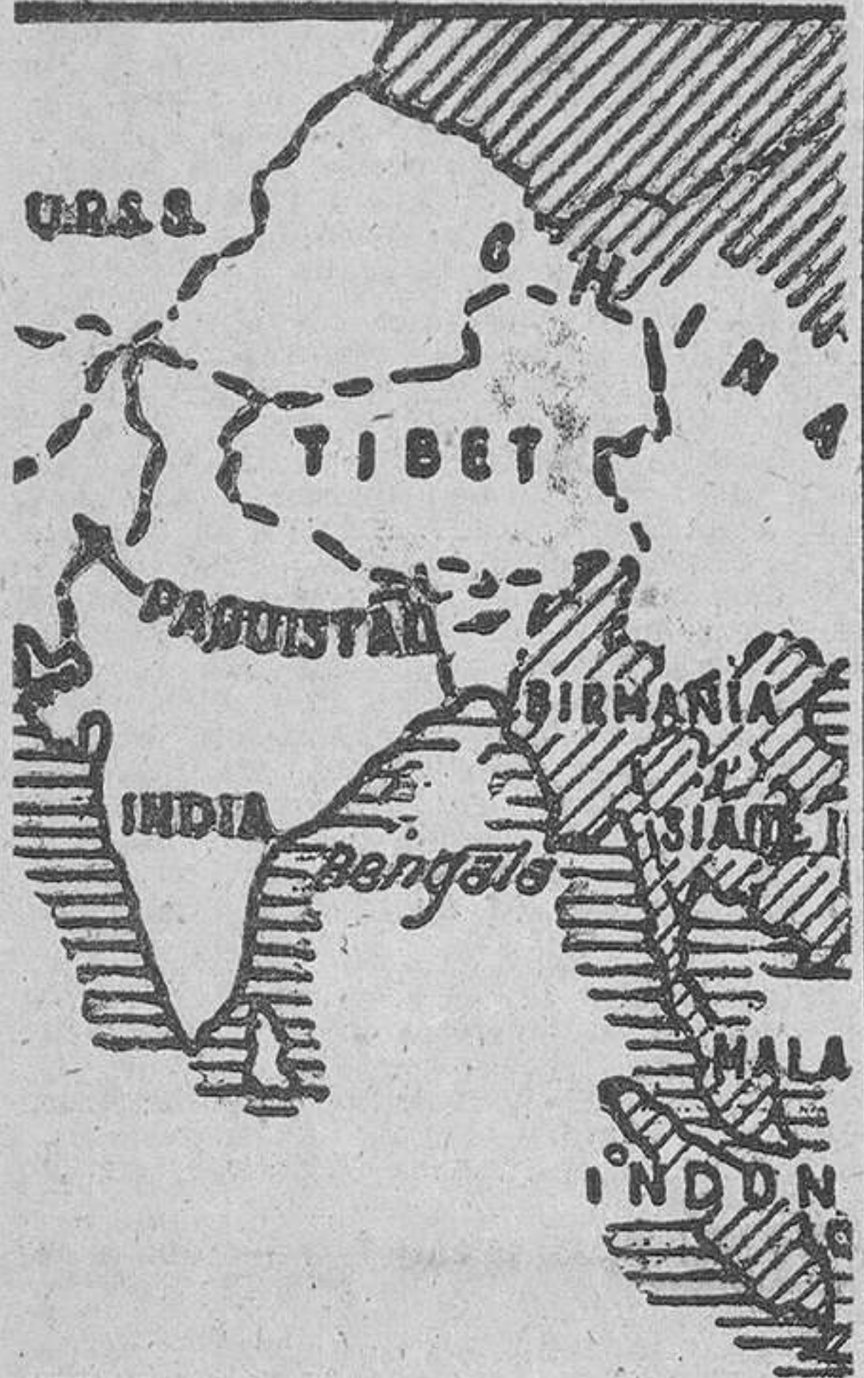
Gráfico del Tibet, el «techo del mundo», al que rodean varios países asiáticos

do los libros sagrados para empuñar las armas, que jamás rehusaron dar al Ejército tibetano, cuando avanzaban por el país los soldados de la China roja.