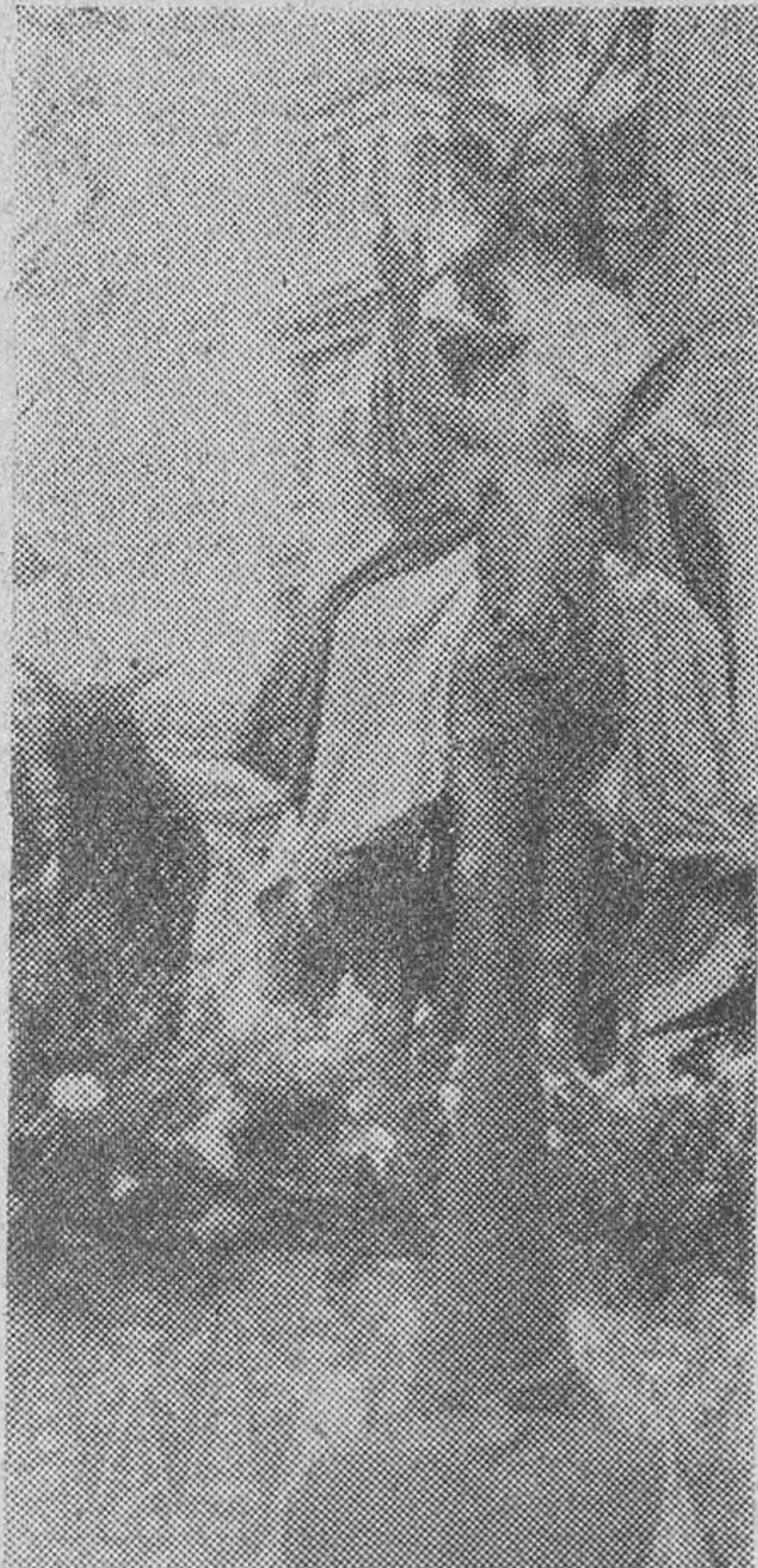
Entrada de Jesús en Jerusalén, «paso» al que acompañan centenares de niños