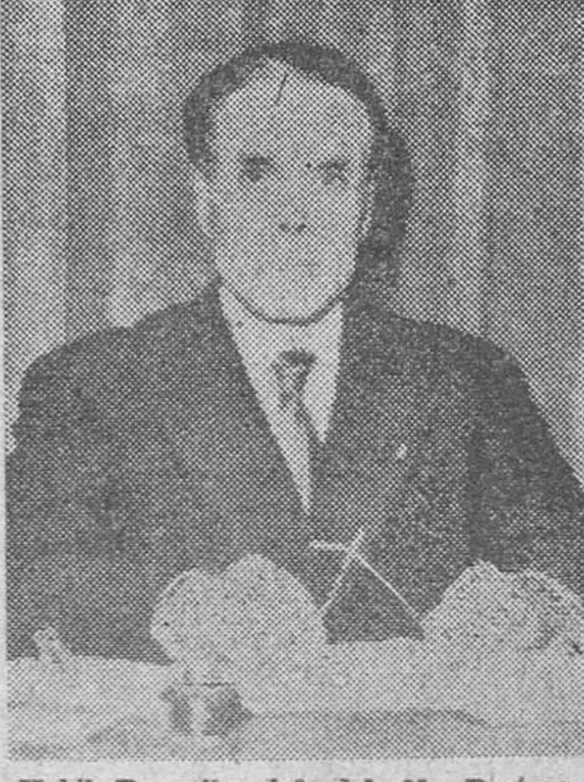
Habib-Bourguiba, jefe del «Neo-Destour»

No hubo incidentes y la participación de votantes fué muy elevada