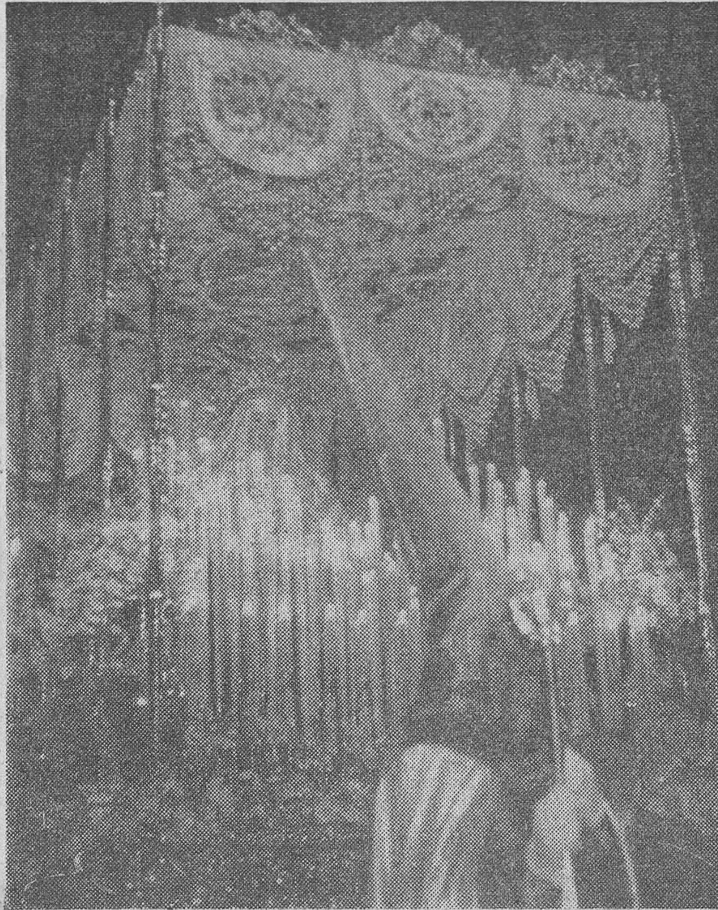
Magnífico «paso» de Nuestra Señora de la Victoria.