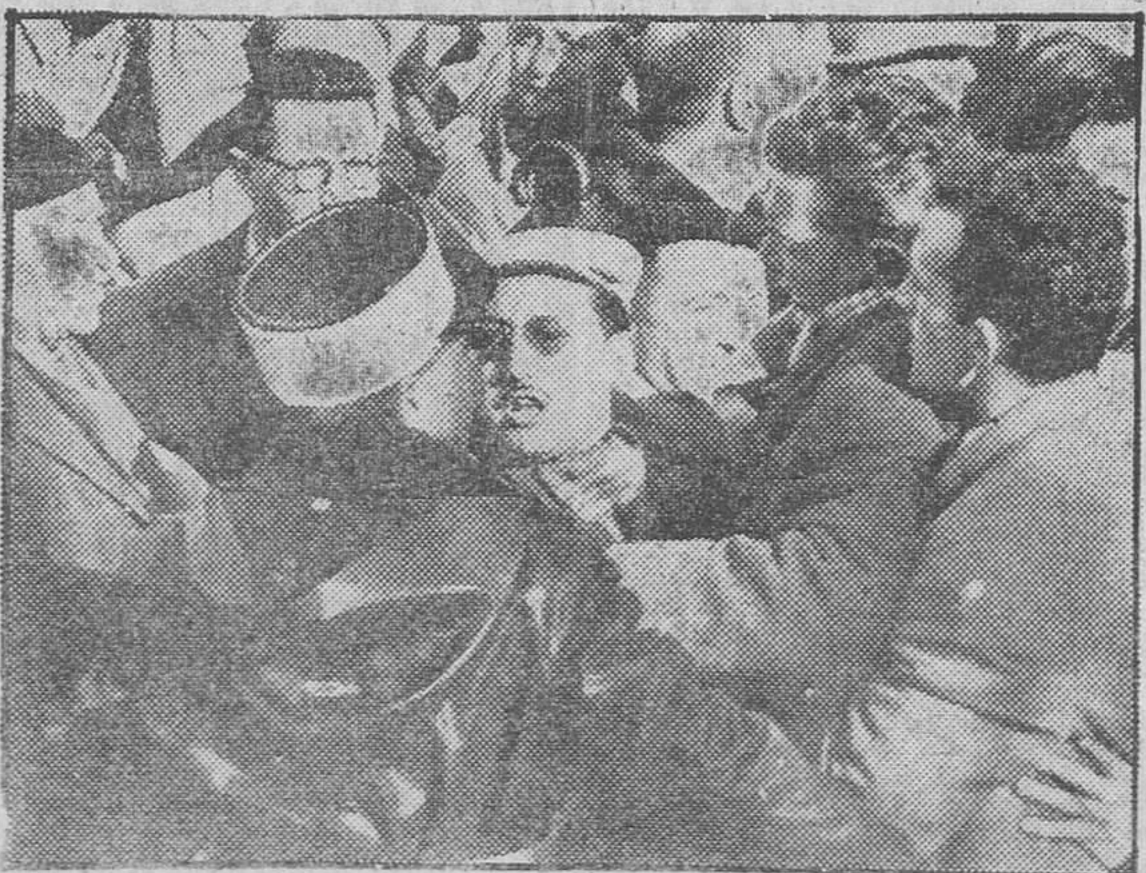
Los manifestantes argelinos son a duras penas contenidos por el servicio de orden público, mientras que el jefe del Gobierno francés, Guy Mollet, depositaba una corona de flores ante el monumento al Soldado Desconocido, en Argel.