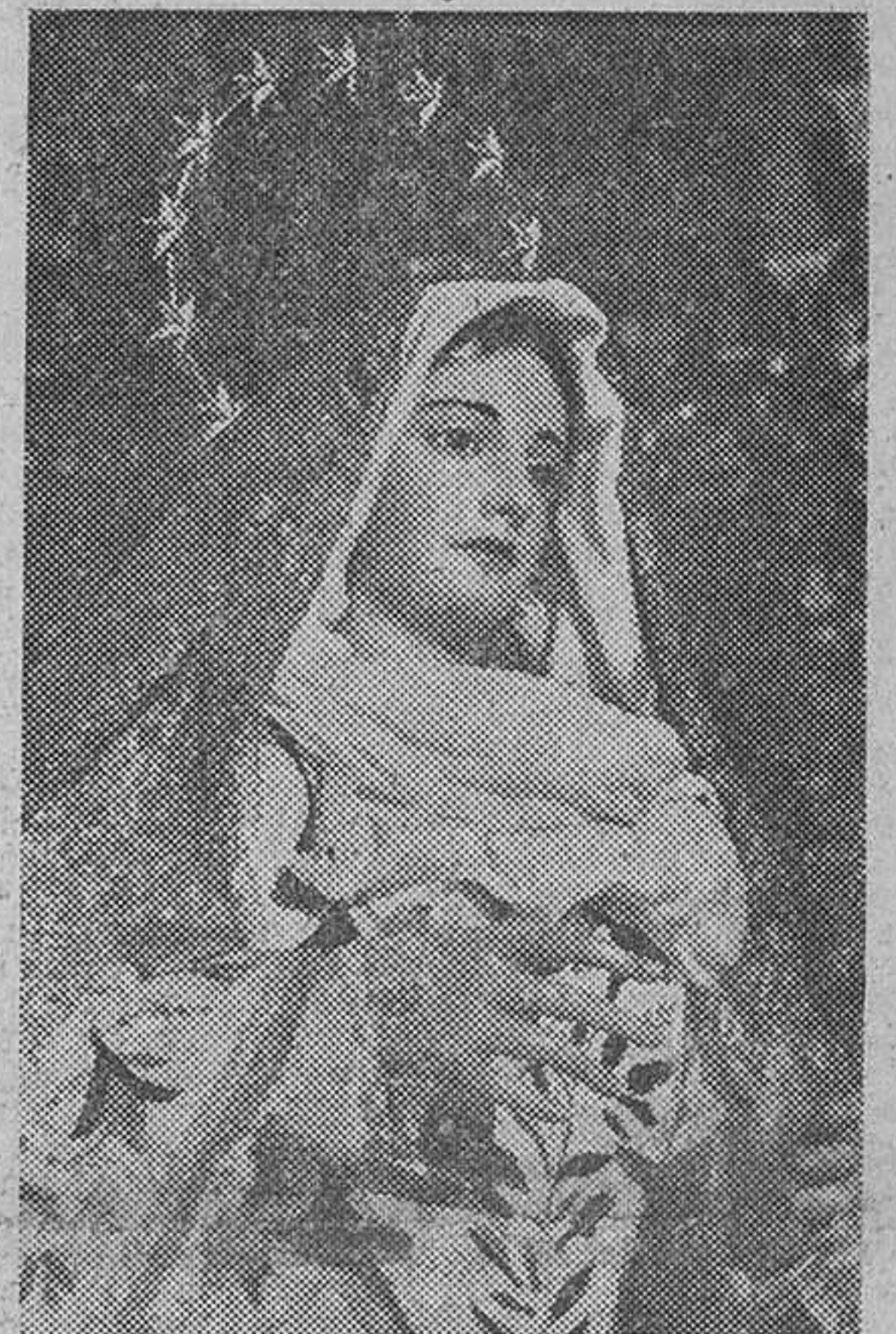
Imagen bellísima de Nuestra Señora de la Victoria, que ayer desfiló por primera vez por Granada con la Cofradía de la Santa Cena

Desde mucho antes de las ocho de la noche, hora señalada para la sa-