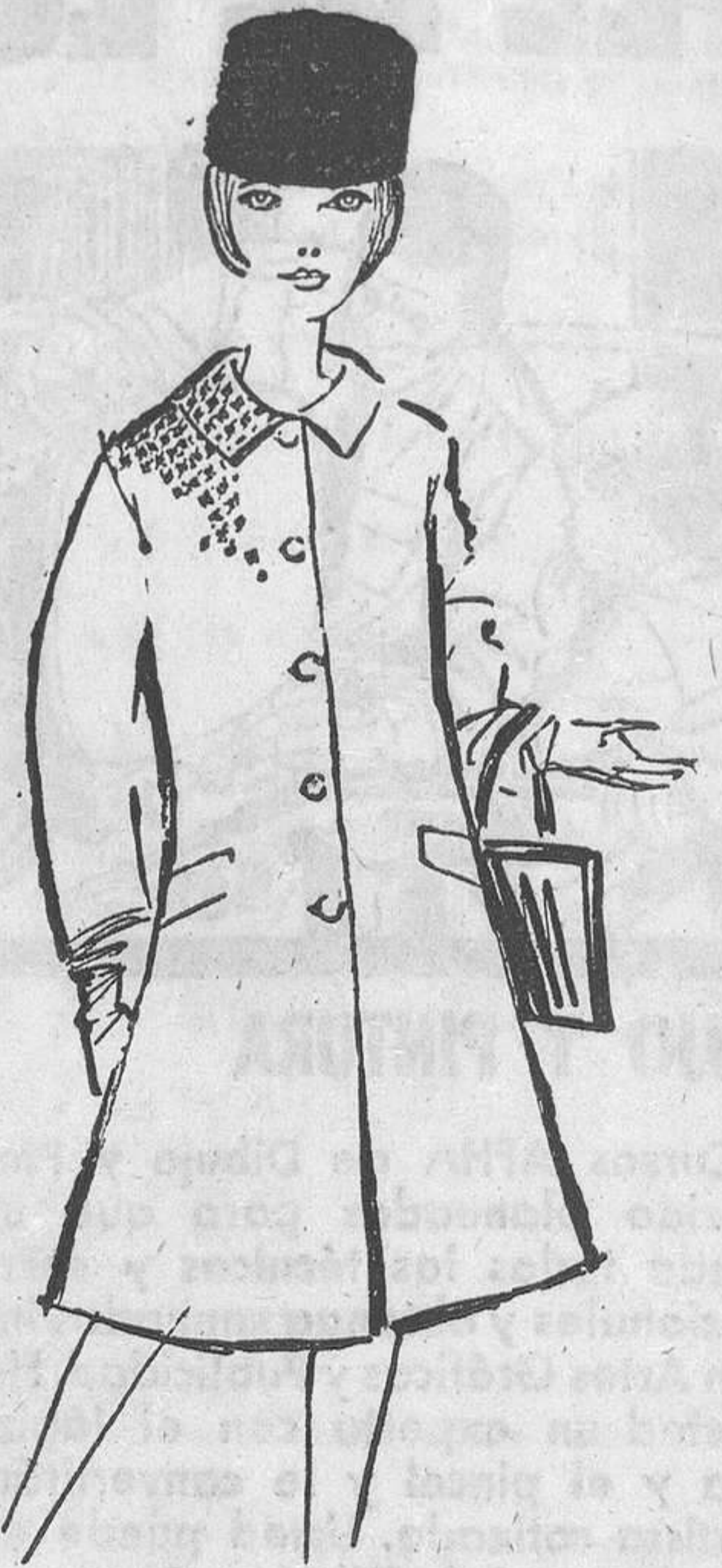
ABRIGO "PIED-DE-POULE" CUELLO PEGADO BOTONES FANTASIA UNA FILA MUY GENTIL