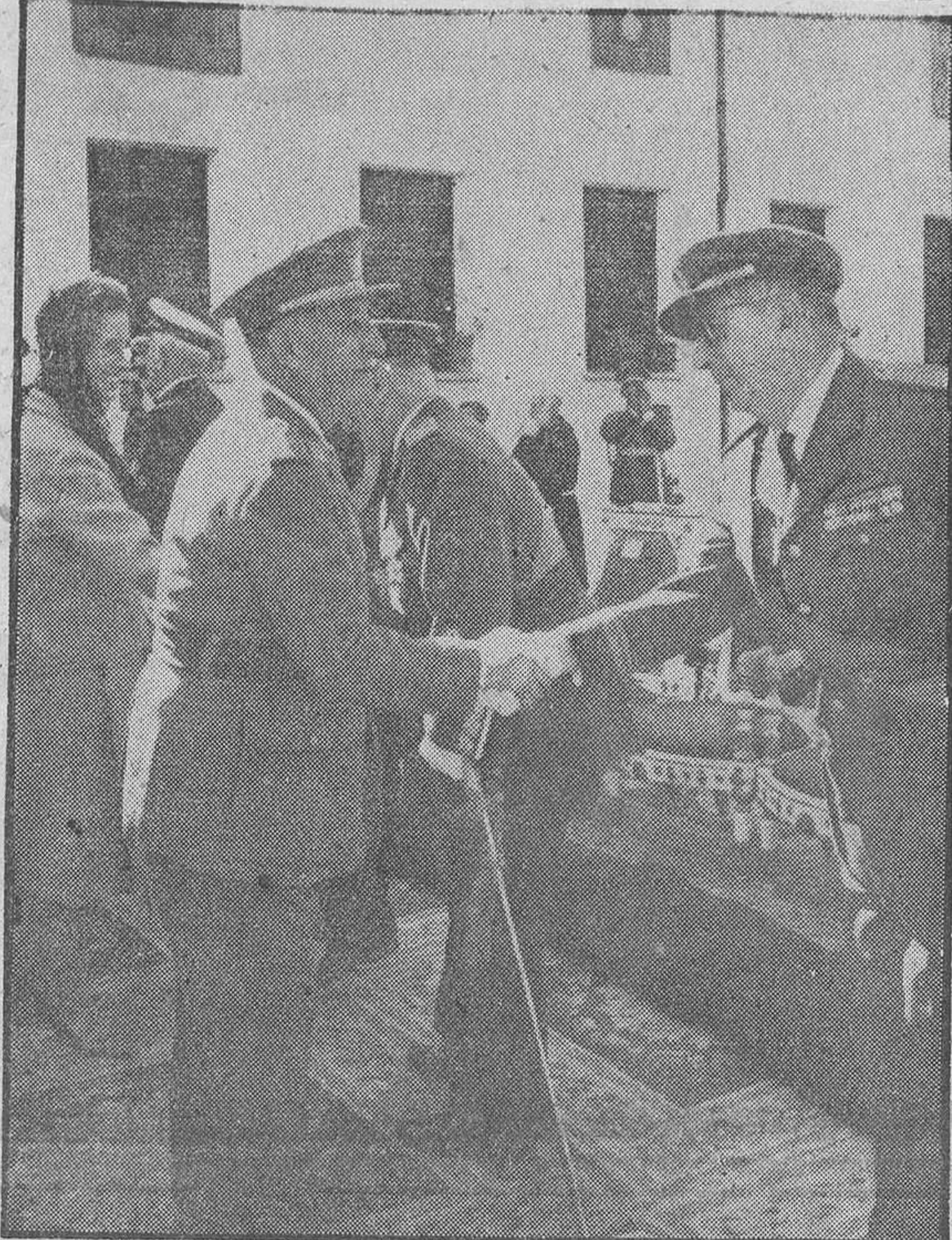
Con motivo de la festividad de San Francisco de Asís, onomástica de S. E. el Jefe del Estado, Generalísimo Franco, se celebró en el palacio de El Pardo una misa de campaña a la que asistieron, entre otras personalidades, ministros y personal de las Casas militar y civil. Acompañaba al Caudillo su esposa