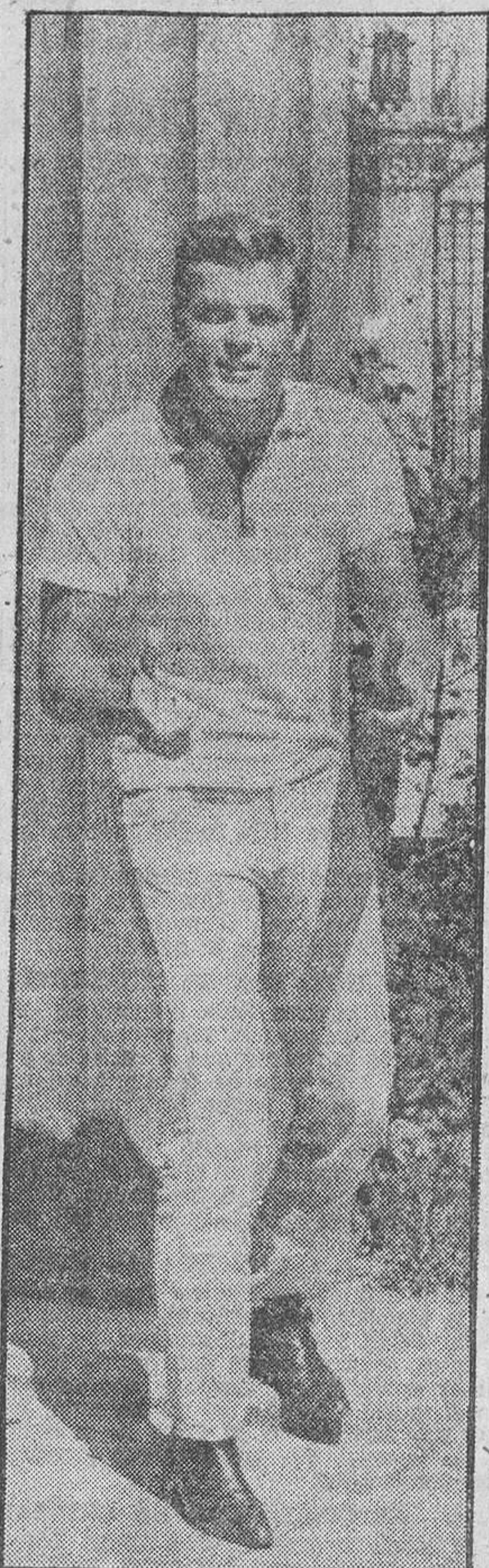
Bronco, el famoso astro de la Televisión norteamericana, cuyas películas del Oeste se están proyectando en la TVE, fotografiado en Madrid.

se al cine. Su nombre: Ty Hardyn, ahora más conocido por Bronco Lane, el «cowboy» alto y fuerte, de pelo rubio y ojos azules, que hace cumplir la ley a lomos de su caballo y al ritmo de sus disparos.