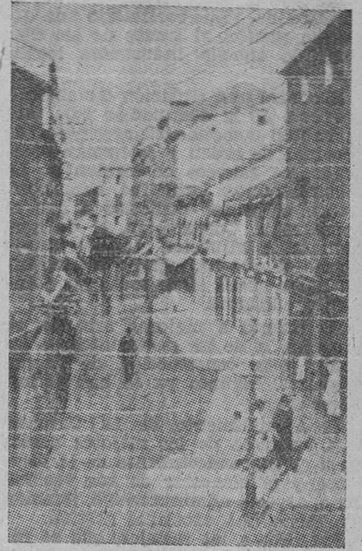
PASAJE DEL COMERCIO