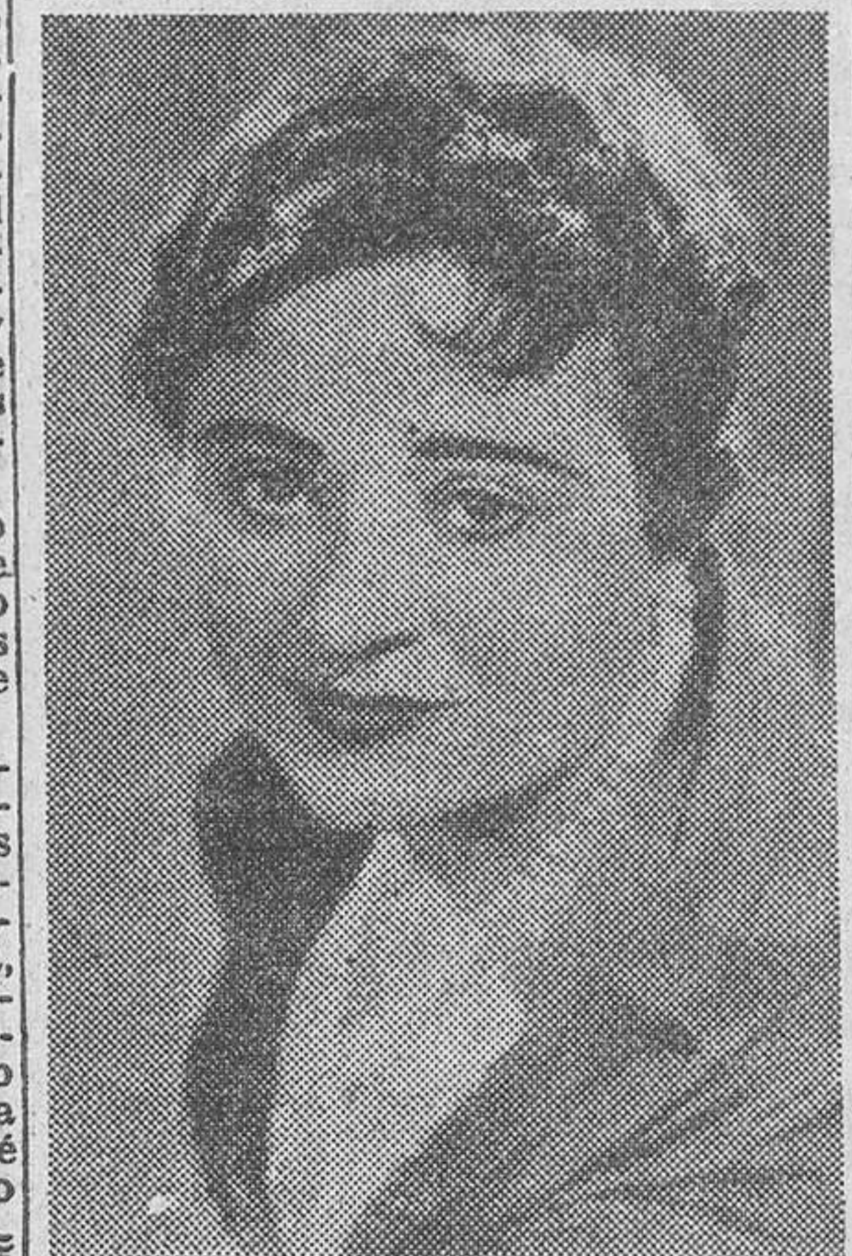
VICTORIA DE LOS ANGELES

Es difícil establecer valoraciones en el Festival. Pero, a pesar de todo, me atrevo a afirmar que estos dos conciertos de la Orquesta de Stuttgart son de lo mejor que se registra en estas se-