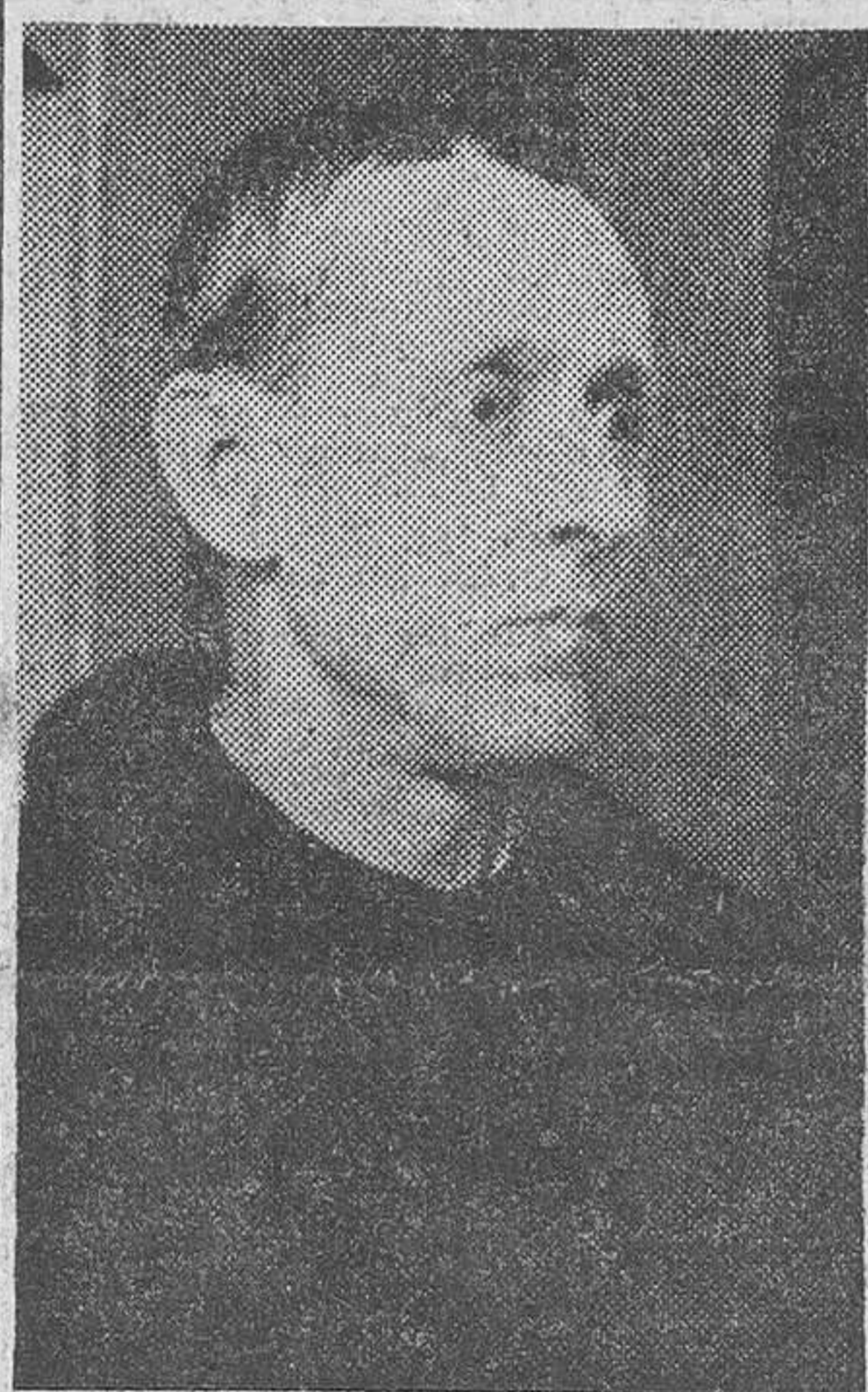
R. P. DUE

to curioso en relación con esta anormal situación climatológica?