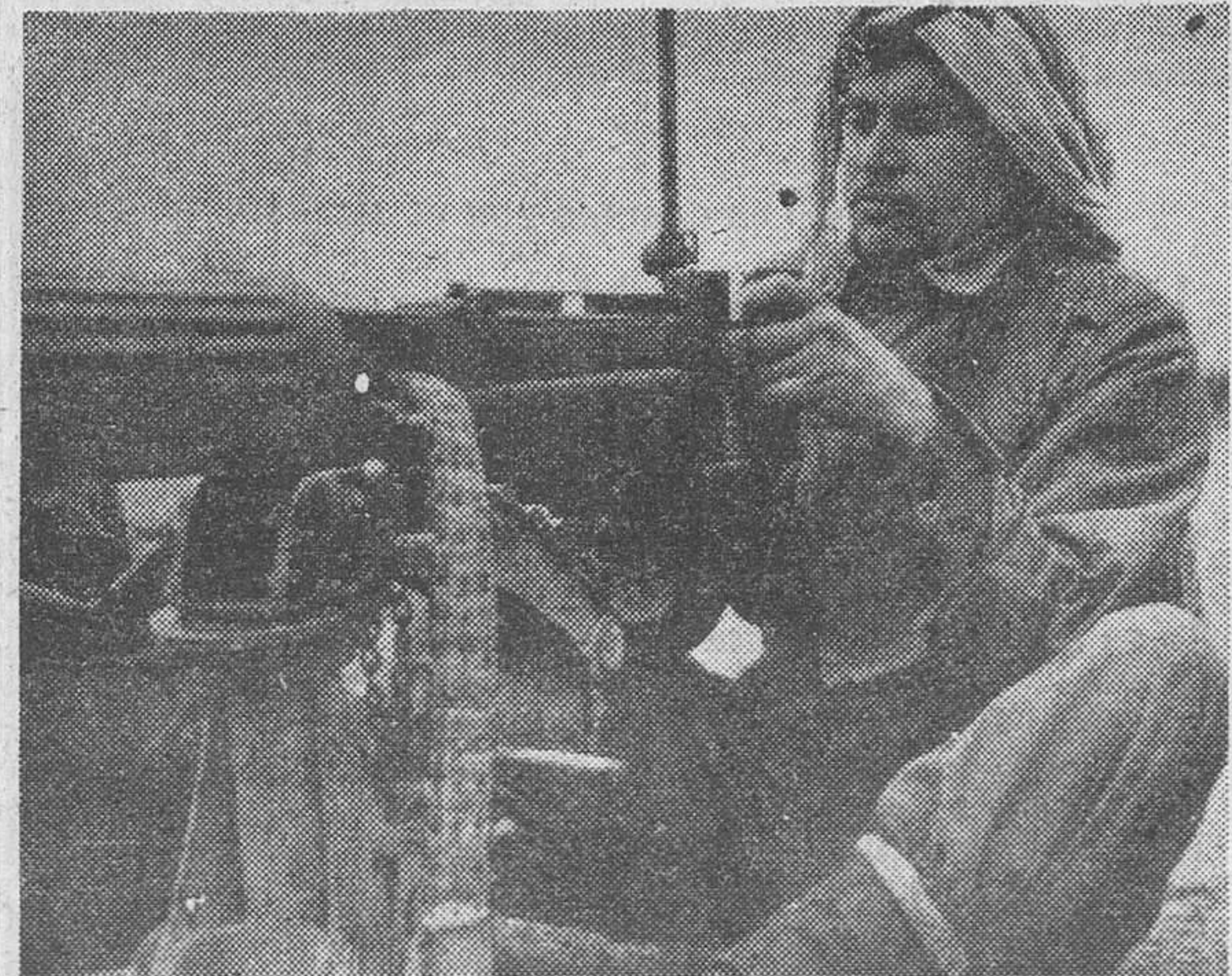
Un jefe cabecilla rebelde, sentido en su puesto de combate durante una de las batallas que estos días se están librando entre fuerzas gubernamentales y los rebeldes. El armamento, como queda apreciarse, es de fabricación soviética.