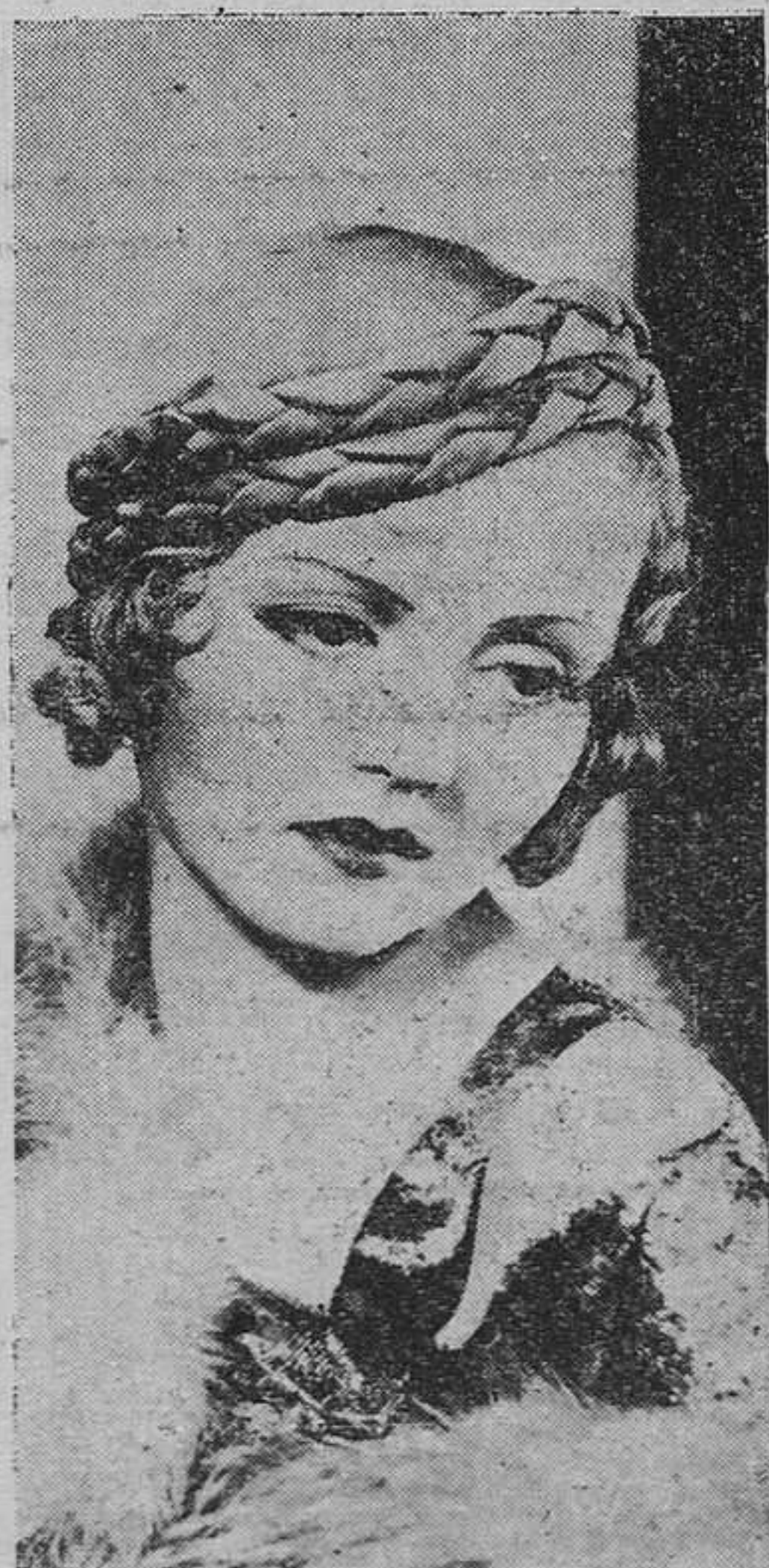
Nancy Carroll, la bellísima actriz irlandesa, cuya interpretación en "Chicago" fué el primer hito de una carrera tan rápida como brillante y pródiga en triunfos.

Amablemente, Berkeley avanzó para posar entre las muchachas agrupadas en torno suyo. Dando un grito salvaje, toda la masa de muchachas efectuó a la una la última zambullida en la piscina con enorme chapoteo, arrastrando con ellas a Berkeley que tomó así un baño totalmente inesperado.