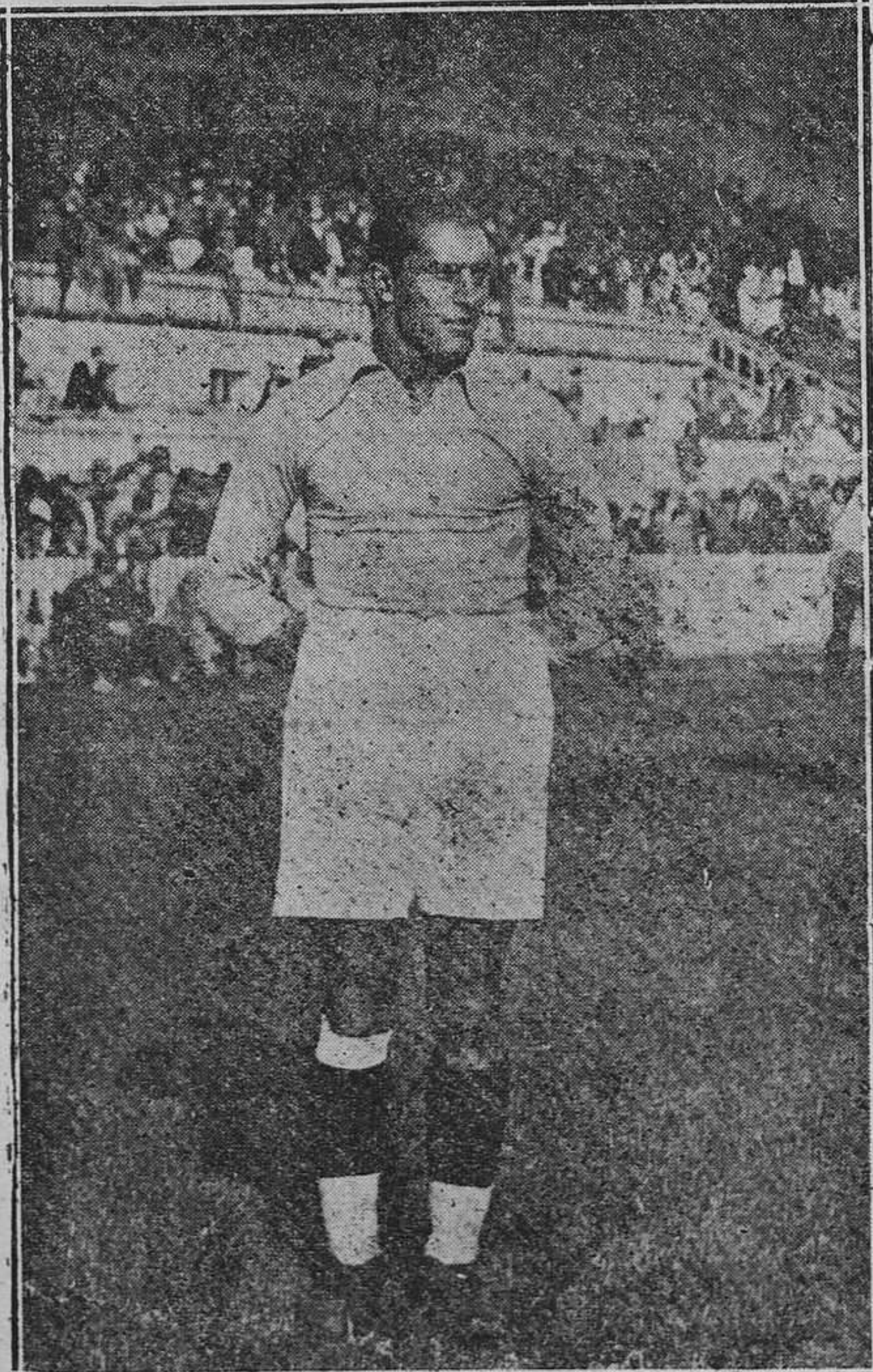
Thus, medio izquierda del Oviedo, que, por lesión y enfermedad de los defensas Sion e Ibañez, formará pareja con Calchi mañana, domingo, en San Sebastián.