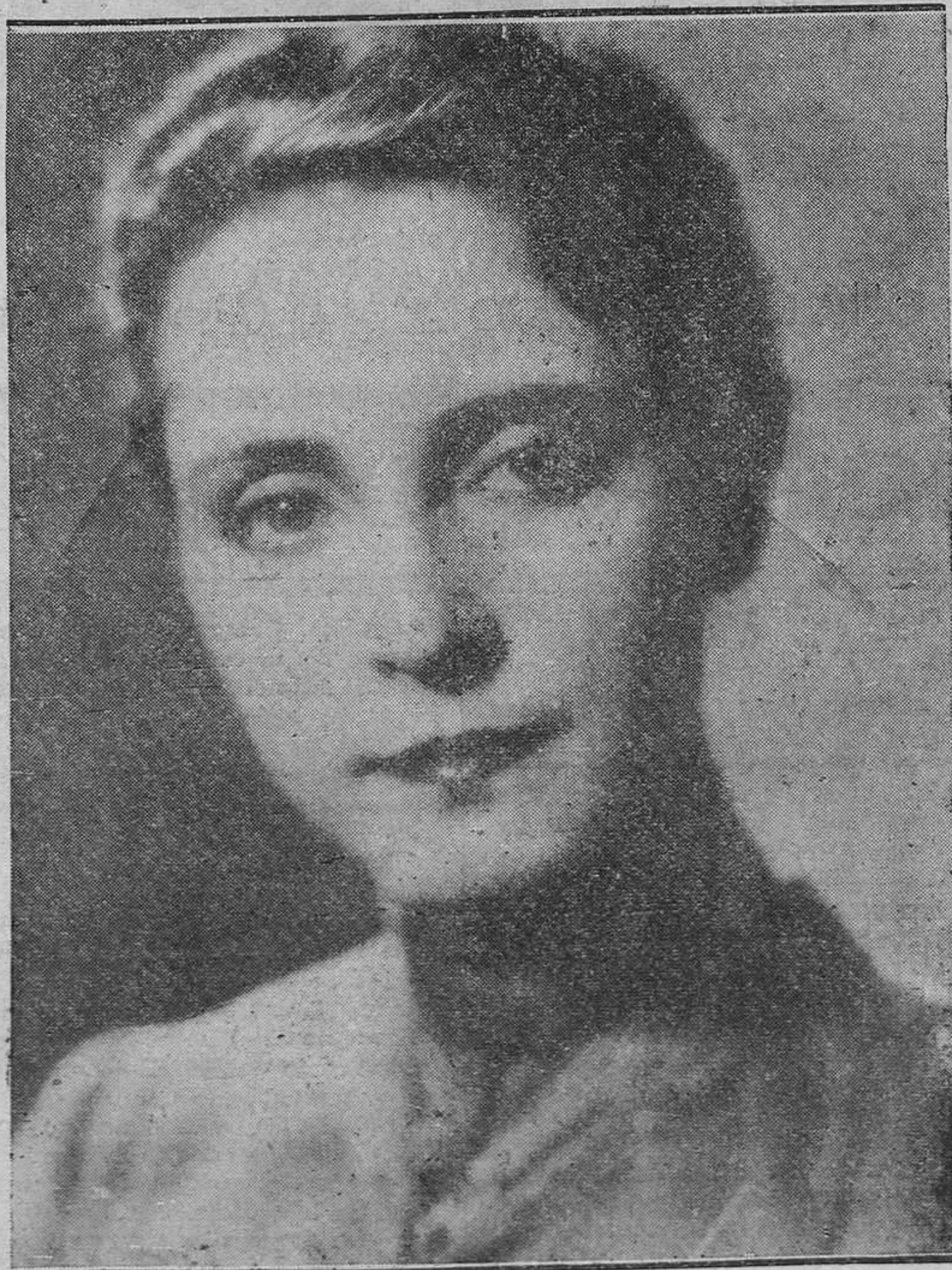
Dorotea Wieck, la amable profesora de "Muchachás de uniformes", descendiente de Schumann, conquistó las más altas cumbres de la popularidad con su interpretación en aquella famosa película, hasta el punto de que cuando llegó a Nueva York, de paso para Hollywood, ventajosamente contratada, recibió la sorpresa de que la conocían muchas personas, entre la gente con quien se encontraba por la calle.