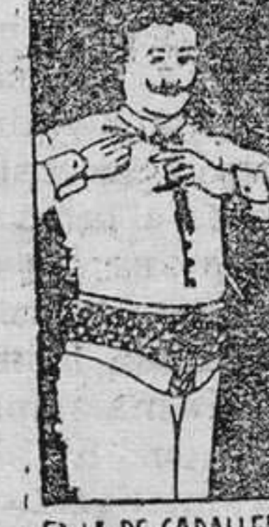
FAJA DE CABALLERO