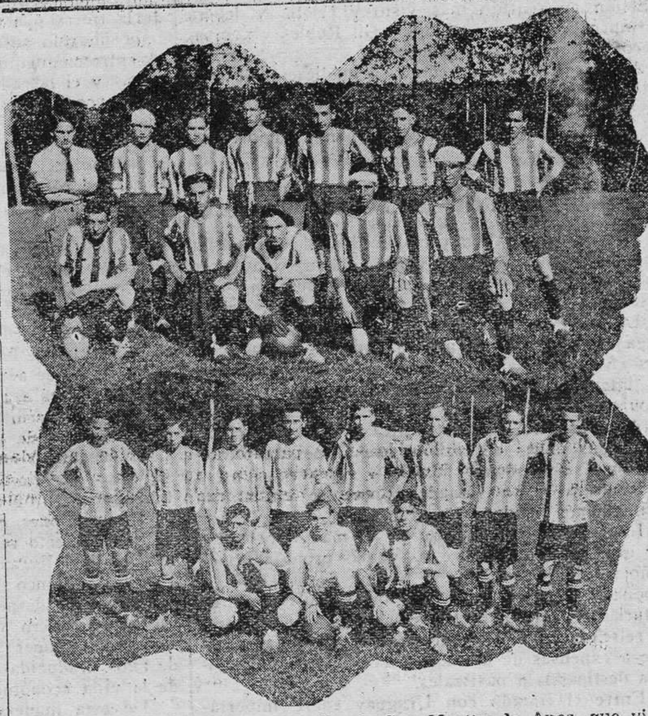
El Athletic Club y Arenas F. C., de San Martín de Anes, que vienen realizando una brillante temporada futbolística.

En esta zona de Asturias, contribuyen a la organización de la carrera. Tanto particulares como elementos oficiales ayudan su desenvolvimiento. Los Ayuntamientos de la zona Occidental de la provincia, como en años anteriores, han ofrecido su colaboración moral y material mas crecientemente. Esta prueba es puntuable para el Campeonato de España.