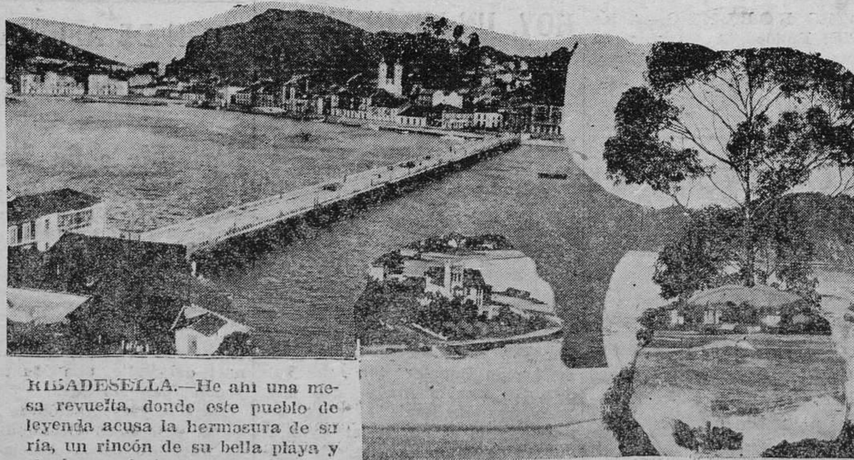
RIBADESELLA.—He ahí una mesa revuelta, donde este pueblo de leyenda acusa la hermanura de su ría, un rincón de su bella playa y el choque furioso de las olas entre el recale de la costa.

Especialidad en cribados y menudos para vapores de pesca DAMAS SANCHEZ (Suc. de Secundino) - Telf. 7 - Ribadesella