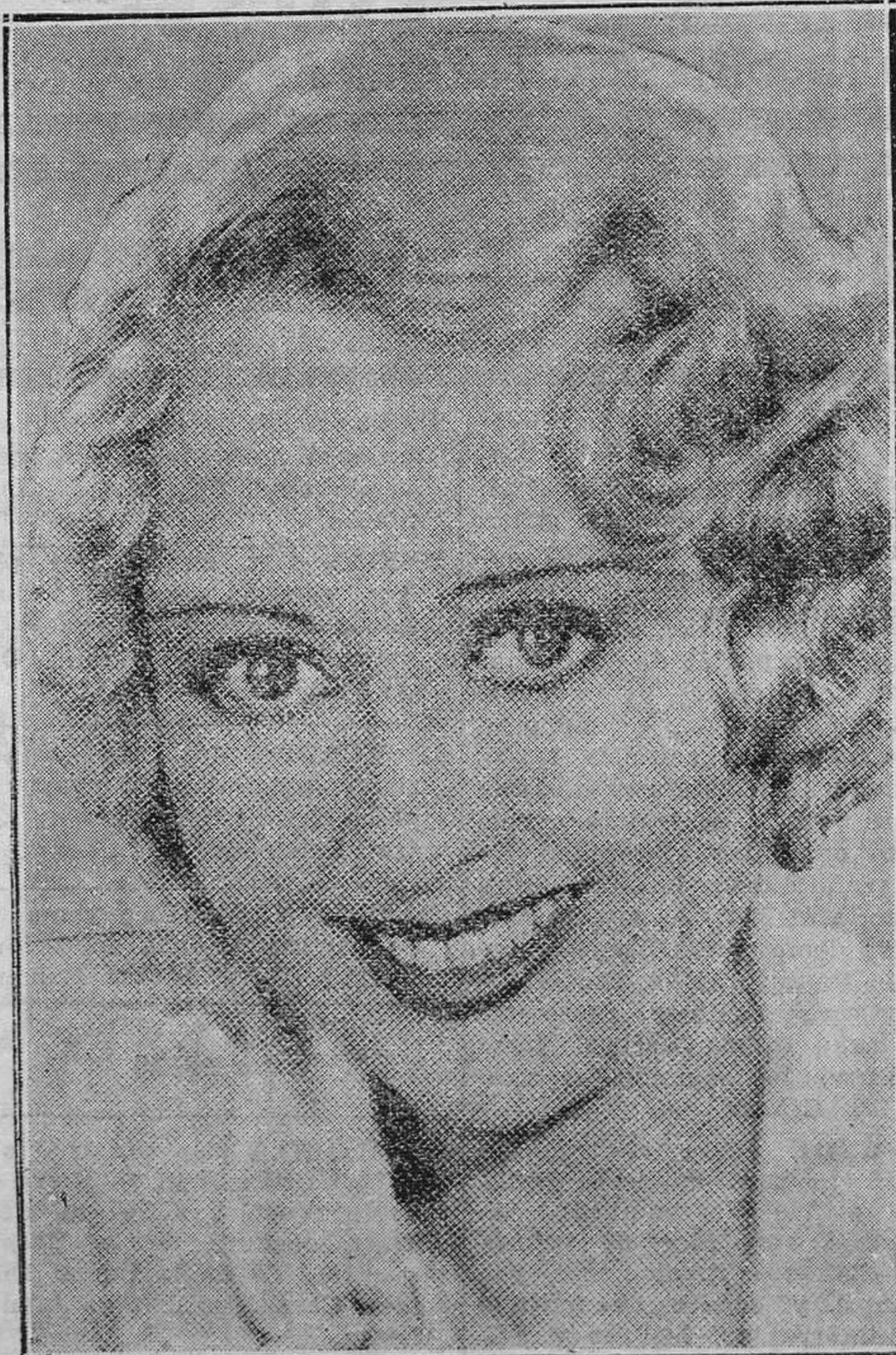
Joan Blondell, la encantadora estrella de la Warner Bros, que ha obtenido un gran éxito como protagonista de "El picapleitos vindicado".