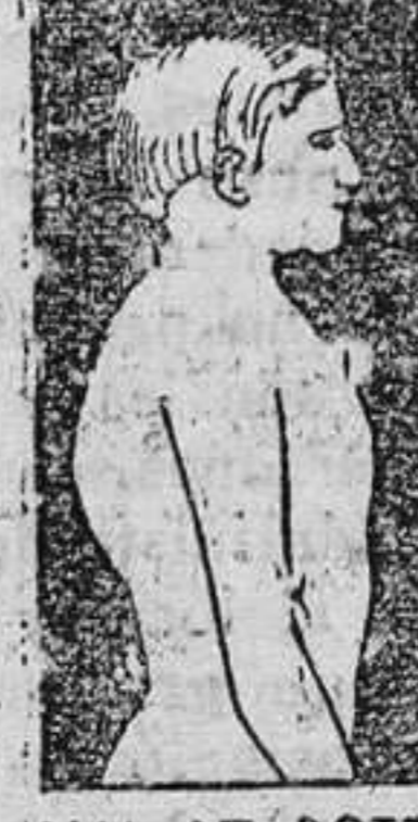
MAL DE POTT