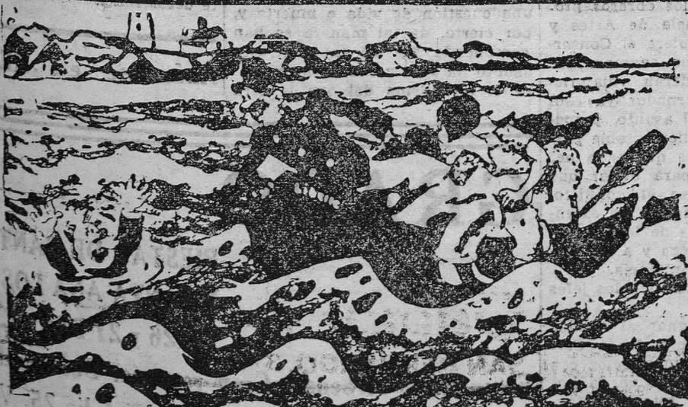
EL PADRE.—Por Dios, que me ahogo. Déme usted la mano. E LMARINO.—Déme usted primero la de su hija. (De "Lustige", Leipzig.)