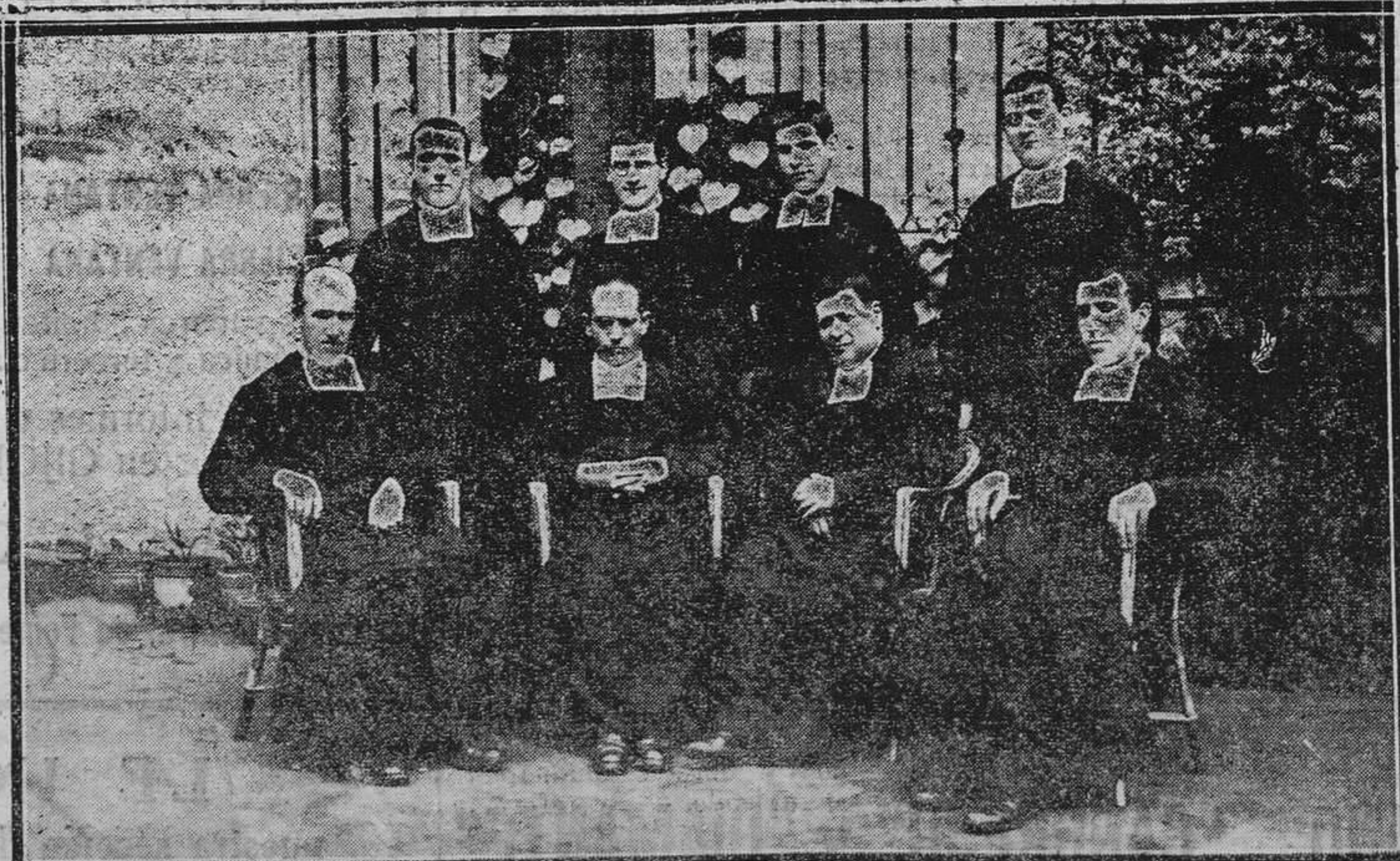
LA FELGUERA.—Los Hermanos de las Escuelas Cristianas de esta villa, a quienes se rindió un homenaje merecido con motivo de su obligada marcha, después de treinta y un años de meritísima labor.