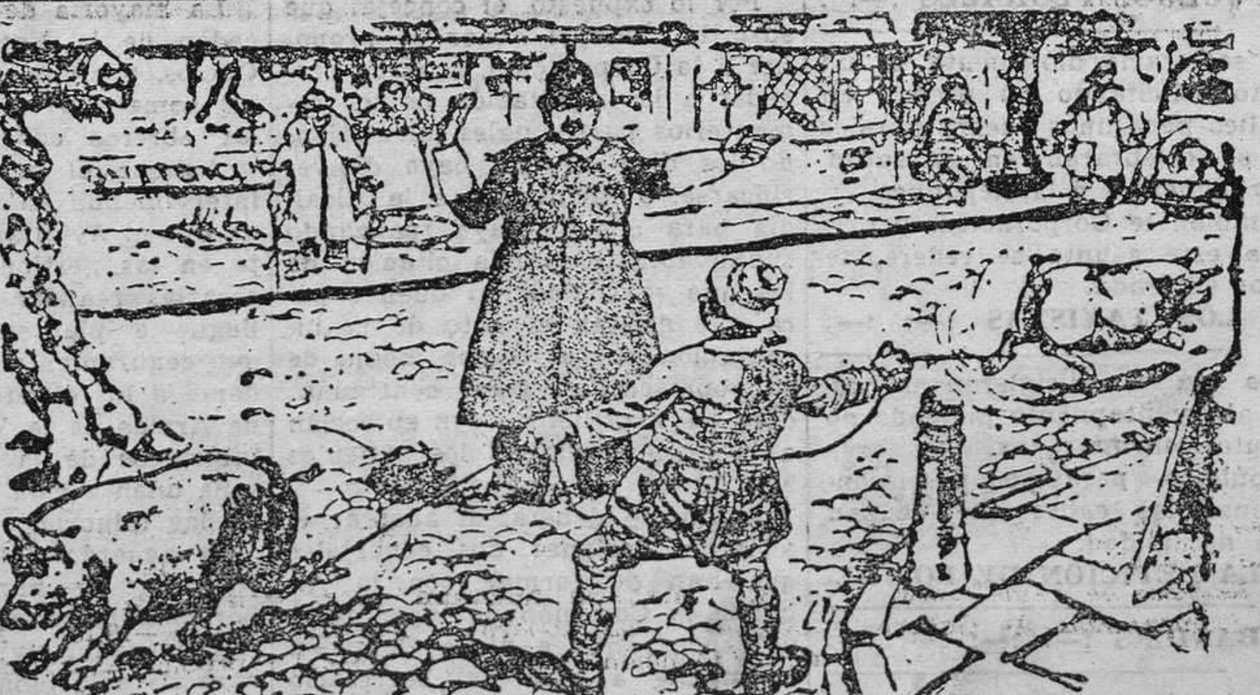
EL GUARDIA.—Eh! ¿Dónde va usted con esos cerdos? ¿No sabe que esta calle es de dirección única? (De "The Humorist", Londres.)