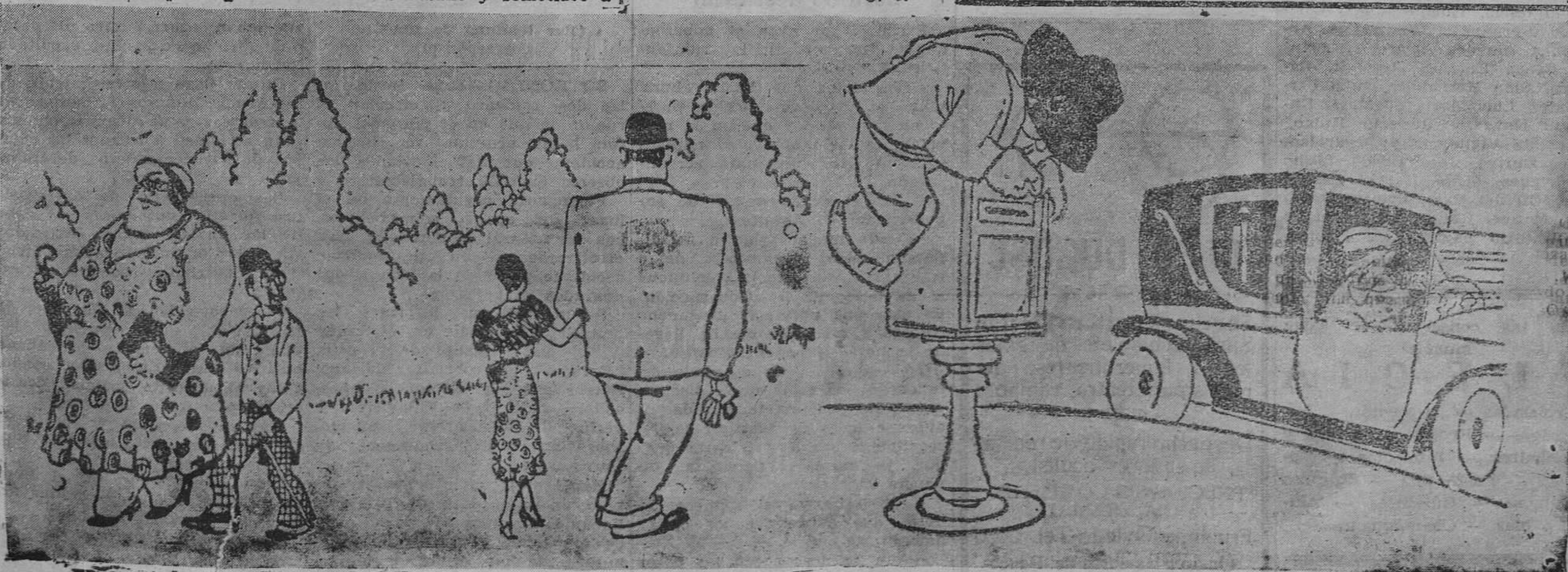
EL MARIDO MARTIR.—Señor!... ¡Pero qué mal arreglada está la vida!...