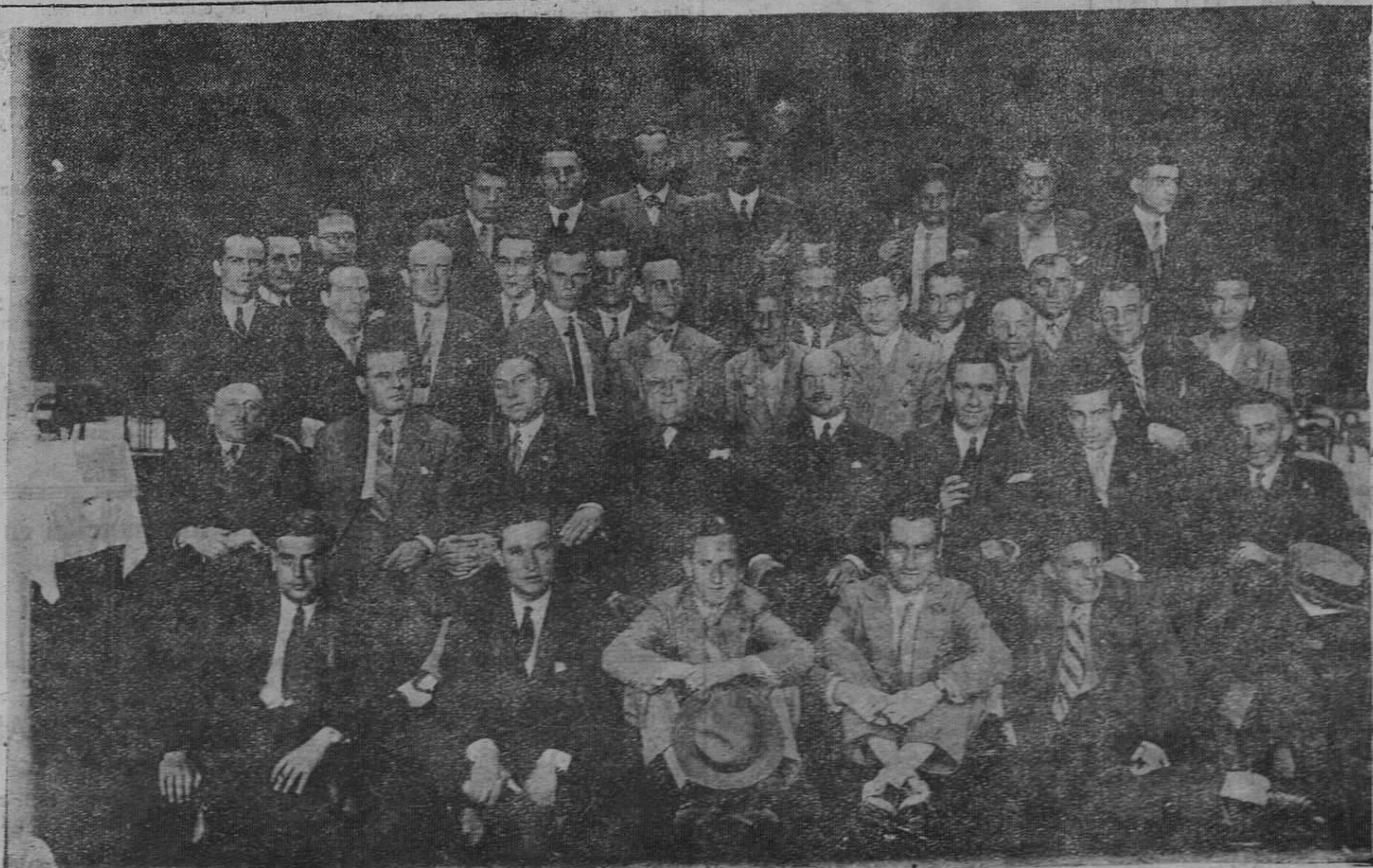
OVIEDO.—El personal de REGION, que se reunió ayer en una comida íntima.

Se habla demasiado del fracaso de los comunistas. Que no nos engañen las palabras. Cada país tiene sus elementos de desorden propios. Los de España han ido más allá que algunos otros. Barcelona fué siempre un foco de anarquía, no por el comunismo, no formado todavía, sino por los nihilistas."