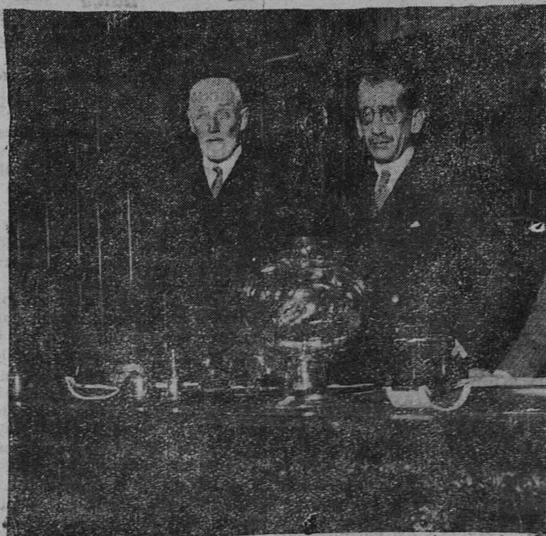
OVIEDO.—Don Pedro Vargas, que ha dimitado el cargo de gobernador civil de Asturias.