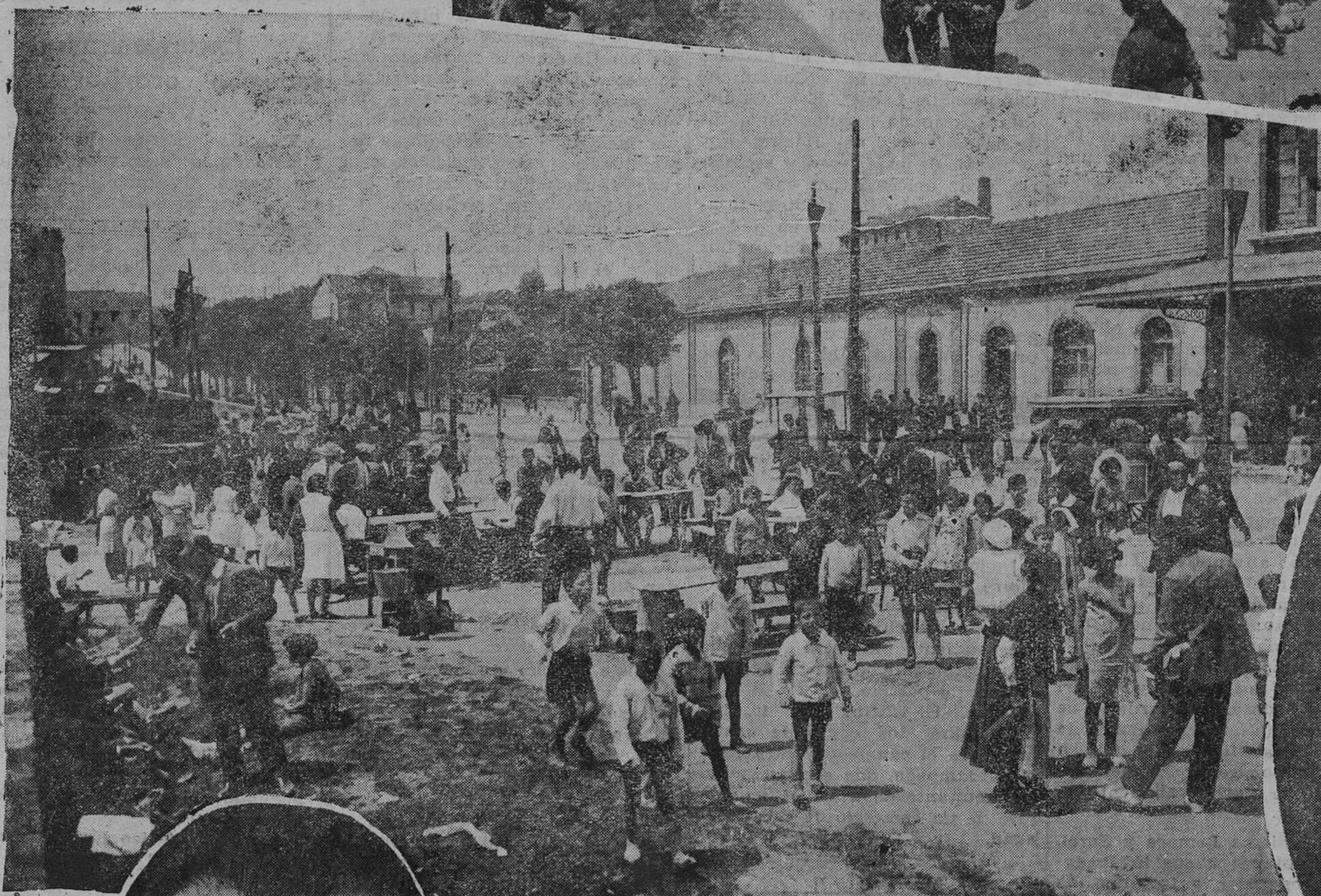
OVIEDO.—Un detalle de la romería de Río San Pedro durante el reparto del bollo y vino a sus socios.