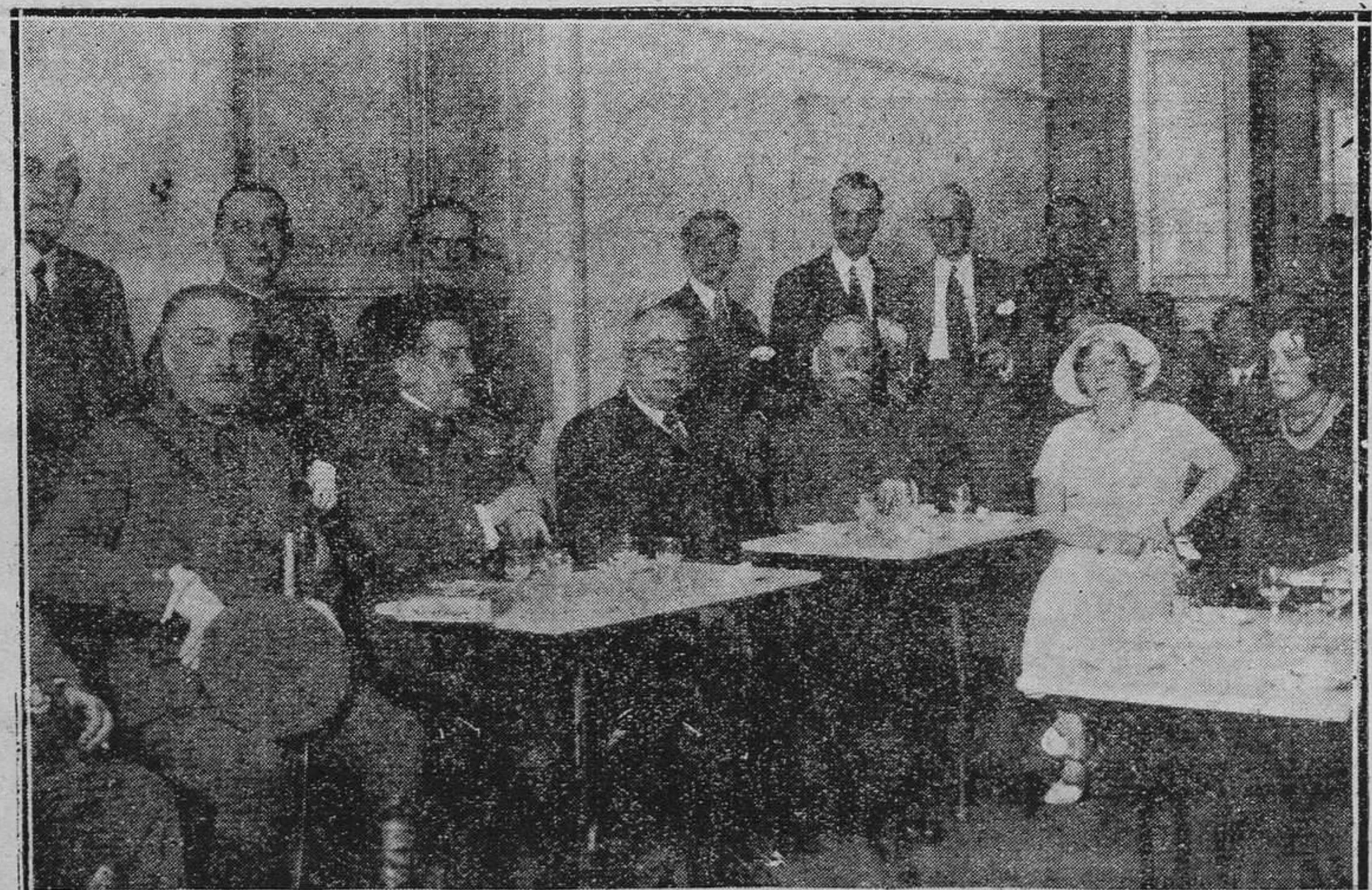
MADRID.—El jefe del Gobierno y ministro de la Guerra, Sr. Azaña, en la inauguración del "Hogar del Soldado".

Para matricularse es indispensable la presentación de la papeleta de examen de la ma asignatura aprobada.