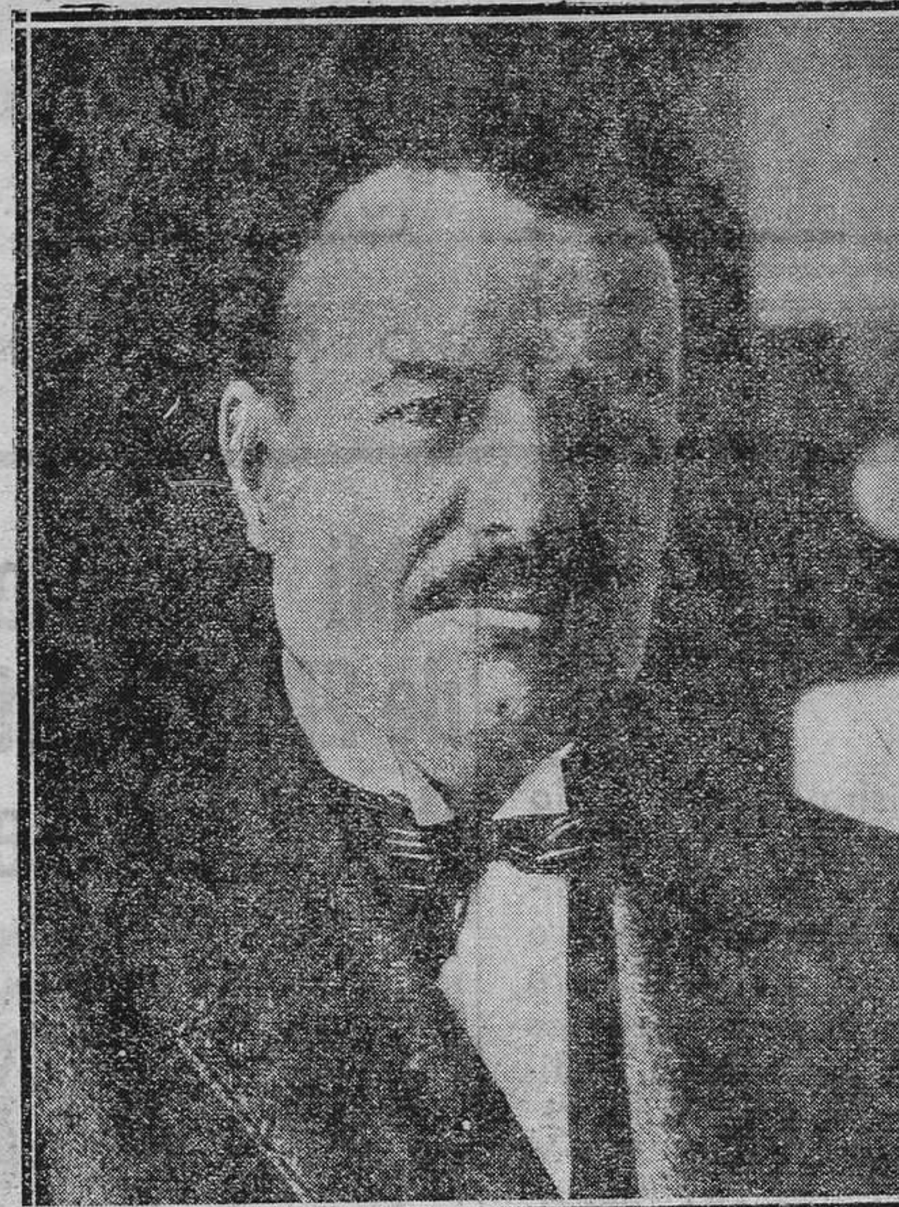
El ex presidente de Cuba, general Ibáñez, que ha sido obligado a salir de su país.