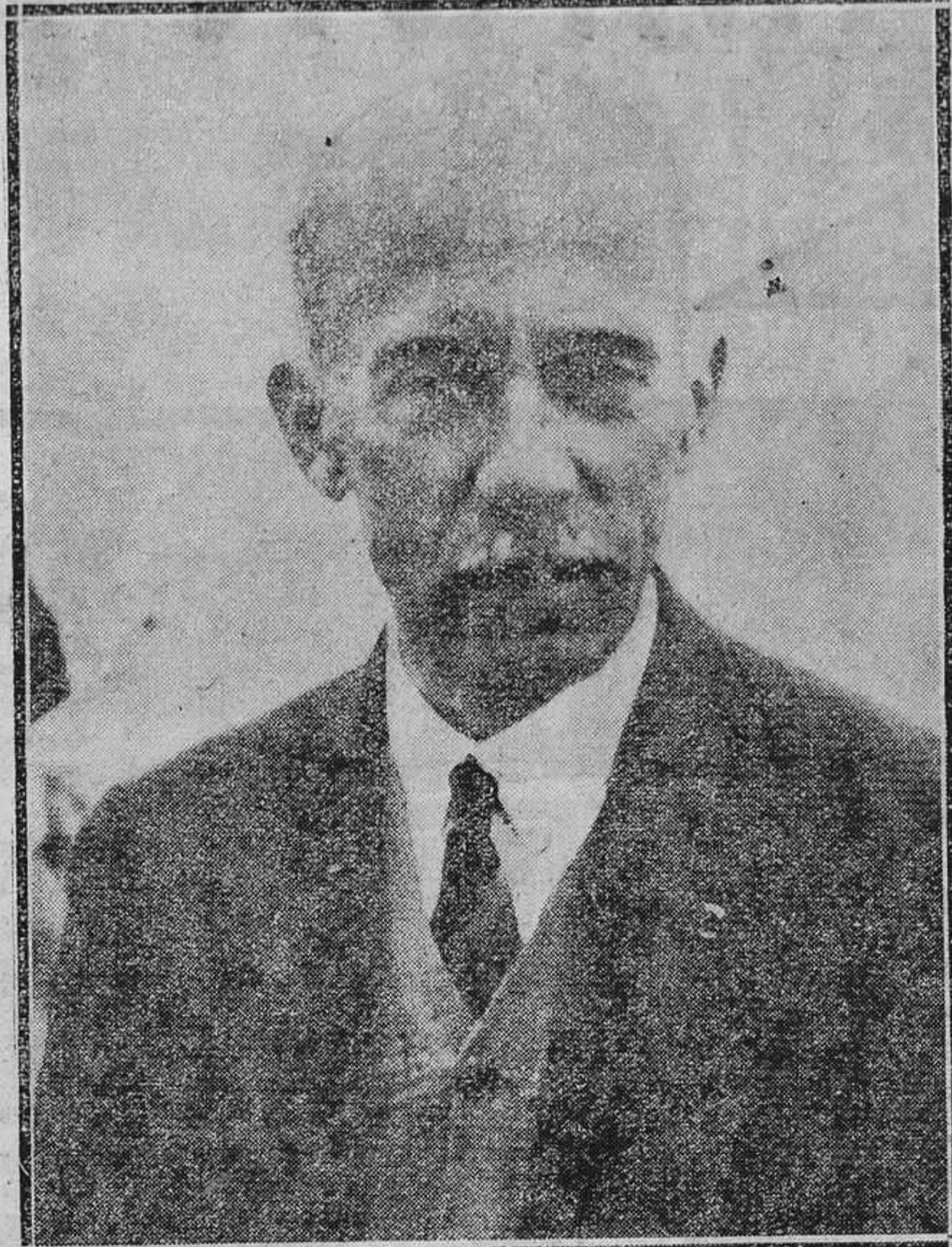
El famoso aviador brasileño Santos Dumont, que ha fallecido.

RIBADEO.— Cuando regresaba del pueblo de Abres, voló en una curva peligrosa un automóvil dedicado al transporte de viajeros. Resultaron 16 heridos, de ellos cuatro gravísimos, que fueron trasladados a Vegadeo. Al volver el auto derribó un poste de la luz eléctrica, quedando a oscuras varios pueblos. El chófer ha sido detenido.