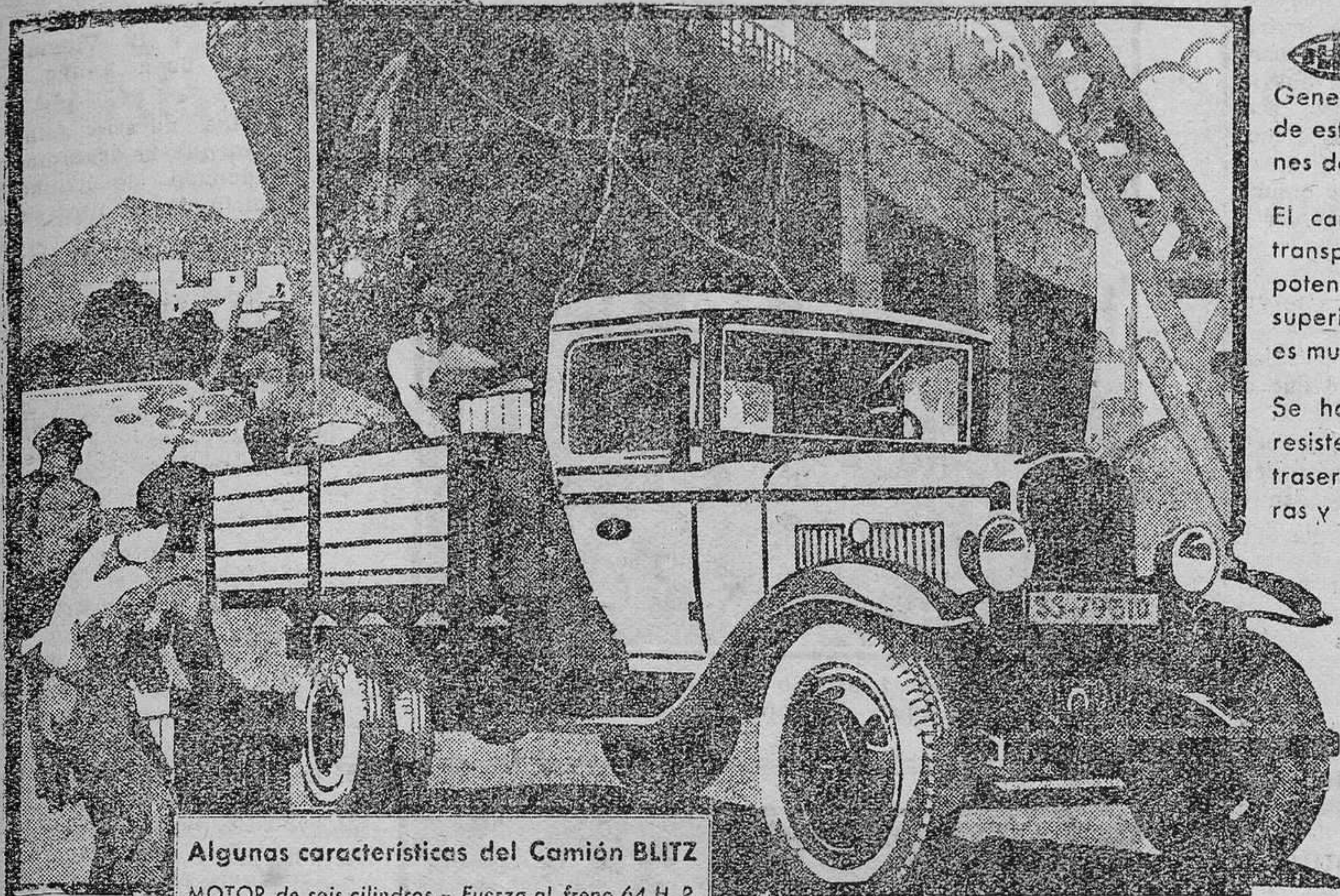
Algunas características del Camión BLITZ

de 2 1/2 Toneladas le ofrece características propias de camiones de alto precio