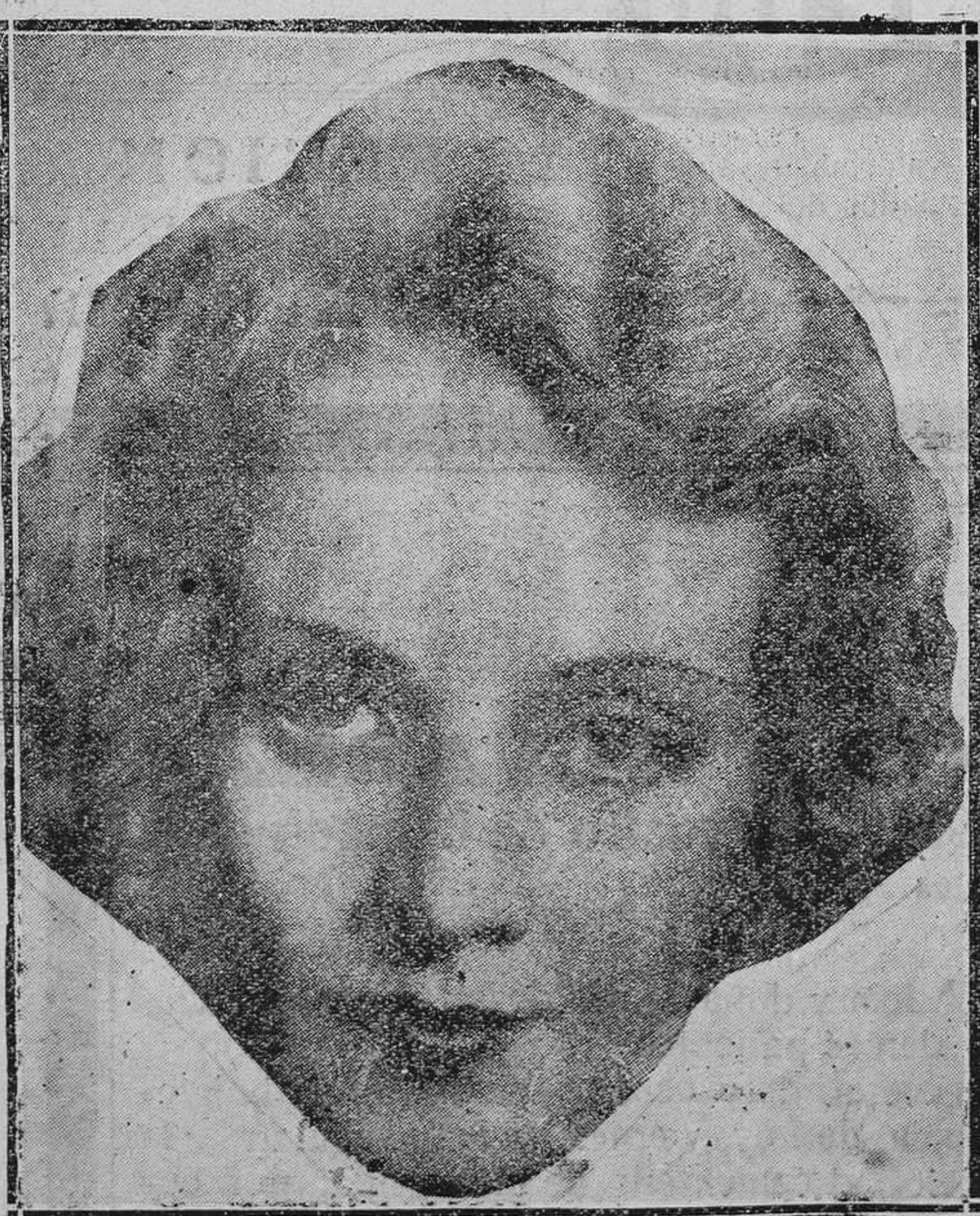
Marlene Dietrich, que, para satisfacción de sus admiradores, reaparece hoy ante nuestro público en el "reprise" de una de sus mejores producciones.

—Sidney Fox ha resultado herido en un accidente de automóvil, a consecuencia del cual, su coche quedó completamente trozado, sufriendo el popular actor tan sólo ligeros arañazos.