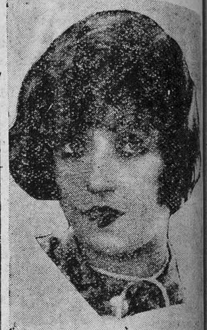
esta aspirante a "estrella", do por Augustus Johns.

En la Real Academia de Arte de Londres, existe un retrato de