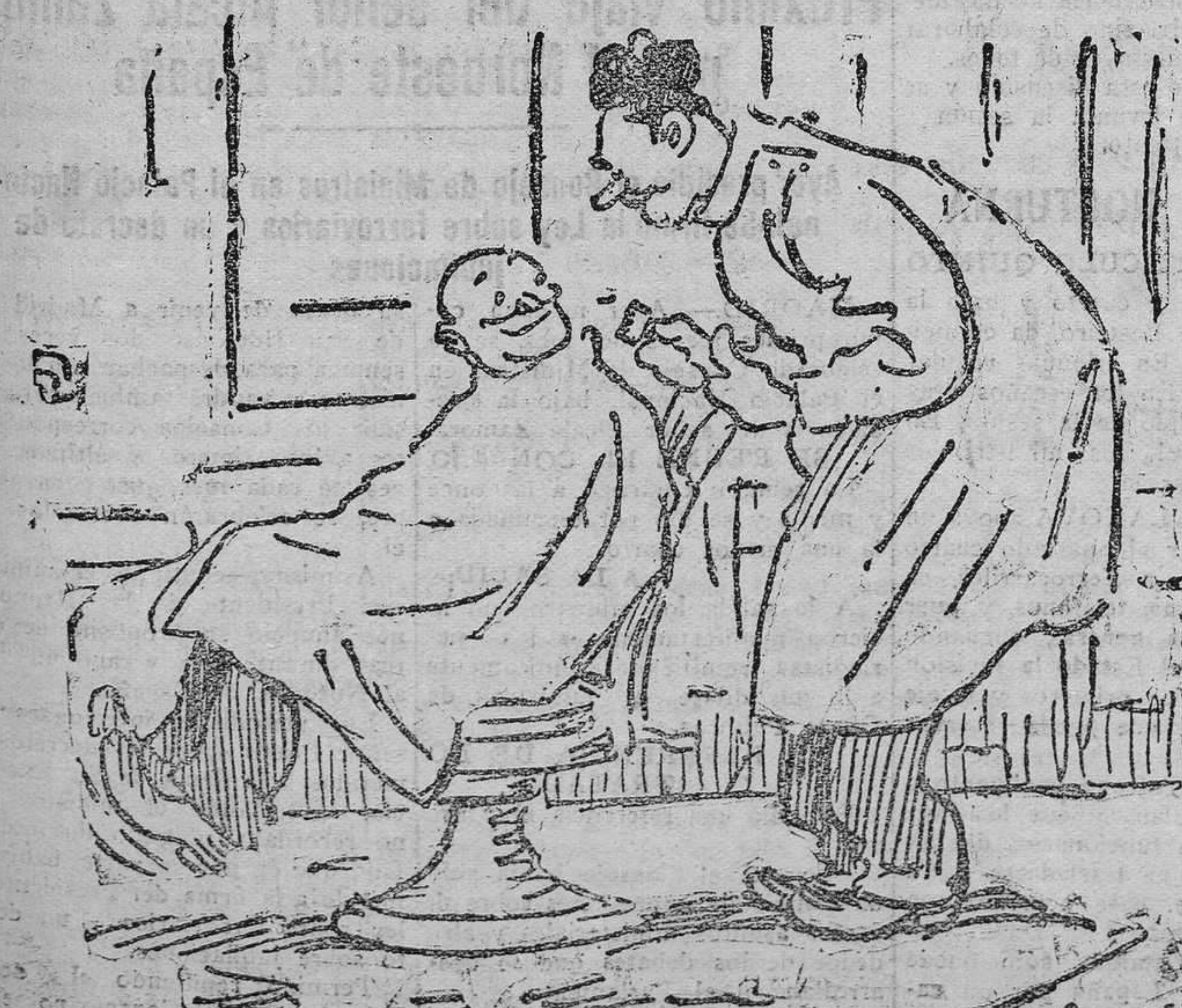
DIALOGUILLOS DE ACTUALIDAD

La junta directiva del Círculo Mercantil acordó suprimir durante los meses de julio y agosto la cuota de entrada establecida para los socios fundadores.