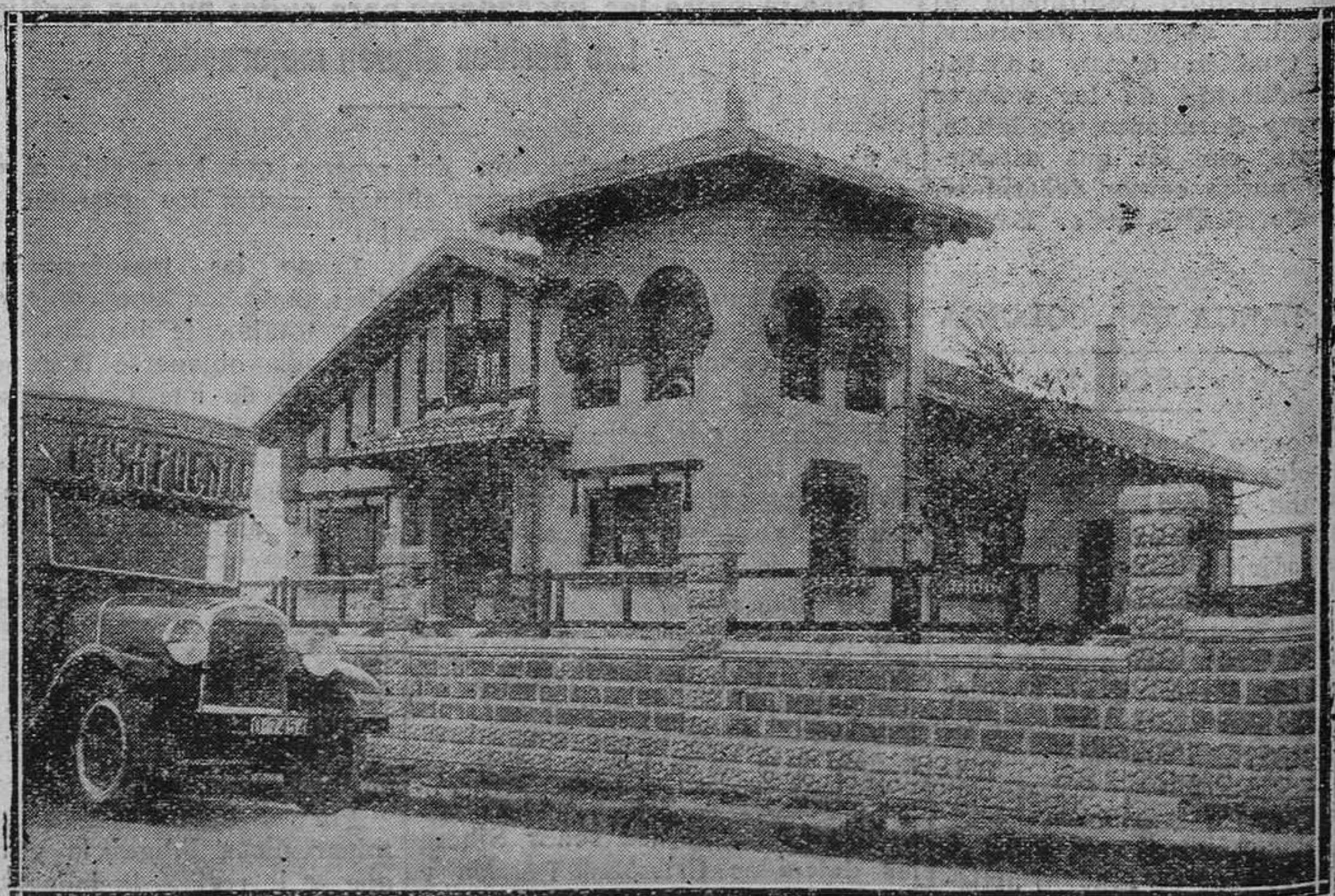
«Villa Maruja», en la Avenida del Piles (Gijón), suntuosamente amue- blada por la Casa Fuente, de Gijón y La Felguera

Y Van Dike que no repara en gastos, bien nos lo demostró con "Trade-Horn", fletará una balle- nera bien marinera para acercarse lo más posible a las grandes regio- nes heladas. El gran realizador lle- vará más de cincuenta toneladas de víveres, cantidad calculada pa- ra el suministro de la expedición durante el año que ésta durará.