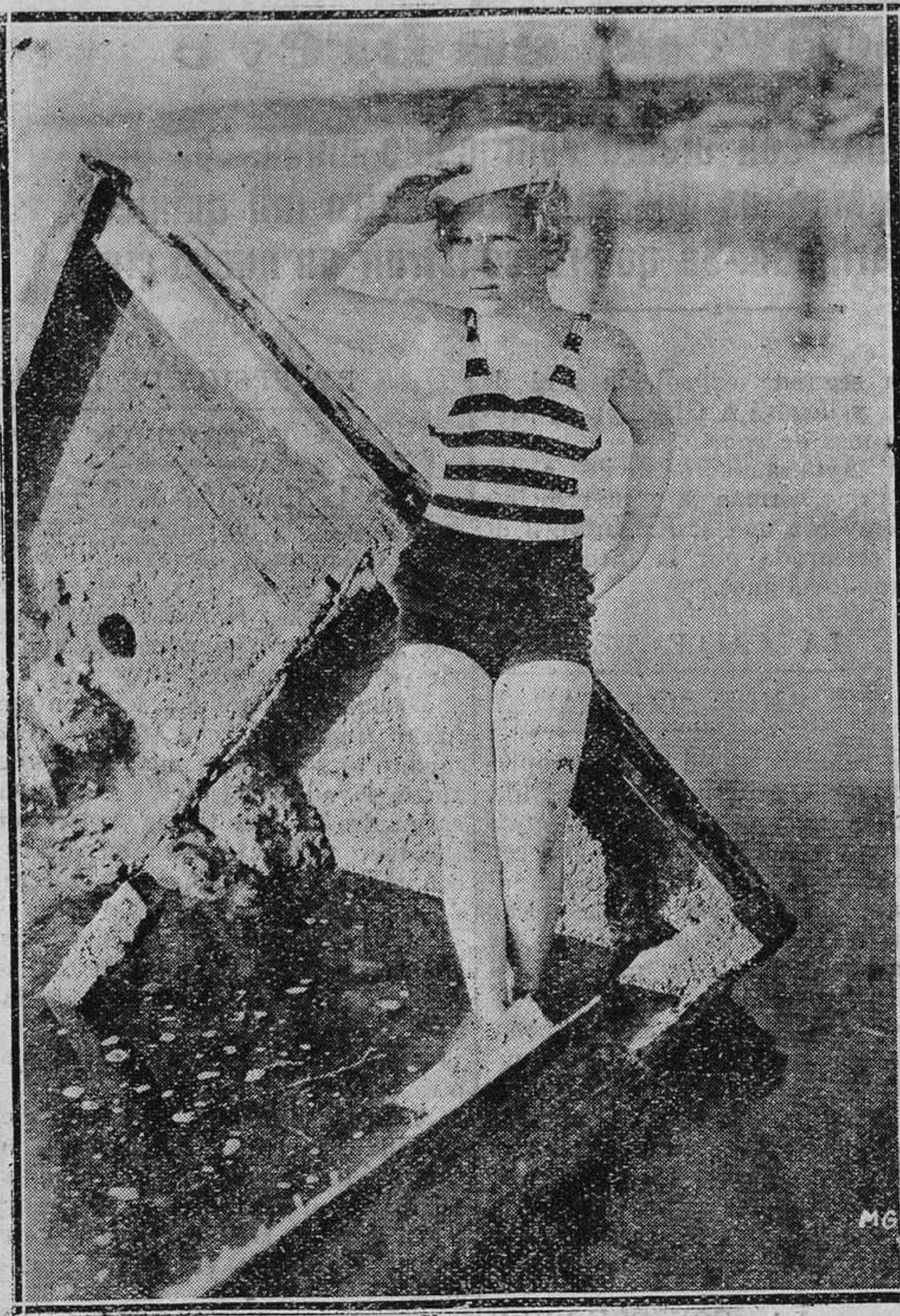
Jackie Cooper, juvenil astro de la M. G. M., durante un día de asuetto en la playa de Santa Mónica.