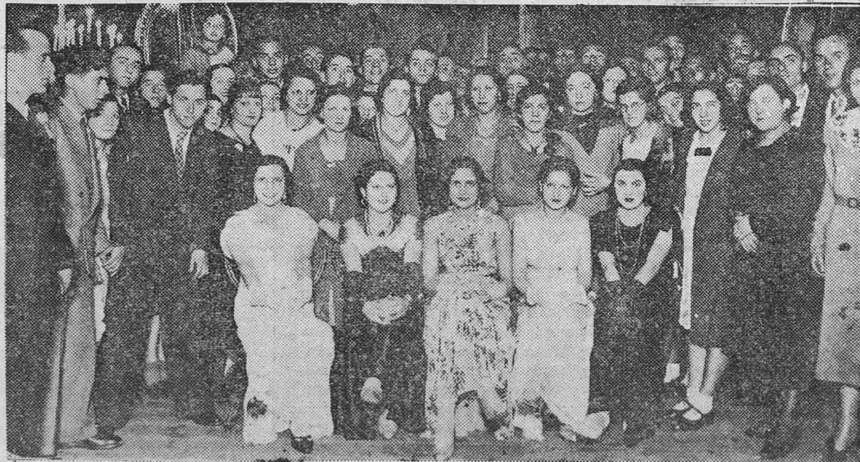
OVIEDO.— Las "Misses" en el Orfeón Ovético, rodeadas de varios asistentes al baile que se celebró en su honor.

Una divertida comedia romántica, genialmente interpretada por GENEVIEVE TOBIN y CHESTER MORRIS.