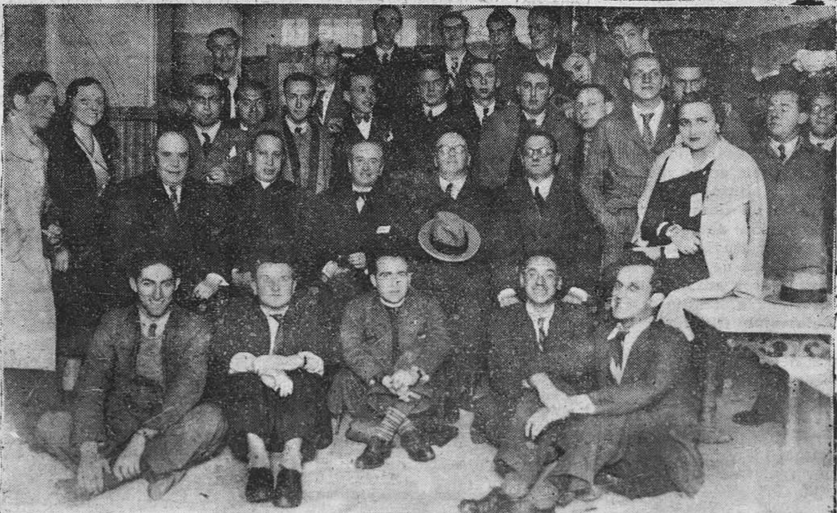
Estudiantes católicos y varios catedráticos de la Universidad, que se reunieron ayer en fraternal banquete, con motivo de la festividad de Santo Tomás de Aquino.

—¡Quí! Si lo reimprimiesen nadie lo compraría.