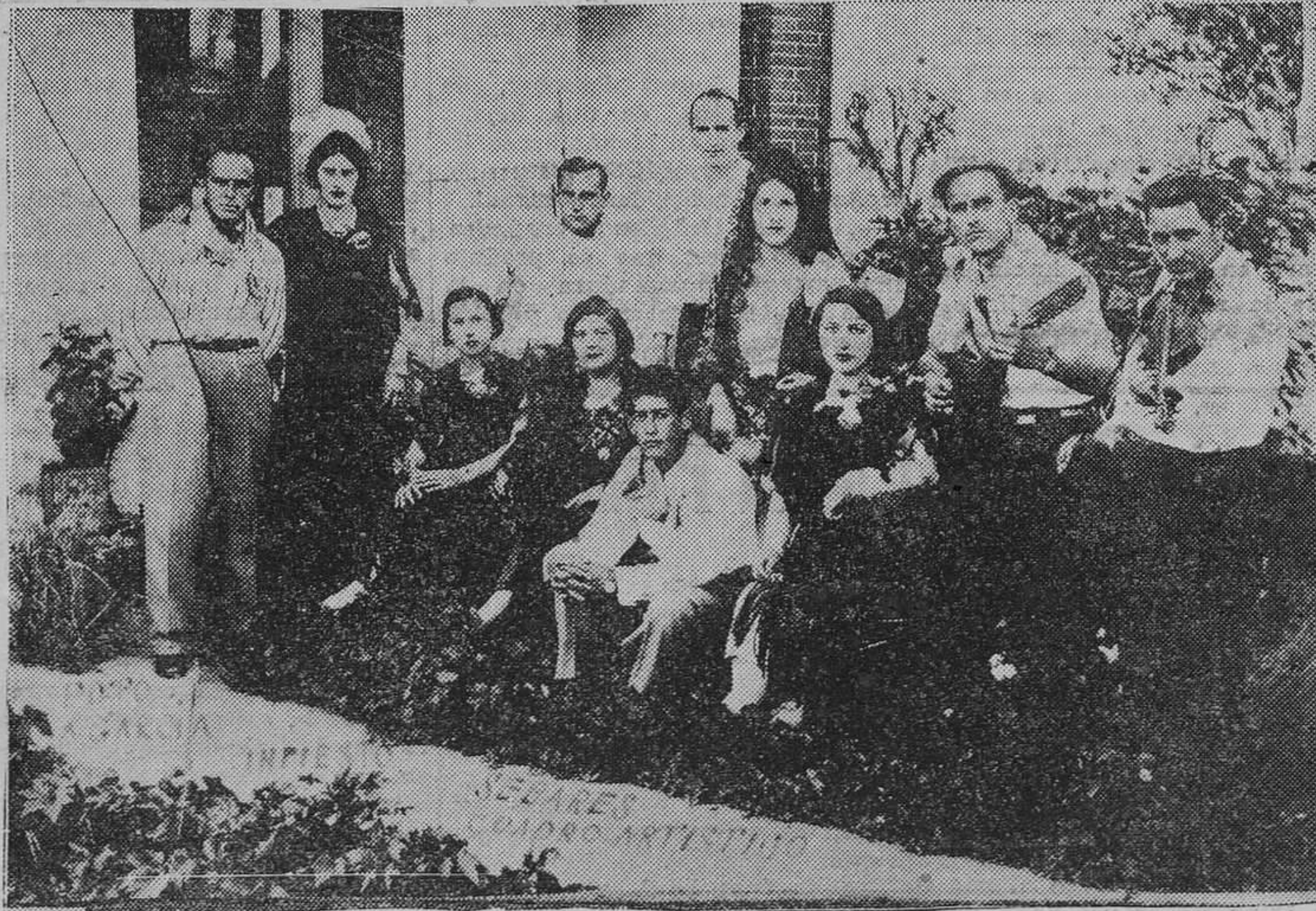
SEÑALES (infiesco).— El cuadro artístico compuesto por inteligentes jóvenes que obtienen excelentes éxitos en su actuación.