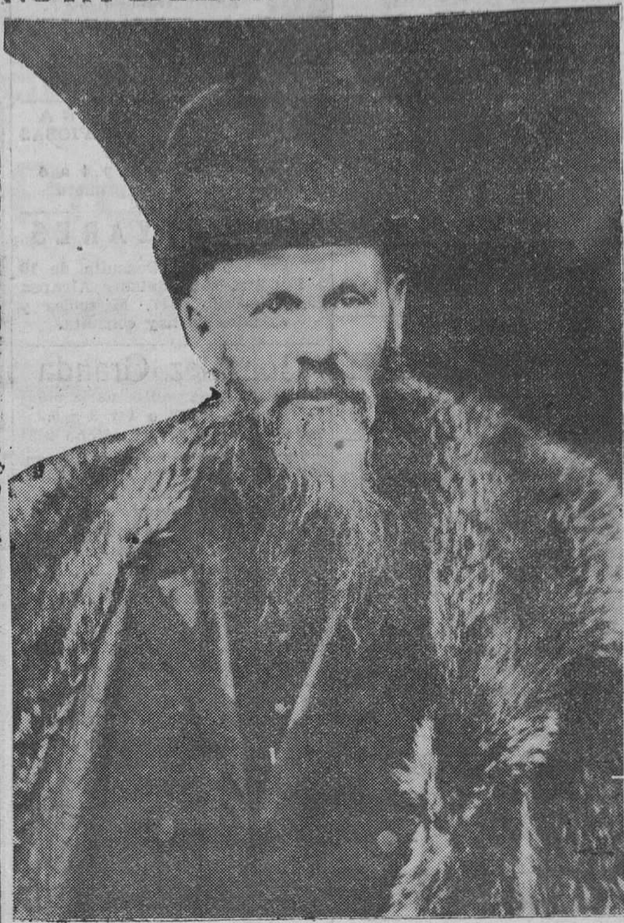
Monseñor Turquetil, Obispo de todos los territorios que rodean el Polo Norte. Monseñor Turquetil, que era Vicario apostólico de la Bahía de Hudson, ha sido misionero durante treinta años entre los esquimales.

Y si el coronel que fué a Ifni no se quiere quedar para ese menester y salvar a España de la anarquía, que nombren a otro hombre que sea capaz, aunque no se apellide Capaz. EME.