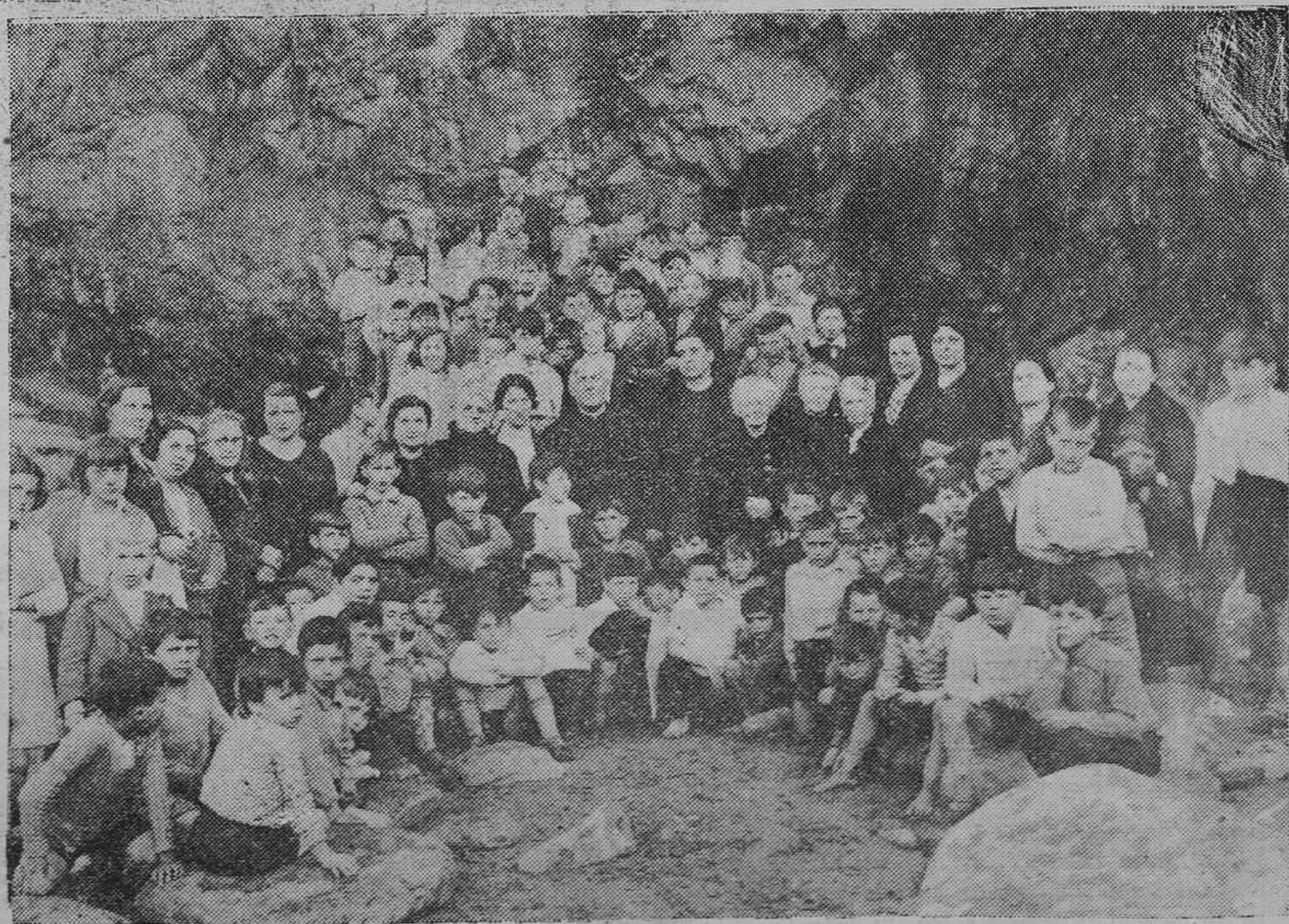
LUARCA.— Los alumnos de la Escuela parroquial, después de la merienda que celebraron en la playa.

VEA NUESTRAS NUEVAS INSTALACIONES GRANDES EXISTENCIAS • INMENSO SURTIDO