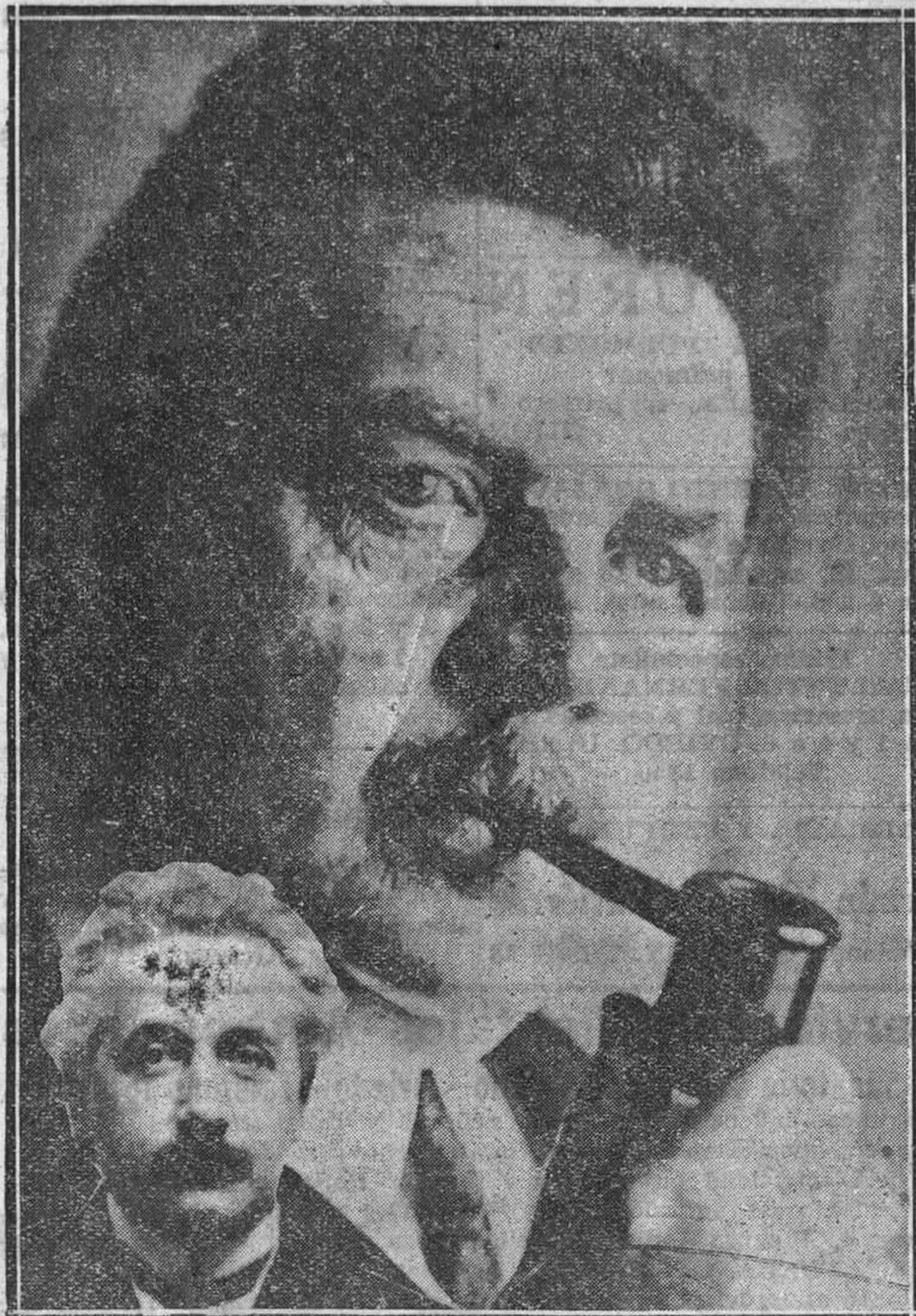
El profesor Einstein y el político francés Herriot, que han sido nombrados doctores "Honoris Causa" de la Universidad de Otago.