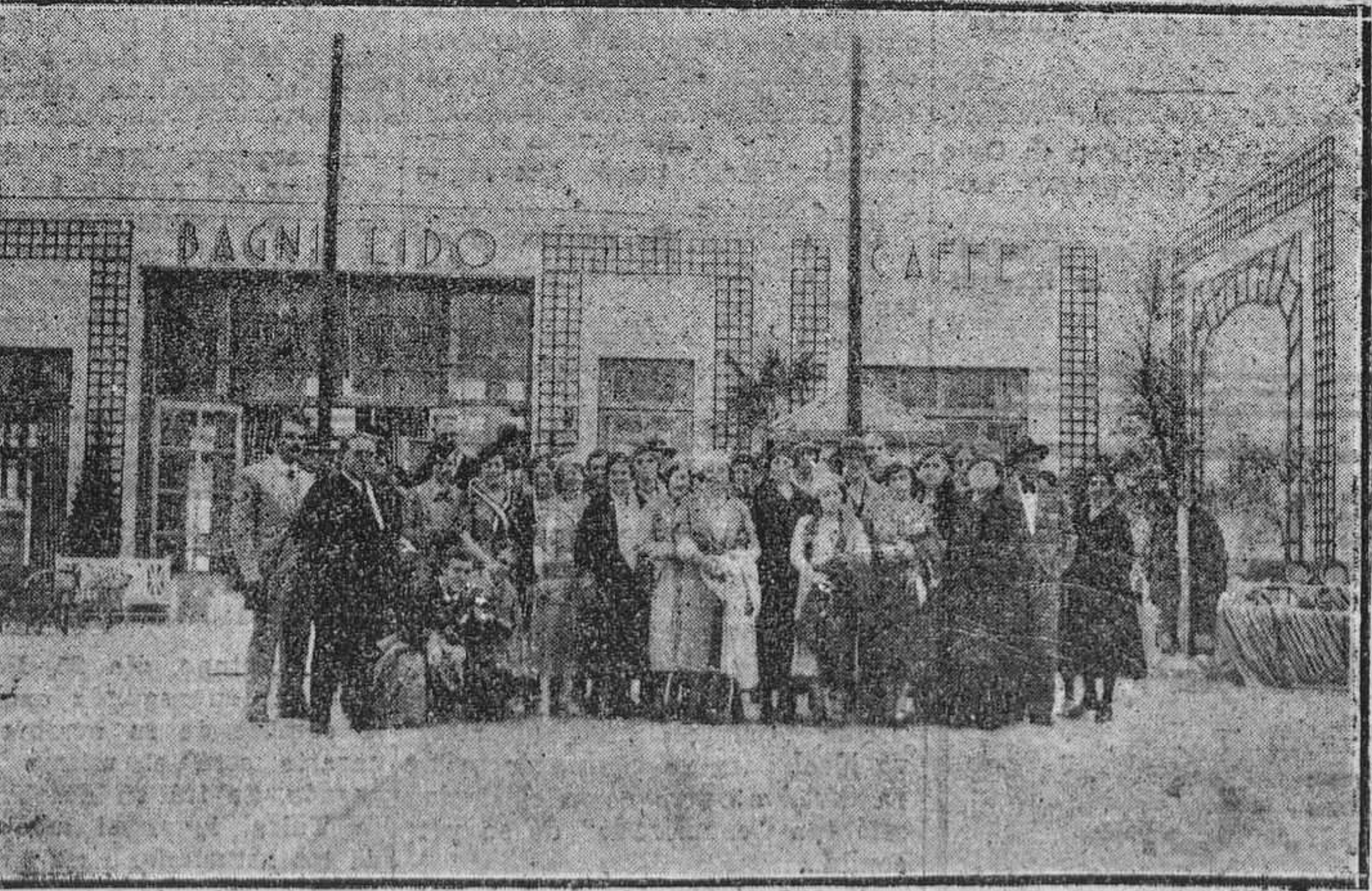
Arriba algunos de los excursionistas en la visita que hicieron a Pompeya y abajo un grupo obtenido en Lido (Venecia)