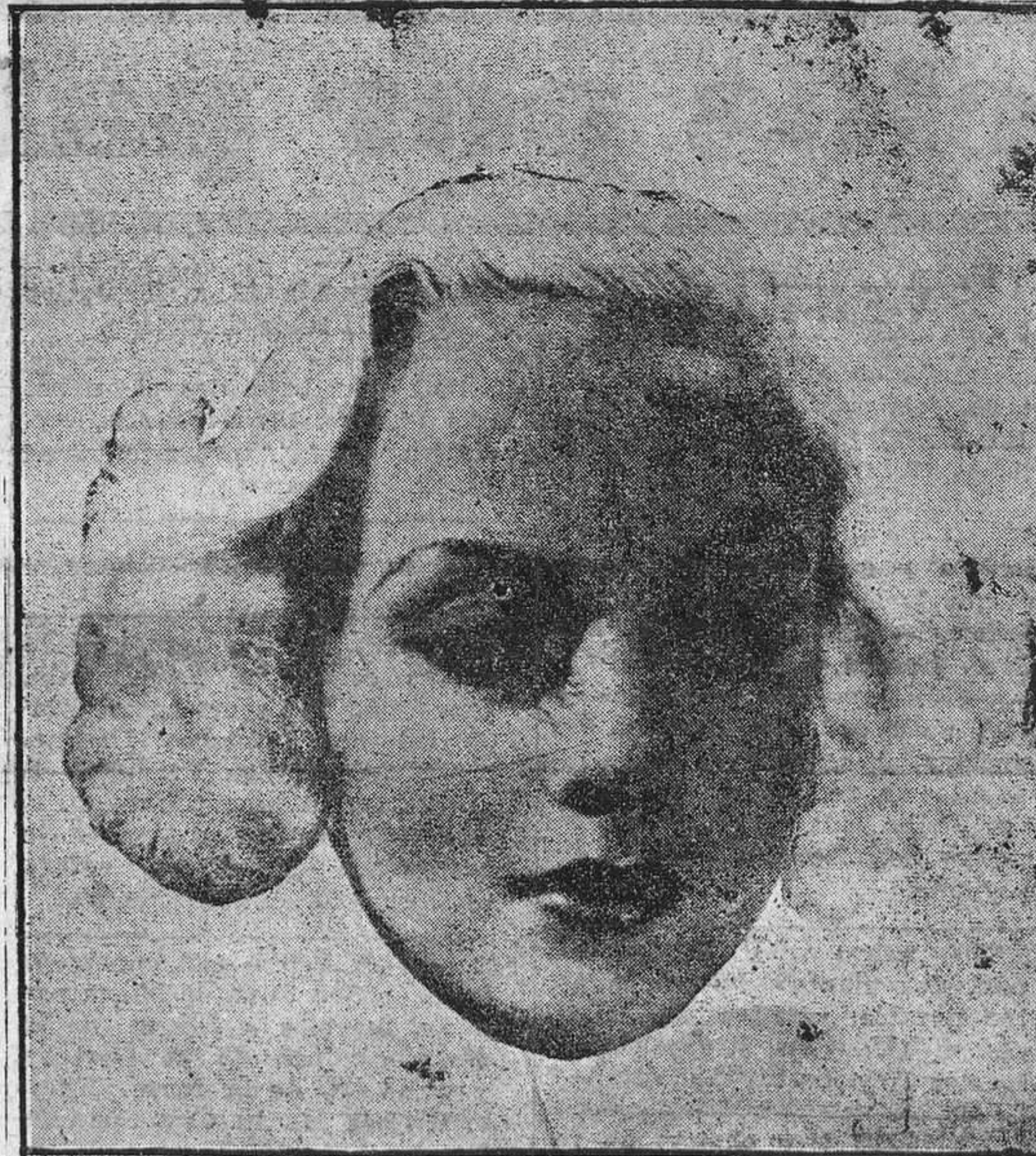
Carole Lombard, una de las más espléndidas bellezas de Hollywood.