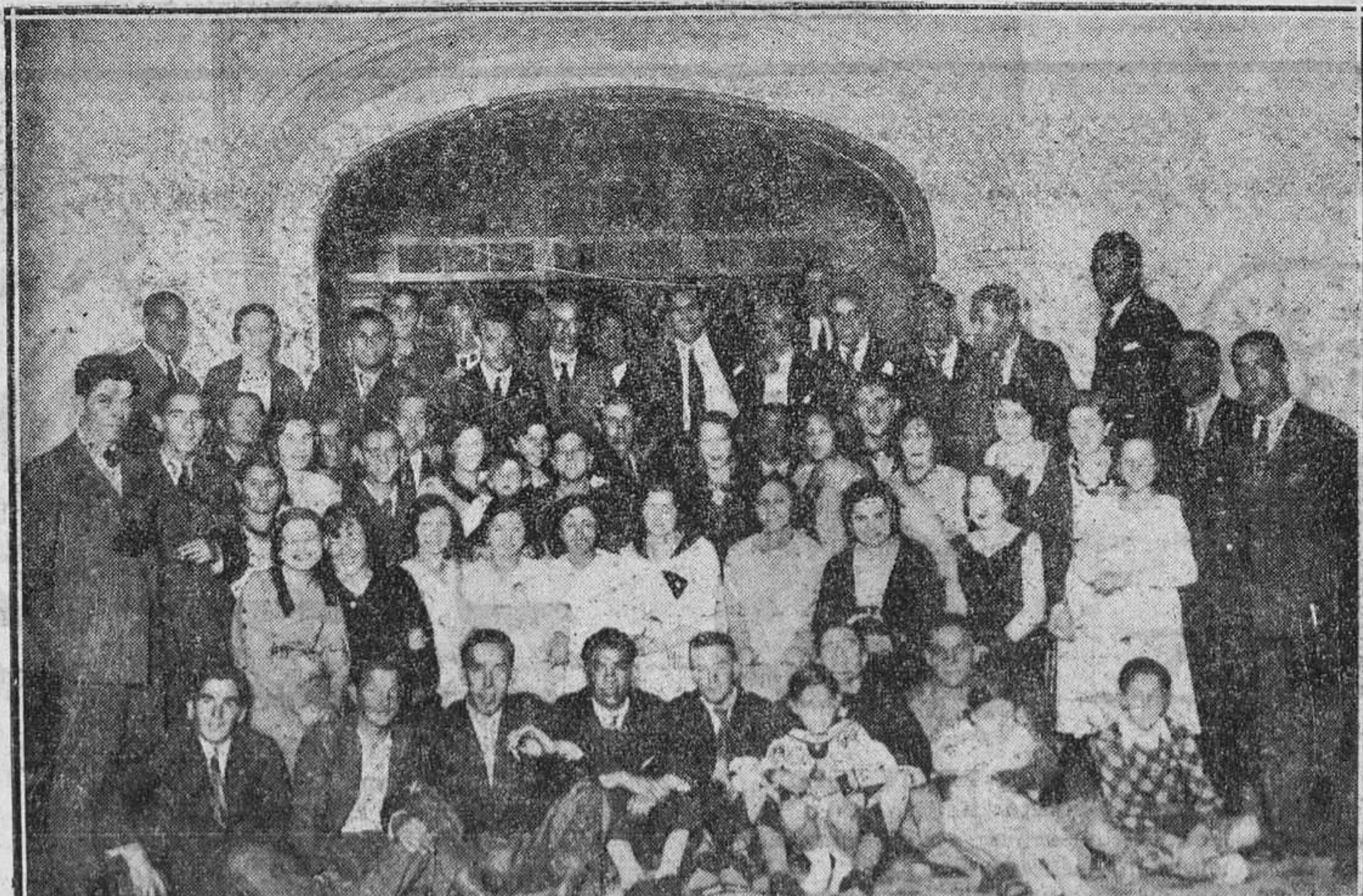
OVIEDO.—Un grupo de concurrentes al baile celebrado el jueves en el Círculo Ferroviario en honor de la nueva Directiva