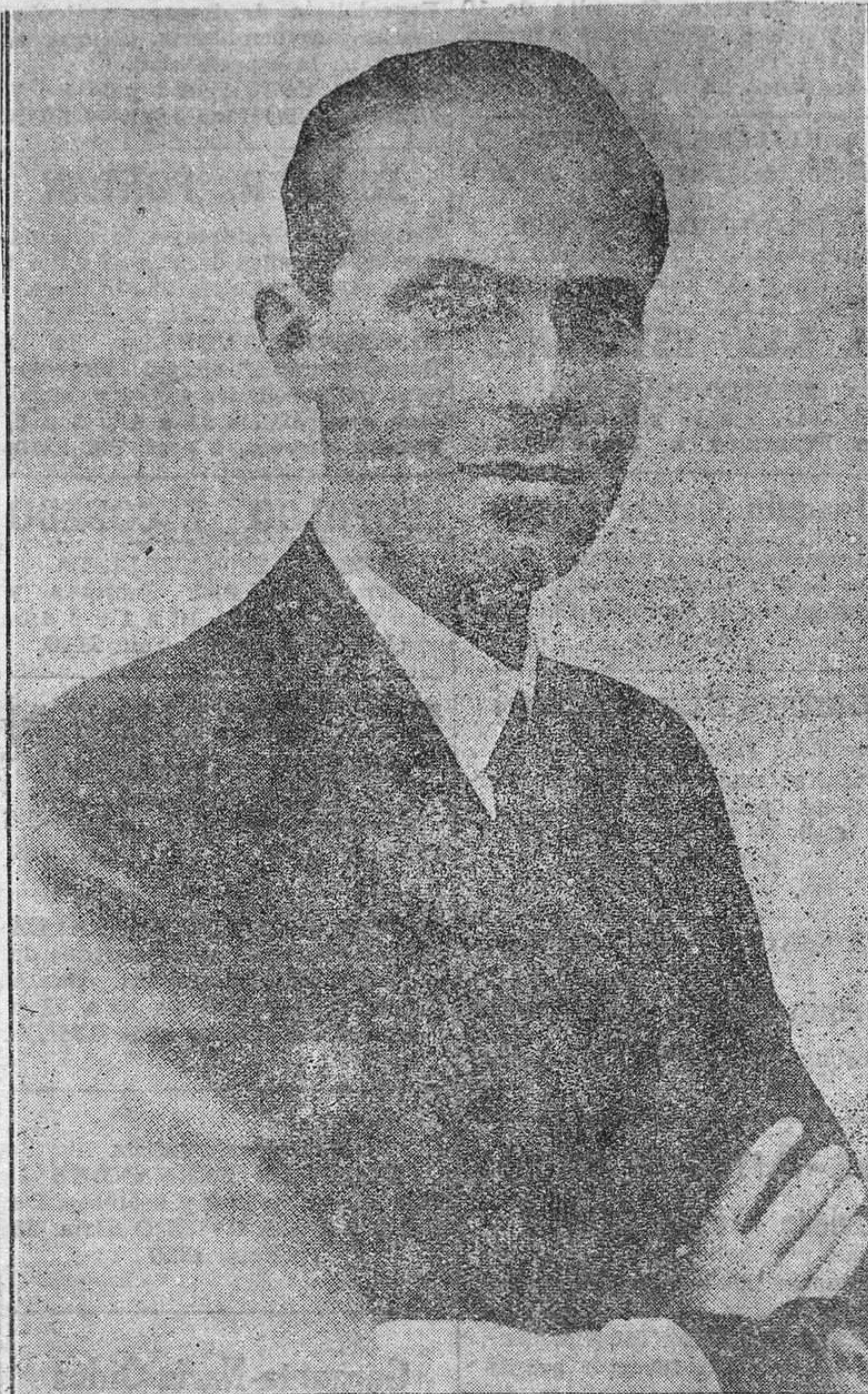
Don Alfonso de Borbón, primogénito de don Alfonso y de doña Victoria, de cuyo matrimonio con una señorita cubana se habla insistentemente. En otro lugar de este número publicamos el rumor de que antes ha renunciado a sus derechos a la corona de España