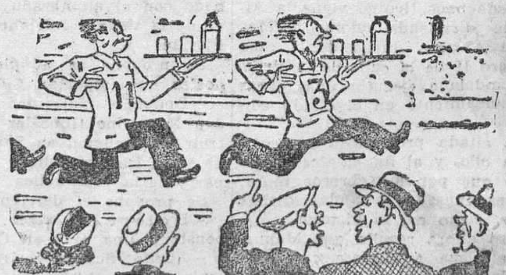
CARRERA DE CAMAREROS