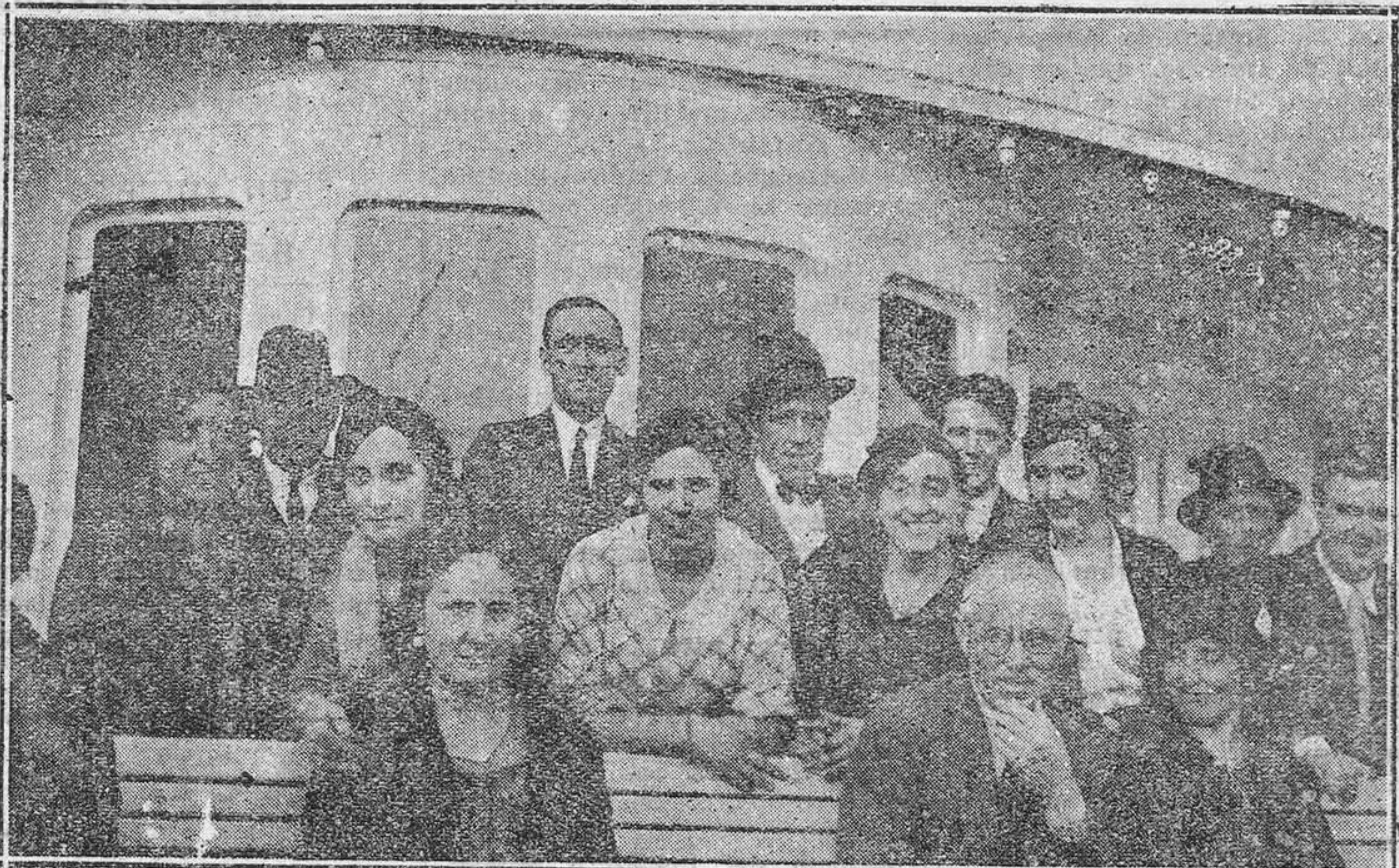
Un grupo de excursionistas en la Plaza de San Marcos, en Venecia, "obsequiando" a las palomas, que son allí una de los "números" de todo turista.—Abajo, una "foto" obtenida a bordo del barco en que los excursionistas hicieron la travesía de Lausane a Ginebra.

industria española se encuentra en una situación grave. Las Cortes Constituyentes, que no han sido elegidas más que para votar la Constitución, se aferran al Poder, pretendiendo que no pueden ser disueltas mientras no hayan sido votadas las leyes necesarias a la consolidación del régimen republicano. En esta categoría de leyes indispensables el Ministerio coloca mu-