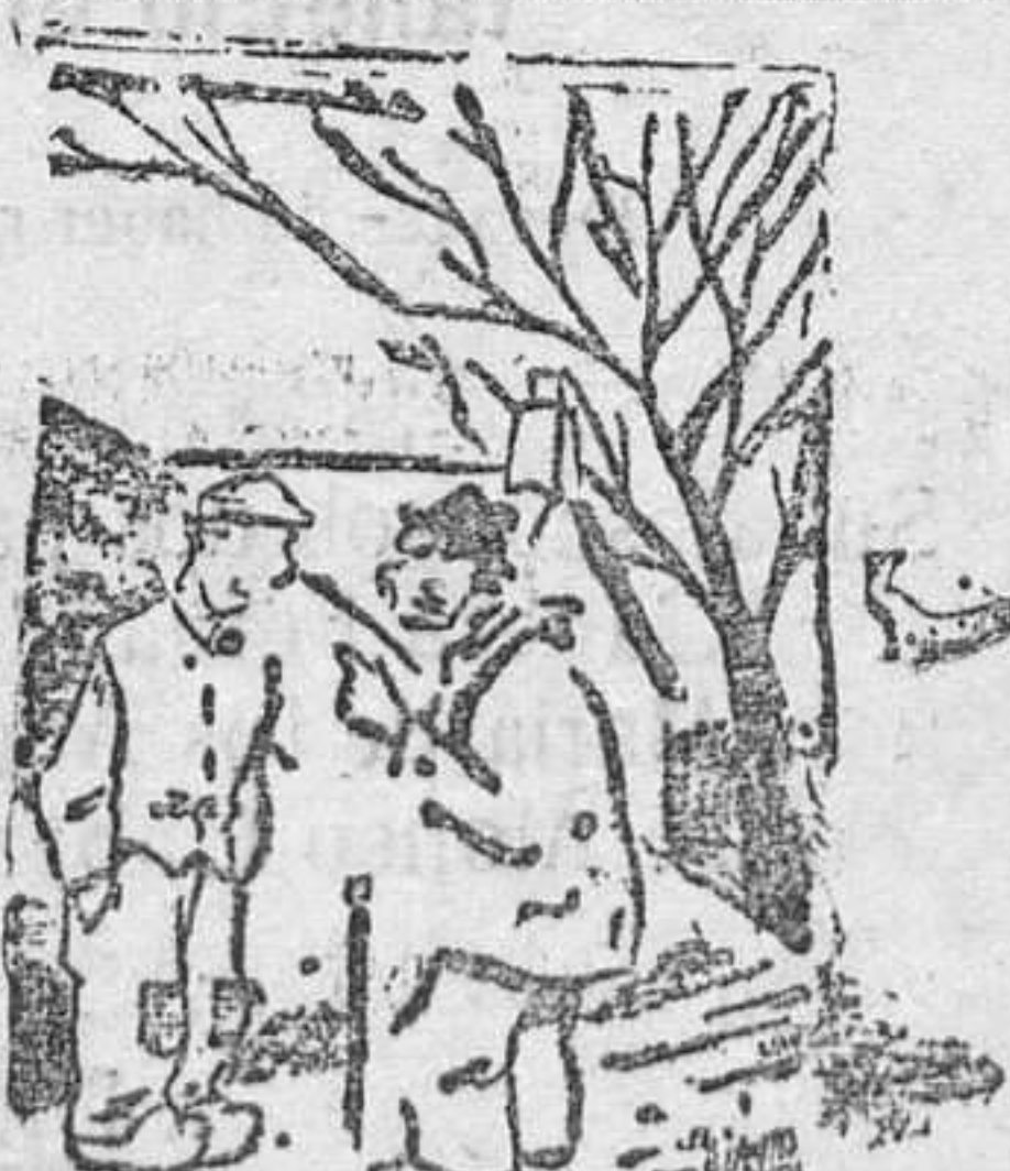
—Me he hecho partidario de las doctrinas de trasmigración. Cuando yo me muera mi alma irá al cuerpo de un animal. —Para eso no es necesario que te mueras, hijo mío. ("Moustique", Charleroi.)