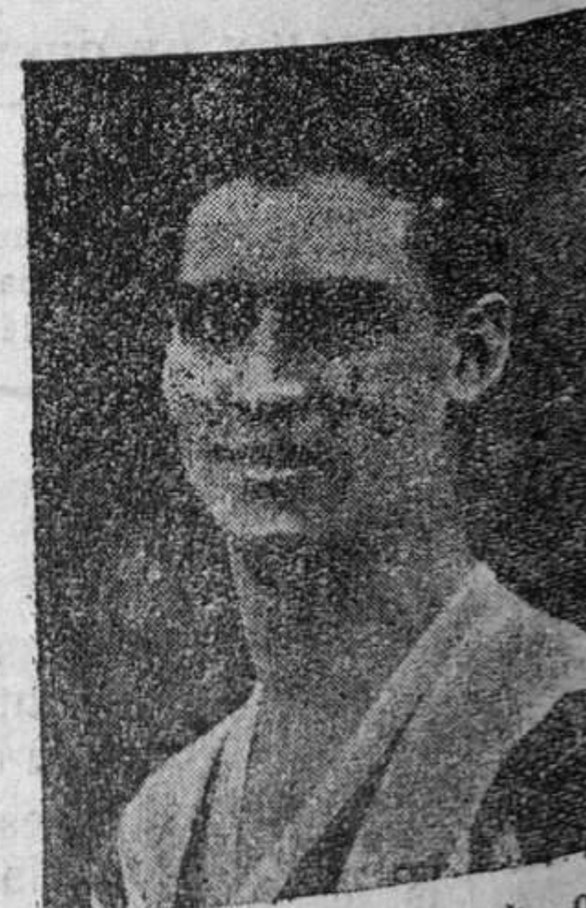
El internacional Bosch, que cree muy posible que el Athletic de Bilbao repita la victoria de San Mamés en Sarriá