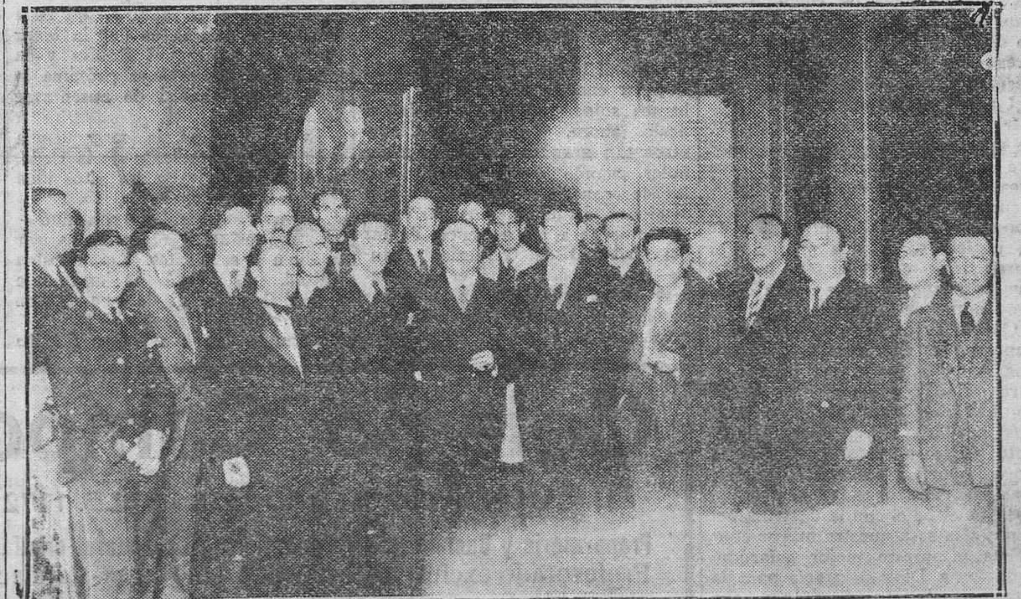
OVIEDO.—Recepción con que el Ayuntamiento obsequió a las comisiones de las Masas Corales que participaron en el certamen celebrado anteaer en Buenavista.