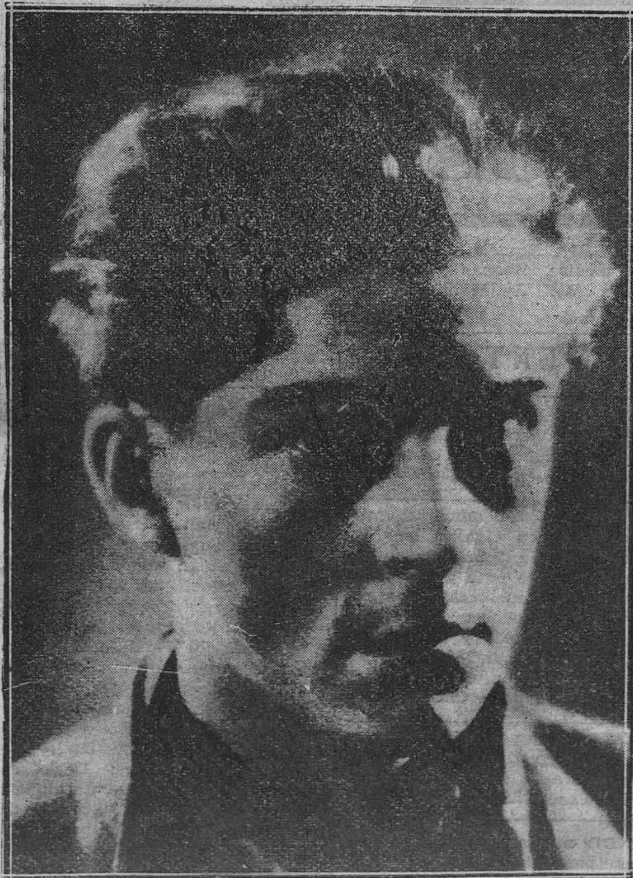
Juab Servals, joven actor de la pantalla, que cada día va acusando más vigorosamente su personalidad artística