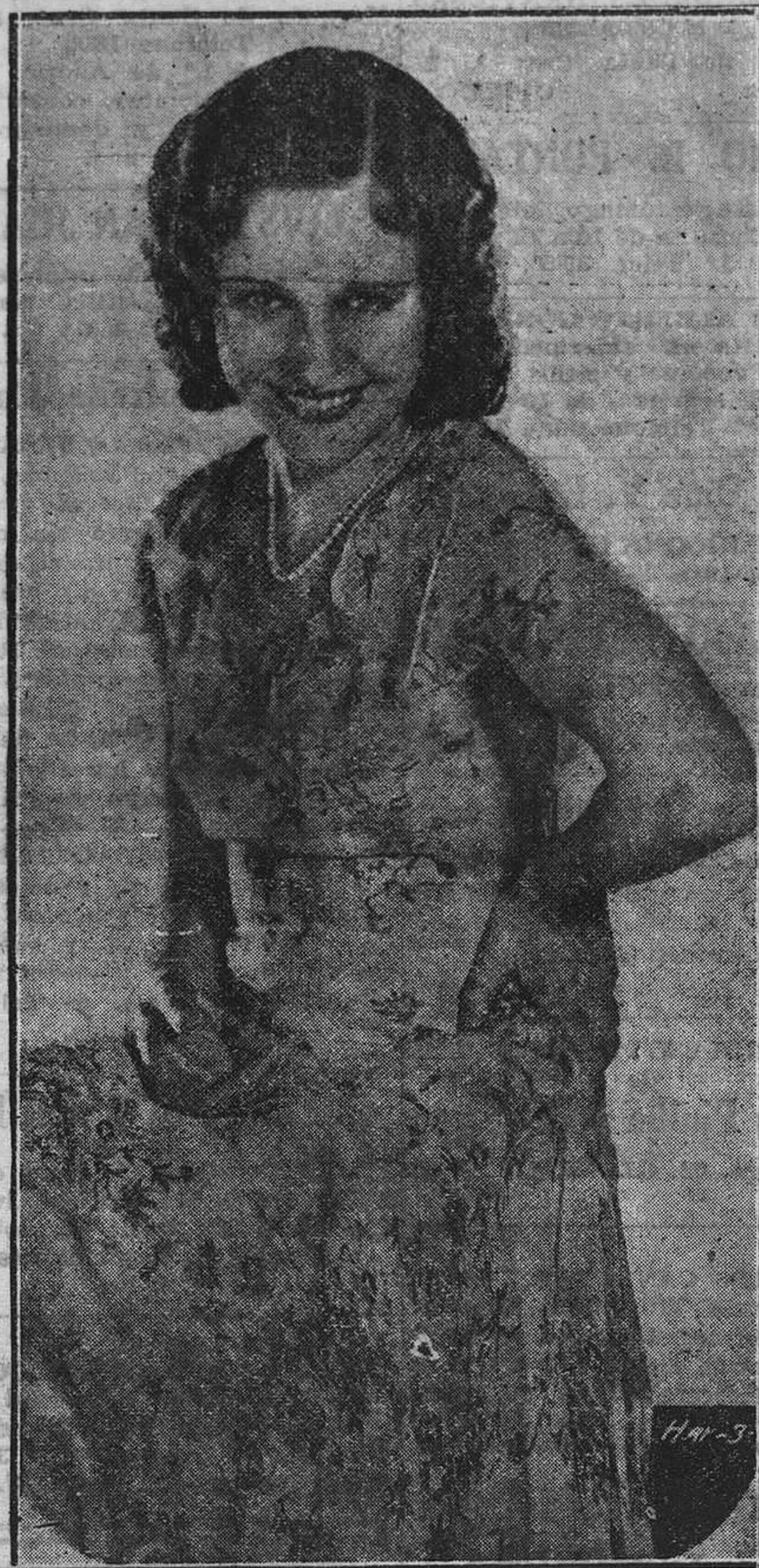
La bellísima María Alba, una de las brillantes estrellas cinematográficas españolas.