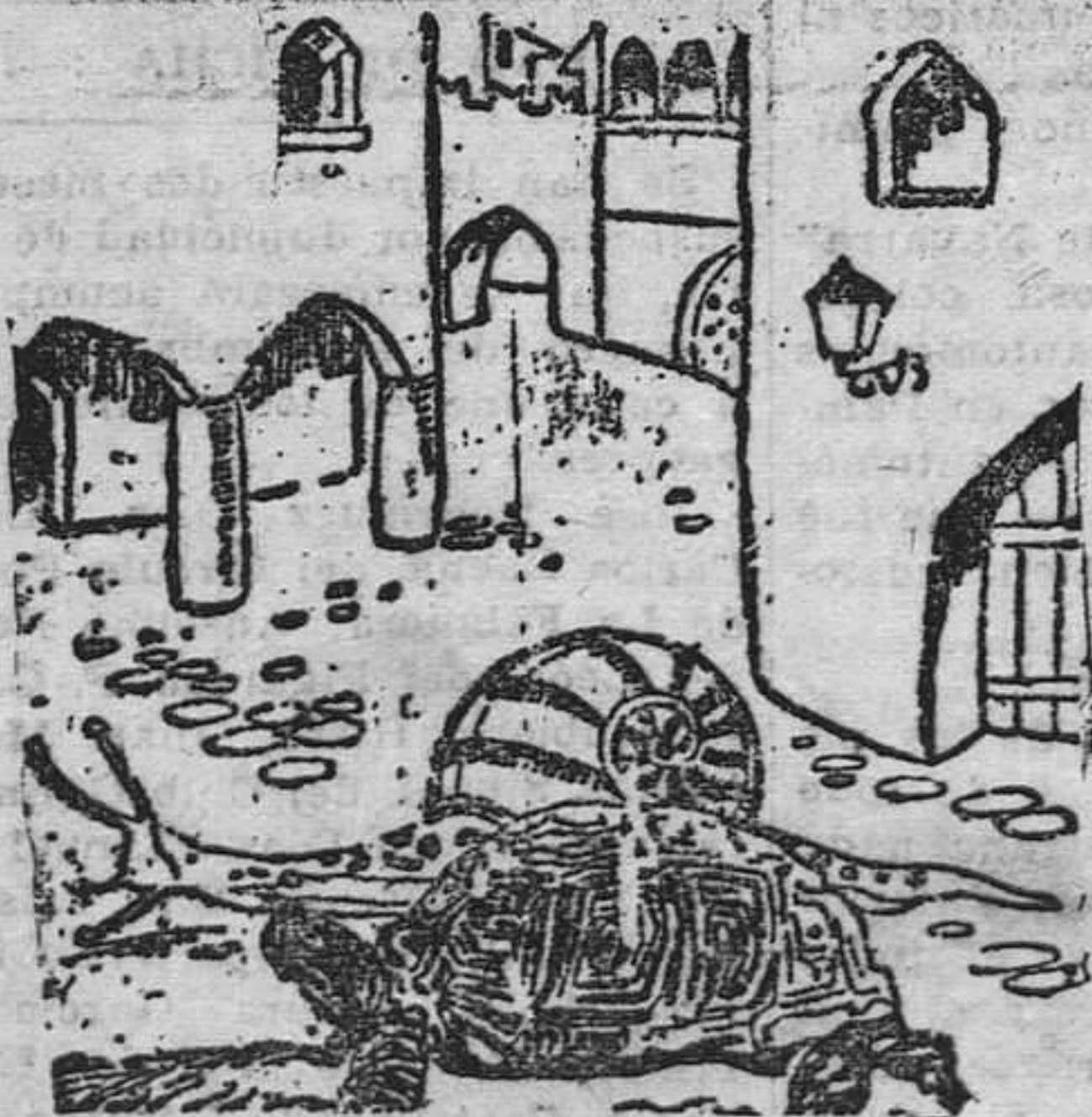
LA TORTUGA AL CARACOL.— Luego dicen que no sabemos correr. (De "El Travaso", Roma.)

Lo he dicho con toda franqueza. La misma política social y laica que el Gobierno Azaña. Tomen nota esas suicidas derechas de intereses que se fiaron del falso conservadurismo y compromisos de la revolución. Nosotros esperamos con toda calma el desgaste y el descrédito inevitable de estos partidos, tras del cual vendrá la hora de verdaderas derechas, que tal vez esté más cerca de lo que a ellas mismas convendría.