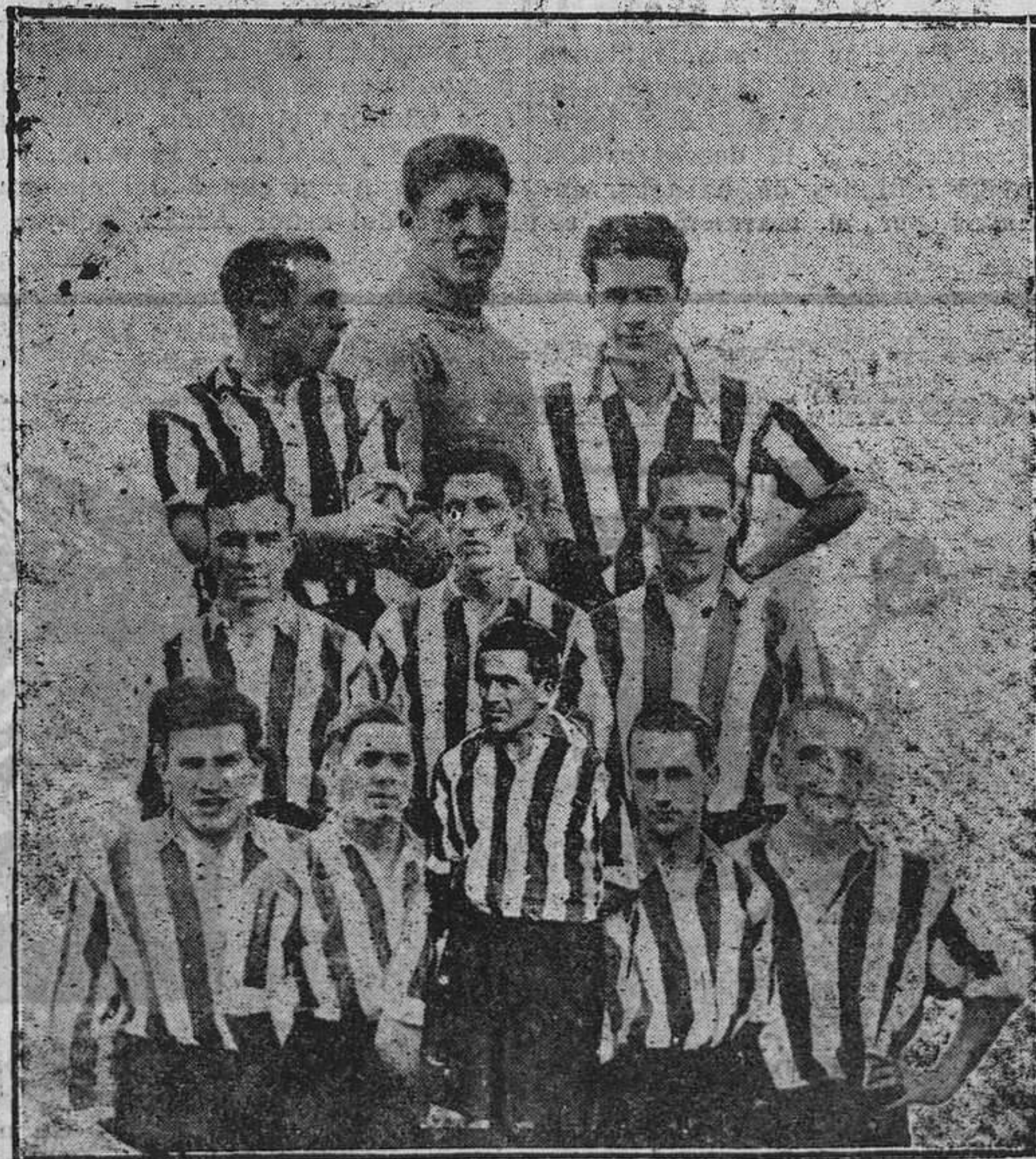
El equipo Athletic de Bilbao, que ha dejado en lugar destacado el pabellón del fútbol peninsular en su gira por Canarias