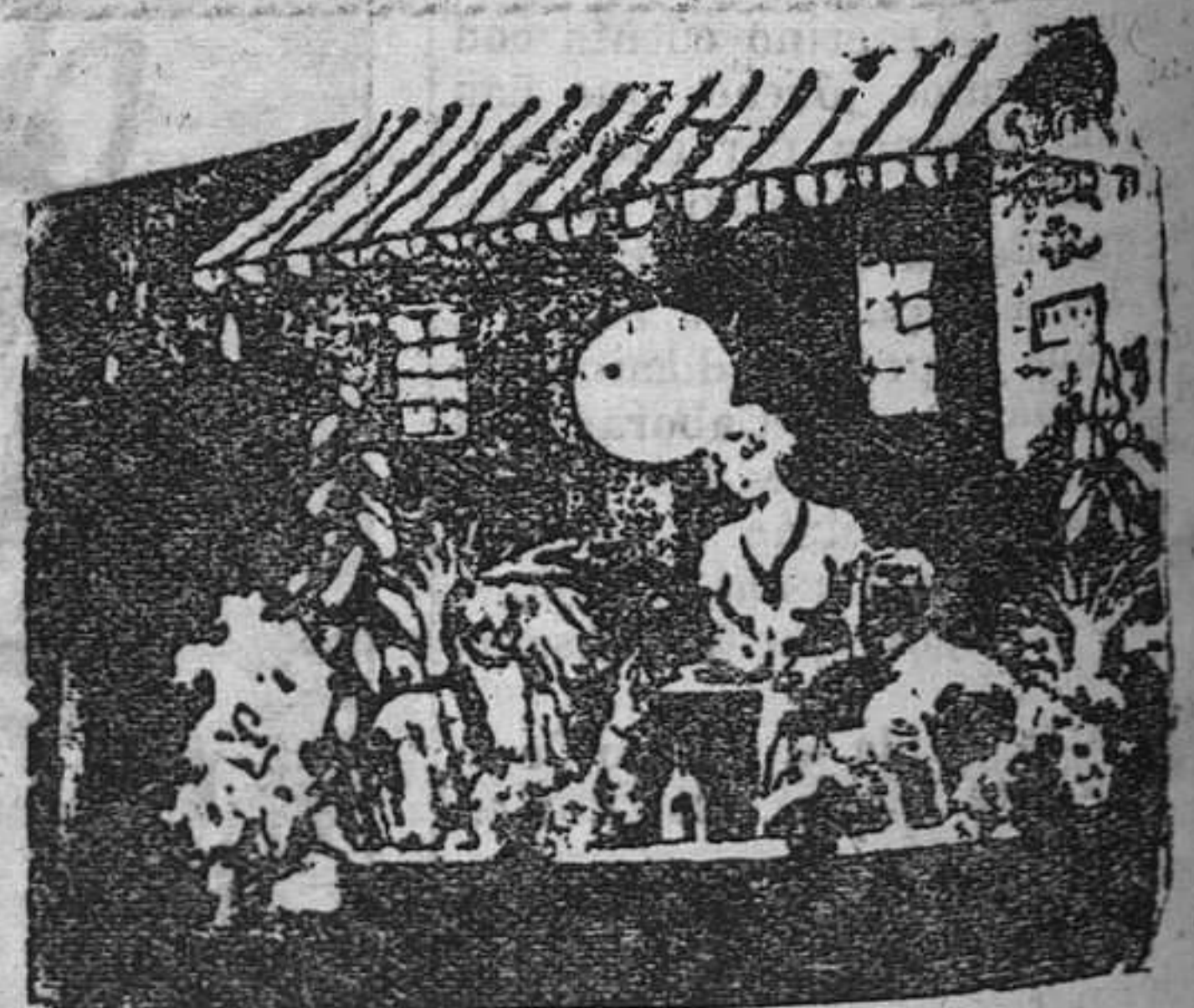
— Sobrina, si tuvieras dos esposos, ¿cuál querrías primero? — Un marido. — ¿Y el otro deseo? — Esperaré a que se cumpla el primero para pedir a mi esposo el segundo. (De "Karlkatzen", Oslo.)