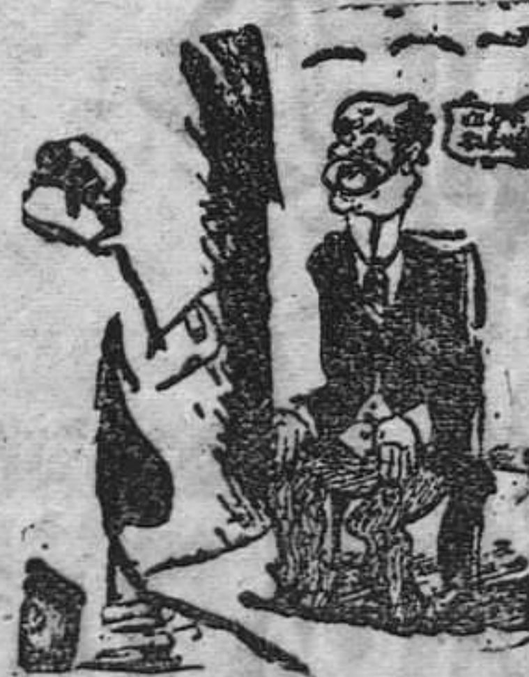
— Una fotografía, grande o pequeña? — Pequeña. — Entonces haga el favor de cerrar la boca. (De "Zeitung", Colonia.)