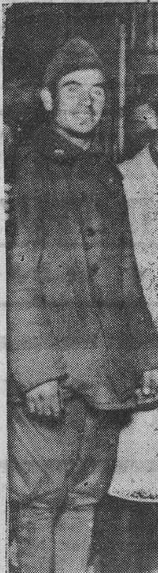
Este soldado desconocido que aparece en la presente viñeta, y al que hemos elegido para simbolizar al Ejército, al que se rinde muy justo homenaje; estos soldaditos, que hoy veremos risueños para agradecer nuestros aplausos y que esquivaron ayer graves frente a la muerte que pretendía cerrarles el paso.

do va a juraros su eterno agradecimiento, prometiéndos no olvidar jamás a los valientes defensores y libertadores de la ciudad, que al amparo de sus piedras milenarias, hicieron revivir en nuestros días las gestas gloriosas de Sagunto y de Numancia.