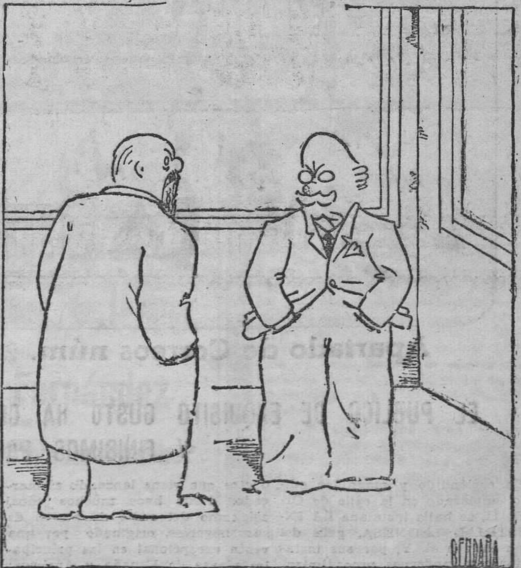
LERROUX AL ARQUITECTO