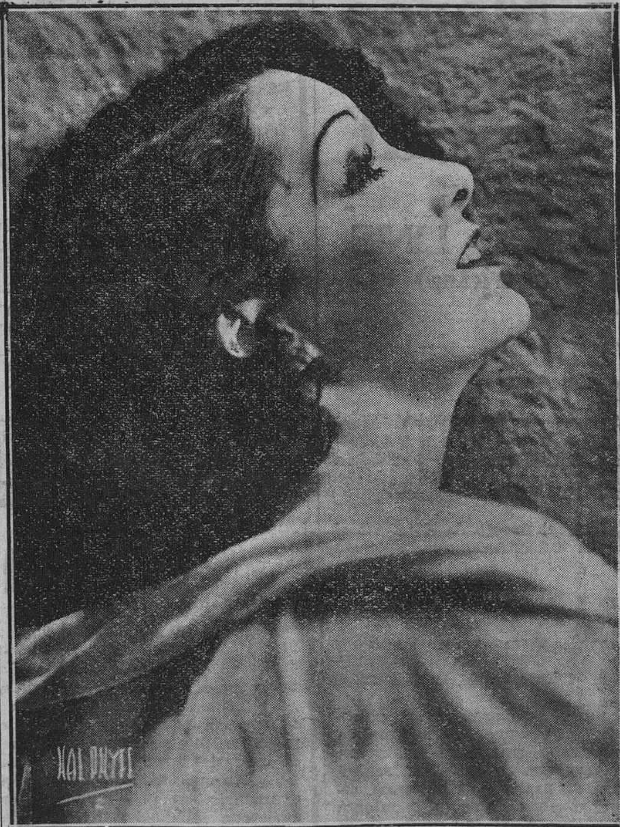
Menuda, airosa, tintada de un color piñón claro tenuamente arrebolado en las mejillas tersas; ojos bellos e inteligentes, nariz corta y vountariosa, boca grande, de labios vivamente rojos, magníficamente poblada por dientes blancos y fuertes. Grácil soltura de quien ejercita varios deportes. Un corazón de oro, fácil a la caridad y a la comprensión. Y un gran talento de actriz teatral y cinematográfica, con el que, muy joven, ha logrado triunfar en toda la línea. Esa es Lupe Vélez, "El ciclón mejicano", como la llaman en Norteamérica por sus éxitos clamorosos.