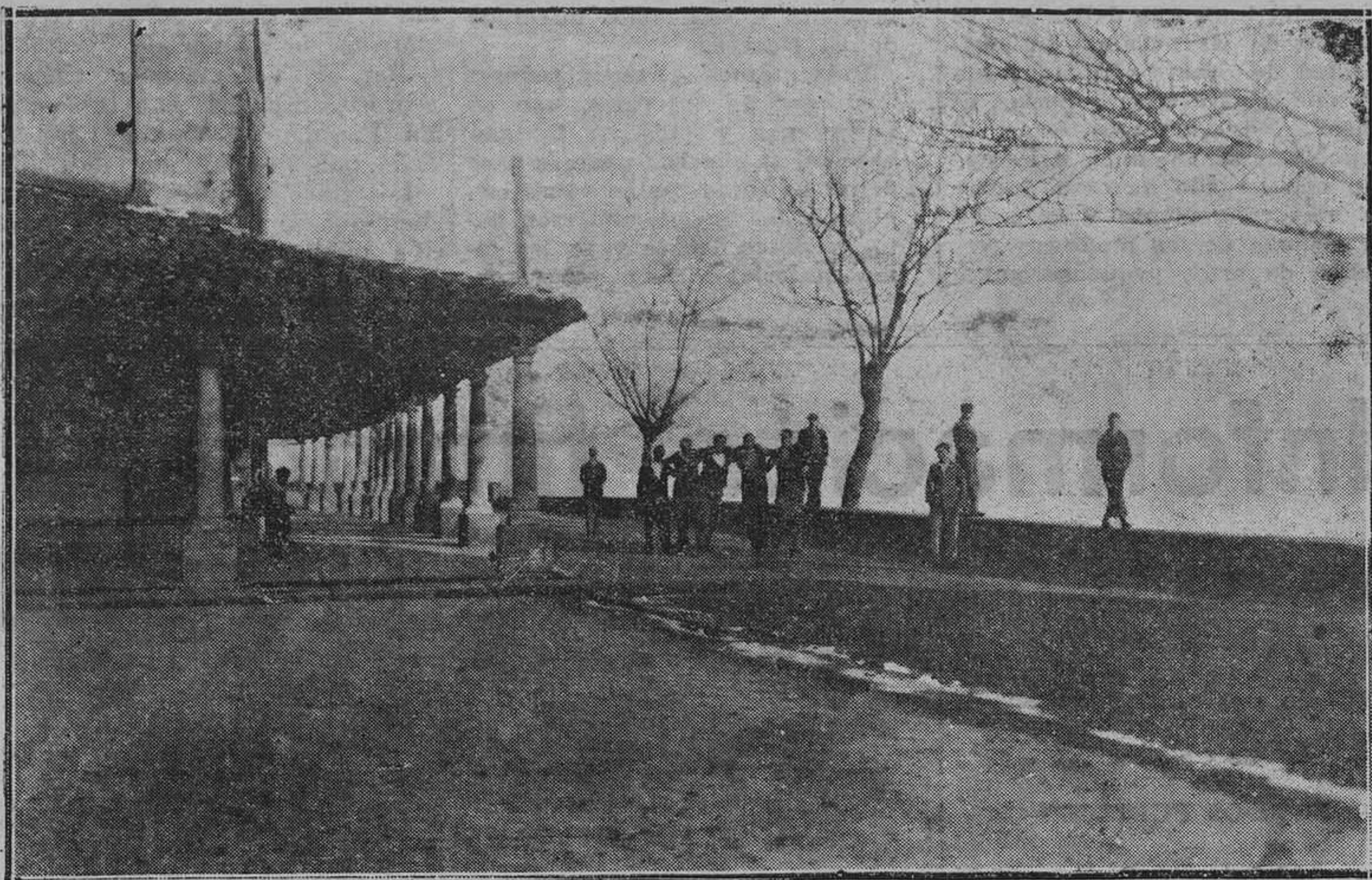
LUANCO.—Oh, Cabildo, Cabildo! Delicioso paseo, encanto del forastero.

A causa de la detención del tren de mercancías, el de viajeros, que debía de pasar a las nueve, no lo hizo hasta las diez, por tener que esperar en la estación de Grado hasta que le dieron vía libre.