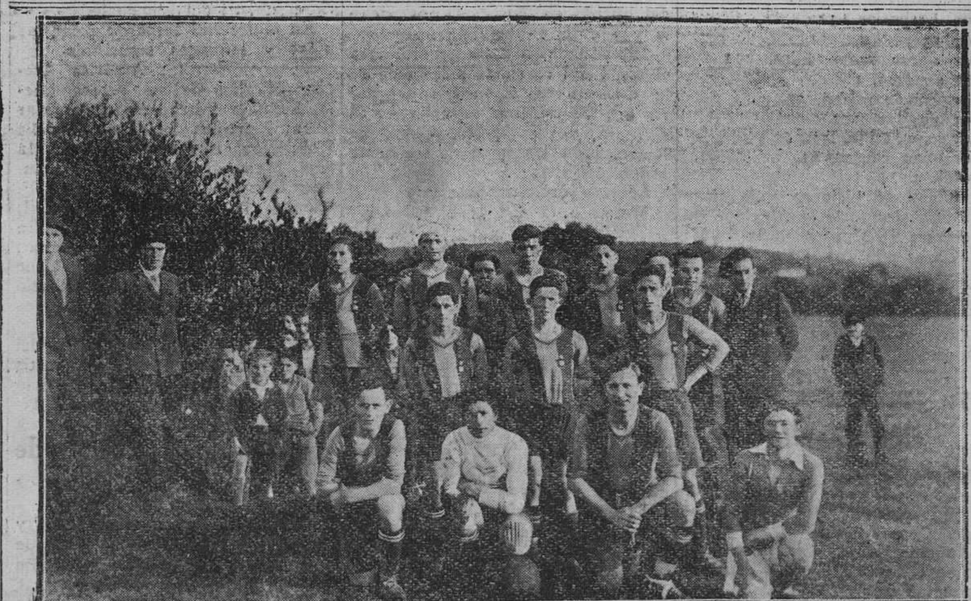
LUANCO.— "Club Marino", equipo de fútbol que va de triunfo en triunfo y que ahora, coincidiendo con las fiestas de los marineros, inaugura un magnífico campo de deportes.