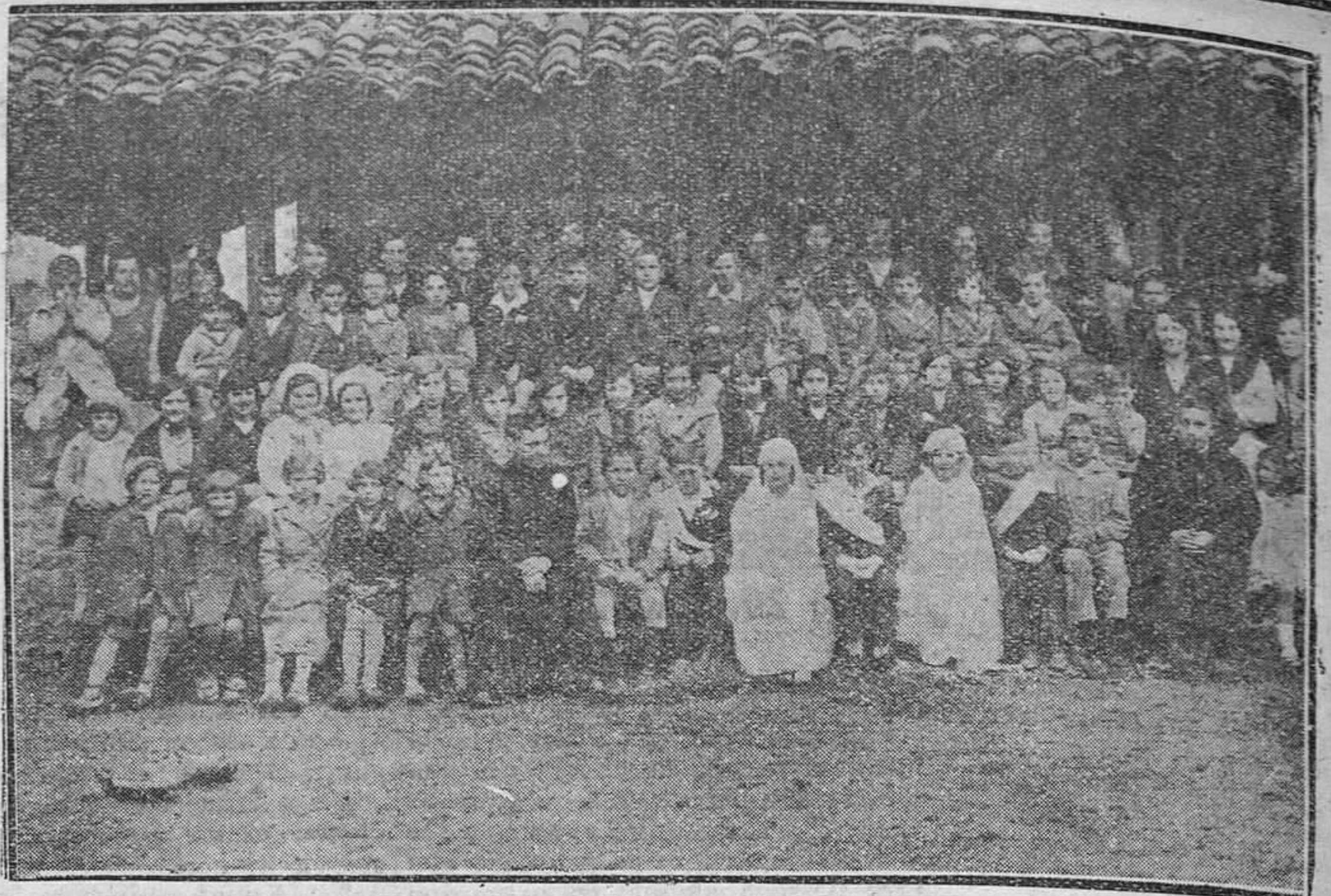
BELEÑO (Ponga).—Grupo de fieles que se han acercado a la mesa eucarística acompañando a dos niñas y cinco niños que por primera vez recibieron la comunión.

Hemos de consignar aquí la excelente impresión que hemos sacado del funcionamiento de las Cantinas escolares de aquellas escuelas, donde diariamente suministran alimentos a unos cien niños de am